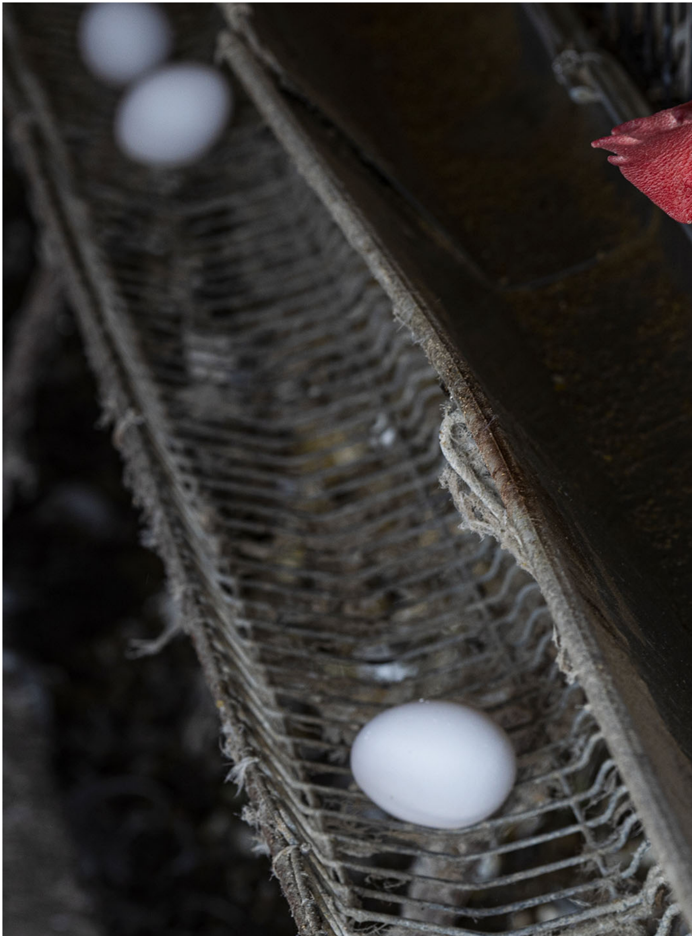
2022年2月10日，彰化传统的蛋鸡场。

动植物防疫检疫署回应时强调，依世界动物卫生组织（WOAH）及台湾动物卫生标准，野鸟案例不被认定为发生禽流感案例，巴西6月27日出现后院饲养禽只确诊禽流感案例后，即立即公告巴西自禽流感非疫区除名。而针对专案进口鸡蛋检疫措施，防检署表示是参考WOAH以及美国、日本及欧盟等对禽流感采取“区域化”认定的规范，故蛋品仍可自非疫的“畜牧场”进口。