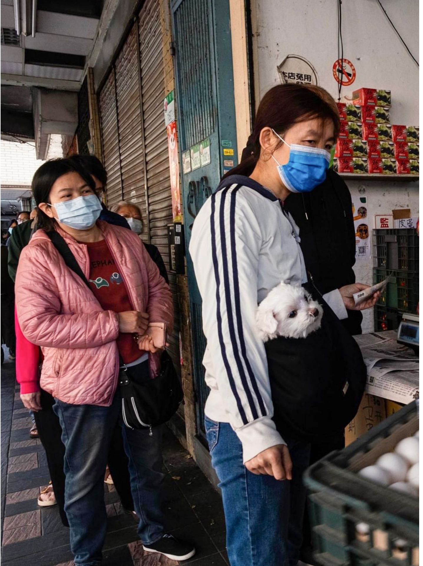
2023年3月8日，台北大同区，一家蛋行外，蛋荒期间，市民清晨开始排队购蛋。