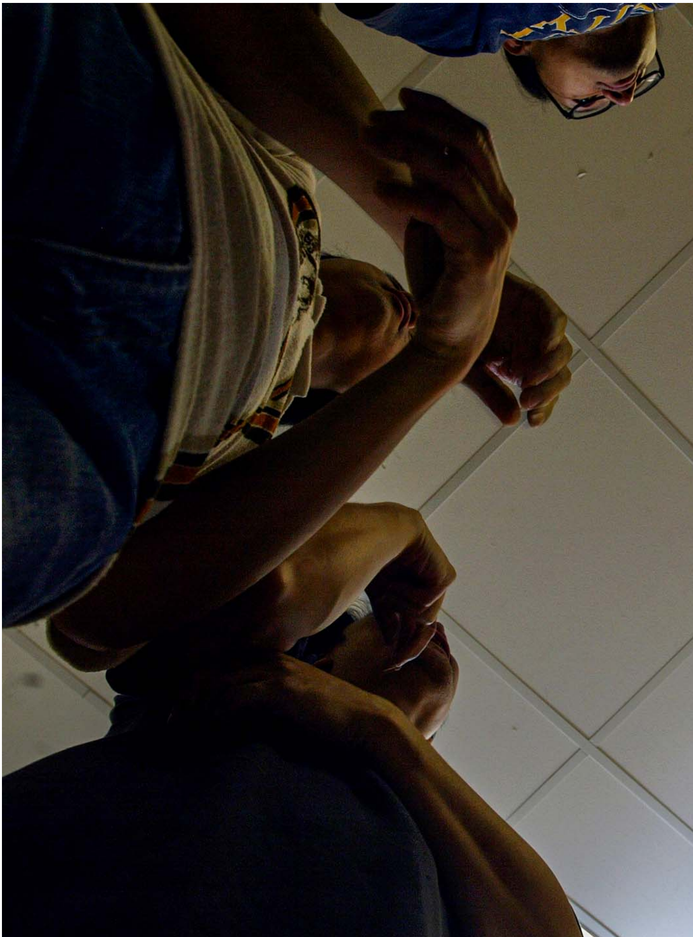
2004年10月4日，香港，一个聋哑剧团在铜锣湾社区中心。

不过，身处瞬息万变的倡议行动，有些时候确要义无反顾地献身，但在别的时候却必须咬牙屏息，策略性地故意让沟通不能顺利发生，这也是一门学问。多年前，我们跟一群聋人朋友拿著抗议横额游行往平等机会委员会办公室，原意是要跟会方坐下，正式申诉电视缺乏实时手语传译的。到大家围坐一起时，职员才记起没有安排手语翻译，在场的聋人抗议者都傻了眼。“那么，能请在场的健听申诉人帮忙沟通一下吗？”职员这样问道，聋人和我们的答复是：当然不可以。就在职员们大汗叠小汗打电话找人之际，聋人朋友向在场的传媒气冲冲地将这事和盘托出。第二天，“平机会带头歧视聋人”的新闻就登出了，而为记者和聋人之对话作传译的，当然是我们。