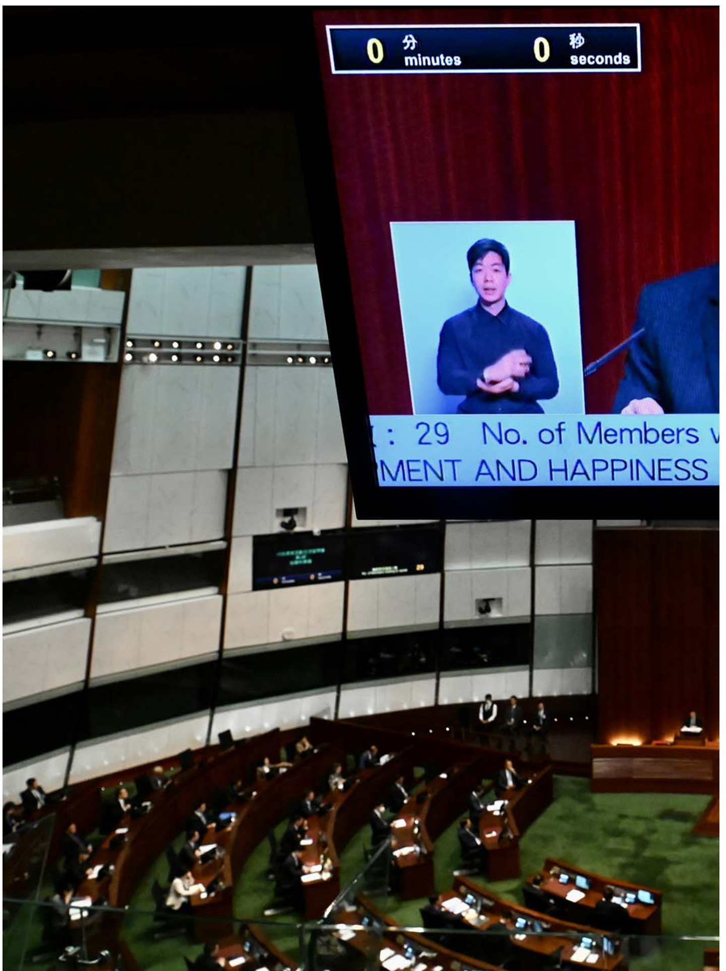
2023年5月18日，香港，行政长官李家超出席立法会答问。