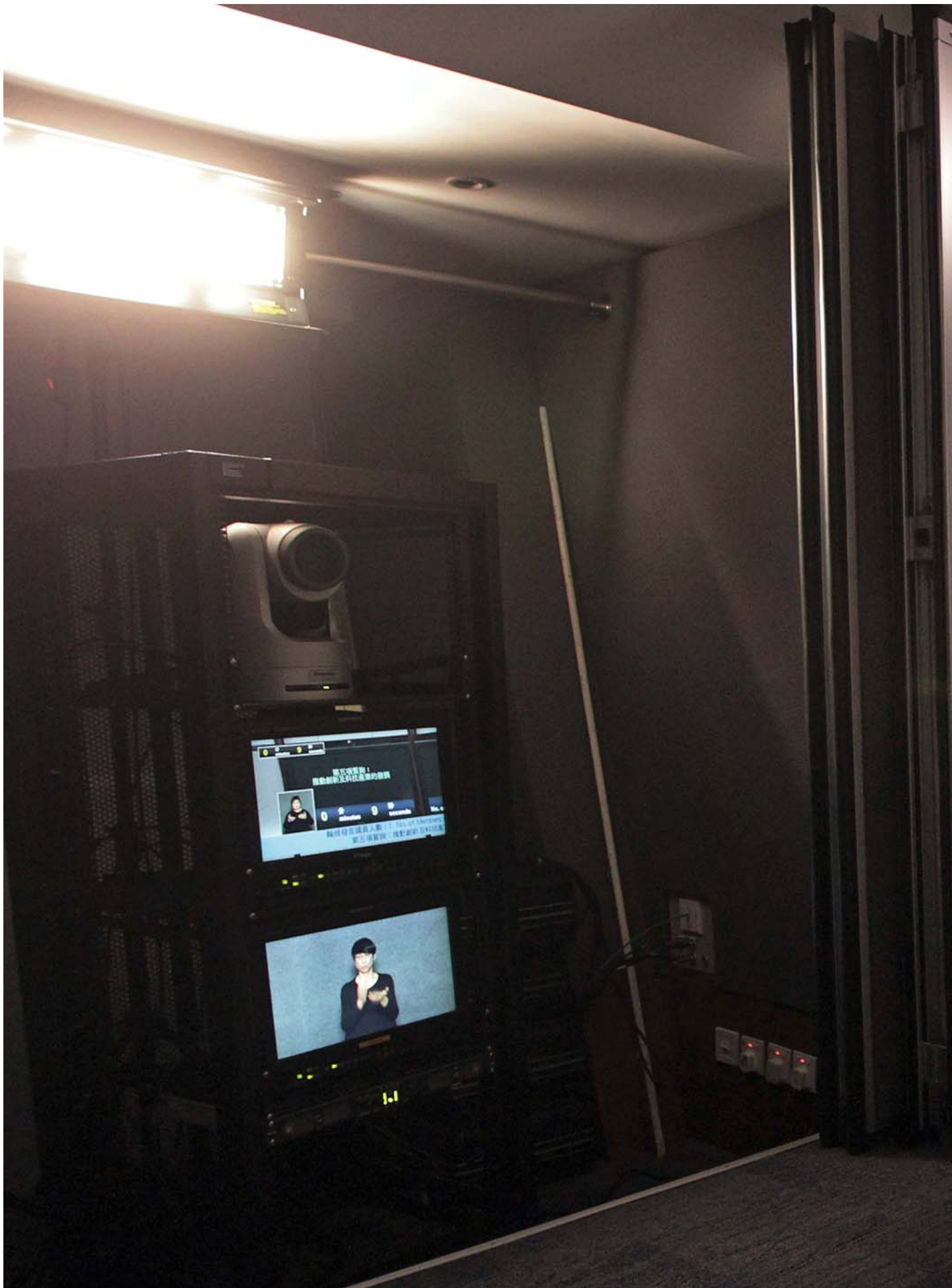
2015年12月16日，香港立法会，手语翻译员在工作。