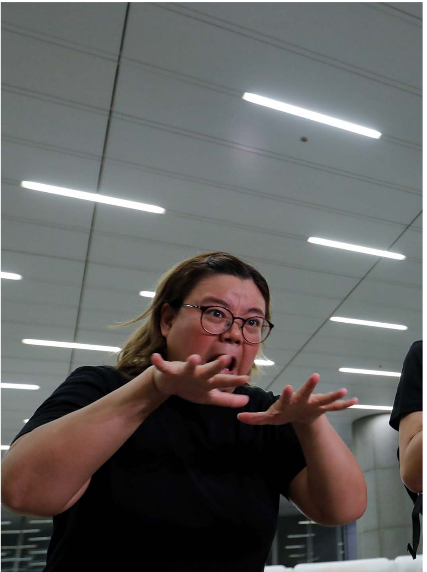
2019年9月4日，香港，手语翻译员在抗议者的新闻发布会中。