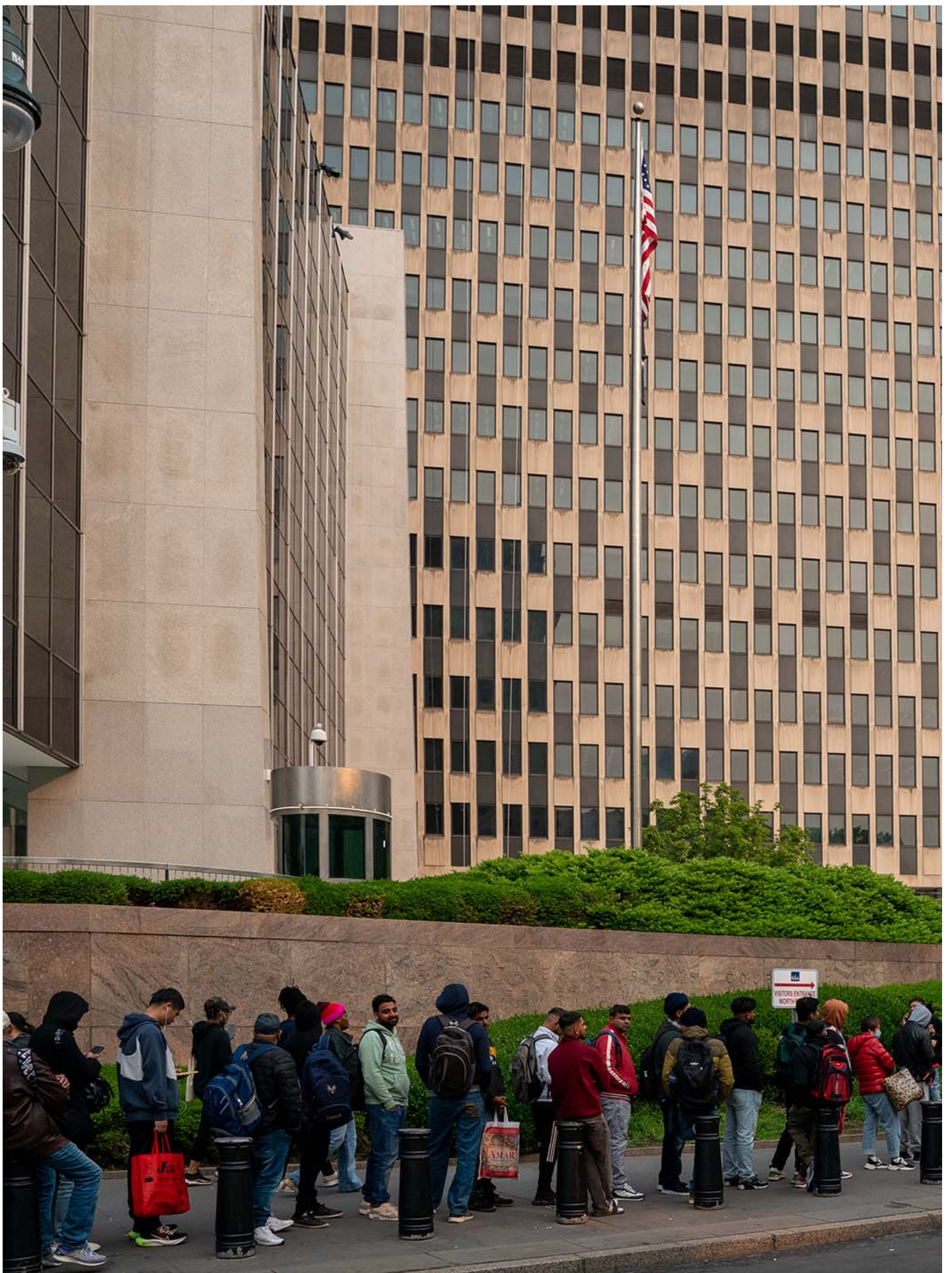
2023年6月6日，纽约，数百名难民在政府大楼外排队，寻求庇护。

《纽约时报》 指出，拜登可以向某些国家的人民提供人道主义救济，这种救济可持续18个月并附带工作许可，或者拜登可以人道主义为由向难民签发工作许可。但前者面临严重积压，据统计目前已积压超过42万份申请等待处理，平均处理时间为13个月；而后者已面临21个共和党执政的州的法律挑战。（延伸阅读： 《枪击案后看移民：到了美国他们都经历了什么？》 ）