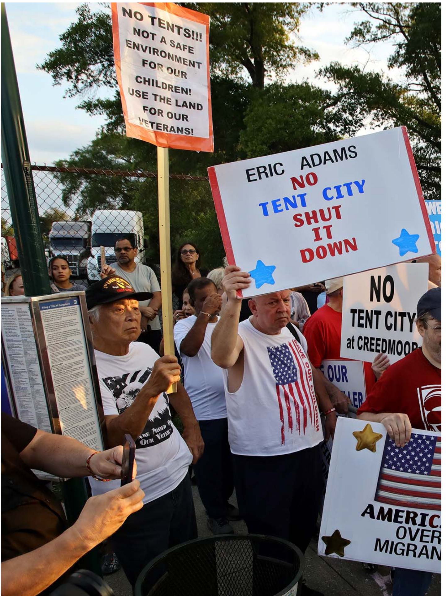
2023年8月16日，纽约，示威者高举标语，抗议难民在城市中露宿。

《华盛顿邮报》 的报导指出，从非正式谈话中得知，抵达大城市的大多数难民都来自委内瑞拉。与墨西哥难民不同，委内瑞拉难民很少在美国有亲友可以投靠，这使得它们高度依赖公共服务和政府安置。对于安置工作来说，大城市的住房供应紧张增加了其难民。 《今日美国》 统计，纽约的平均租金中位数高达3650美元一个月，而芝加哥则高达1895美元一个月，这也导致难民即使在有工作的情况下也难以搬离庇护所。（延伸阅读： 《买不起食物、没有药物、在加油站排长队：一位委内瑞拉记者眼里的日常》 ）