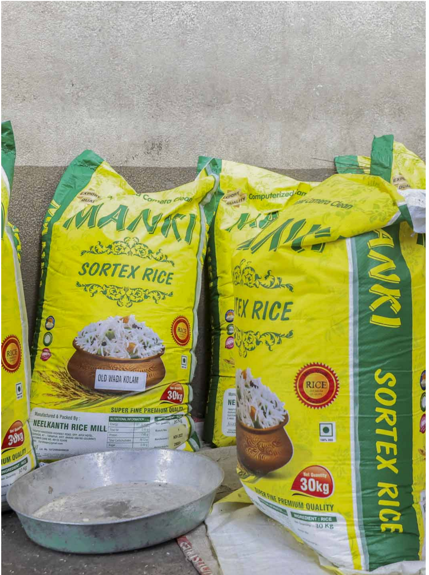
2023年8月4日，印度孟买，一名妇女在批发市场清理米粒。