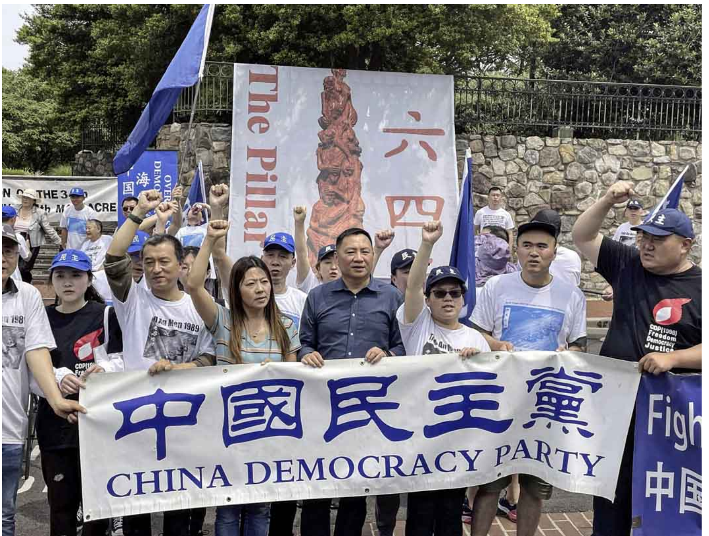
2023年6月3日，89民运领袖王丹与其他参与者在驻华使馆前游行抗议。

记者观察发现，许多海外民运人士以“反王丹就是不反共，要顾及反共大局”的底层逻辑为王丹辩护。吕京花（八九民运“北京工自联”组织者）[转推]( https://twitter.com/gogofreewall/status/1666603903436181504?s=20 ), “不反共，什么平权都是无稽之谈”；陈维健（海外民运杂志《北京之春》主编） 认为 ，要反共就无法抵制王丹；魏京生（文革后北京民主墙运动推动者） 质问 ：“对一个战壕里的战友，因为他有缺点就任由敌人抹黑污蔑吗？”