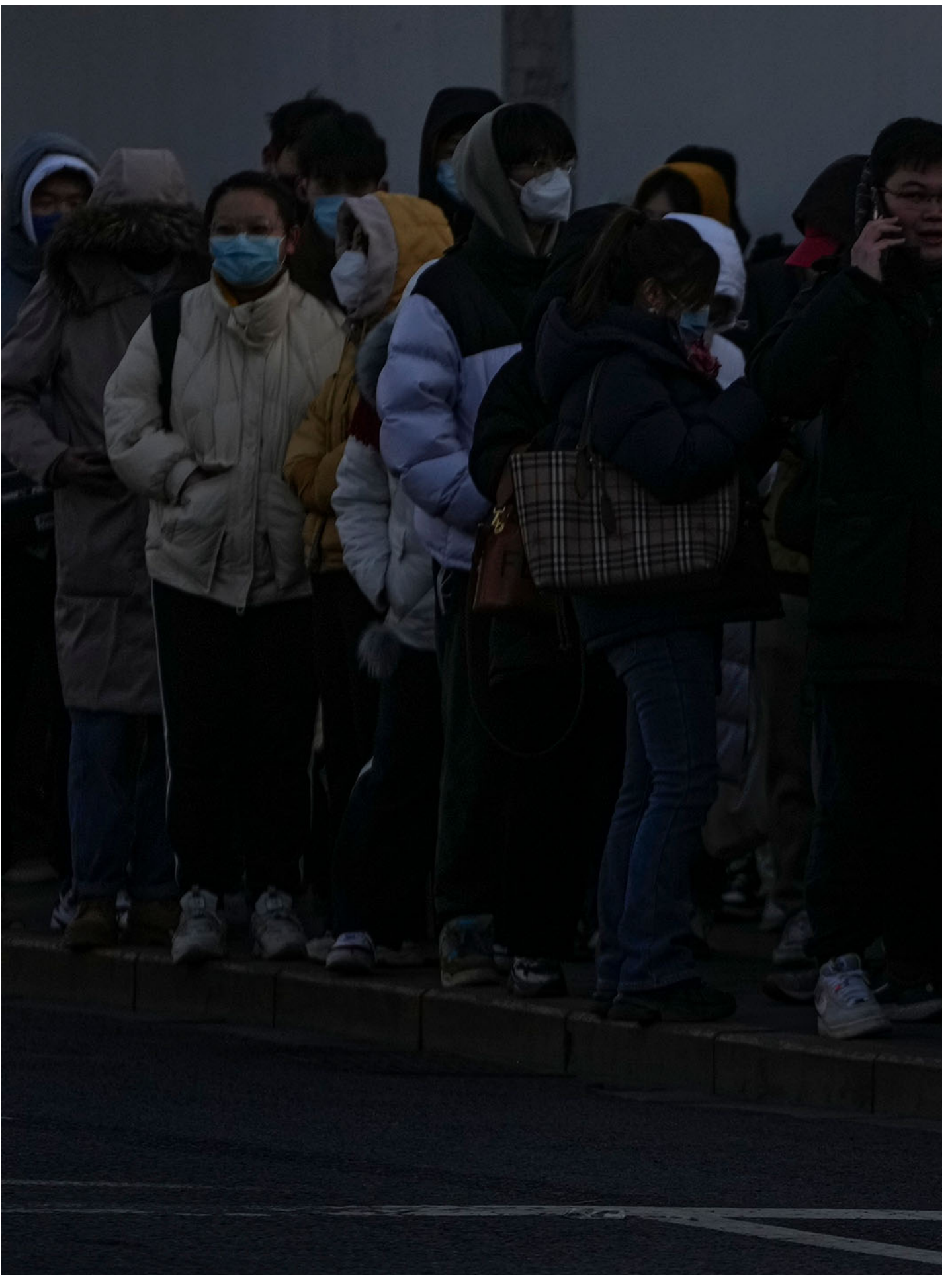
2023年2月13日，中国北京，一名女子在街道上经过。

在#MeToo浪潮里，王丹先向公众质问自己的权势何处之有，第二天又 发推特 引述“朋友”的建言称，“权势不权势，某种程度是一个感受问题，这种感受应当被理解和尊重”，并补充称，自身“道德优越感”导致“不容易听进去批评”，会对此反省。此前，他 回复《华尔街日报》 称，“作为公众人物，个人私生活会受到更加严苛的检视”，未来会更加注意。他也 表态 ，#MeToo代表“个人权力的伸张”（注：应为“权利”），是他支持的社会进步事业，愿意借此和“各界朋友交换意见”。