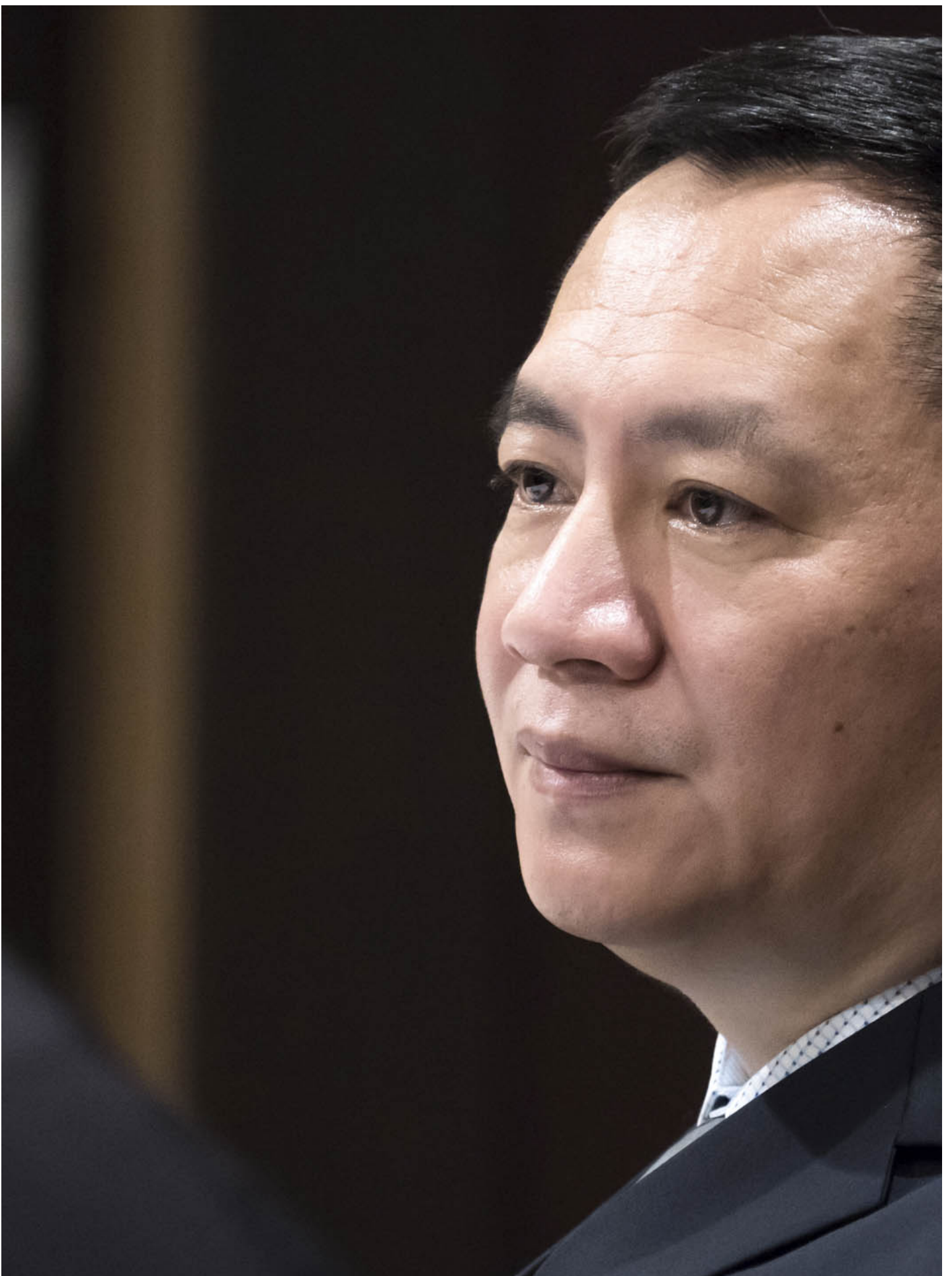
2022年12月1日，前北京学运领袖王丹在日本东京出席日本外国记者俱乐部举行的新闻发布会。

民运圈由对抗中国政治体制、立志推动民主法治进程的运动者组成。从文革结束后的民主运动，到八九民运，再到本世纪初的公民运动与维权行动，凡是参与其中的抗争者、异见人士、律师、记者、NGO工作者等，都能被笼统地归为“圈内人”。流亡后长期在国外从事中国民主活动的群体，与在国内推行社会运动的行动者们，可分别被称为“海外民运圈”与“国内公民圈”。两个圈子相交却不重合，但均站在中国政治体制的反面，常被一起讨论，视为一个整体。