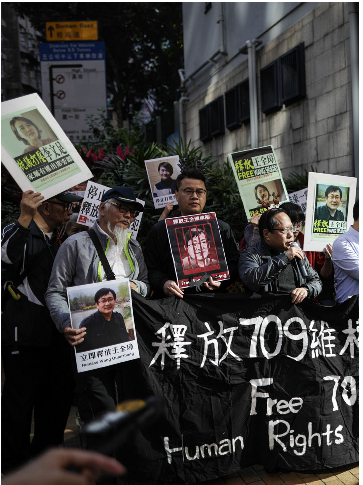
2018年12月26日，香港多个政党及团体高举海报，到中联办的抗议中国“709大抓捕”，打压维护人士。

赵威回忆，感到绝望的那段时间，由于无法反抗，更无处诉求正义，她只能更加贬低自己，甚至合理化侵害，让内心好受一点。“就像戴手铐一样，越挣扎就铐得越紧，”她说，“如果是一个loser的心态的话，对方怎么对待我，好像都变得自然了，所以挣扎就会逐渐变弱，可以说给自己取得一个更大的生活空间吧。”