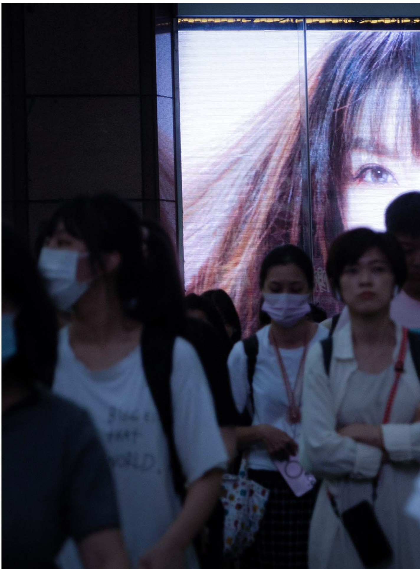
2023年6月9日，台北，行人在广告萤幕前走过马路。

在民运圈#MeToo中，唯有对王丹的指控进入了司法程序，而他 公开直言 “欢迎提告，支持用法律的方式寻找事情的真相”。很多人也以“理性客观”的姿态批评#MeToo， 强调 “法律程序正义”的重要性。