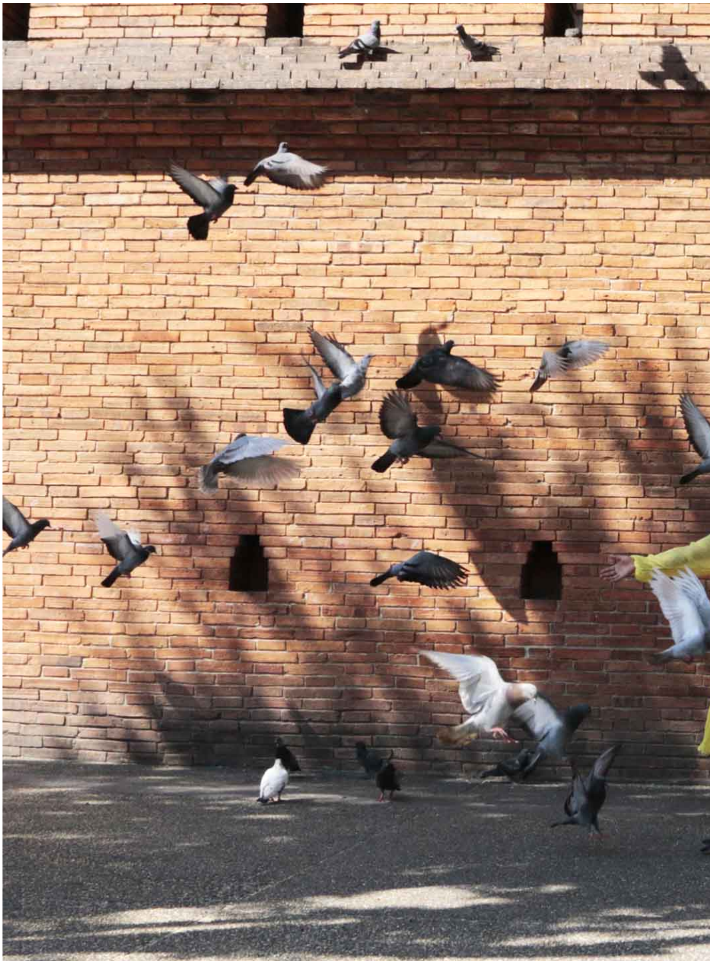
2023年1月23日，中国游客在泰国清迈拍照。

东尼：这个给我纽约的朋友非常大的震撼。我房子一租下来，好几个朋友就专门从纽约飞来住。也帮我把音乐工作室什么的搞起来。大家发现，不管是从纽约还是国内过来，都是“卷了好久了，然后终于可以躺平一下”。我发现自己很长一段时间，尤其在疫情期间，人是非常不舒展的。有很多要担心的东西，很多无法控制的事情。我忘了，我是一个制片人(Producer)，但是我从来没有去produce我的生活。钱和工作事业，只是一方面的东西。我应该把生活安排成什么样的？住的空间我喜不喜欢？今天能不能吃到我爱吃的东西？这些东西不但是可被打造出来的，我们也必须要去做这件事 (not only its producible, you have to do it)。