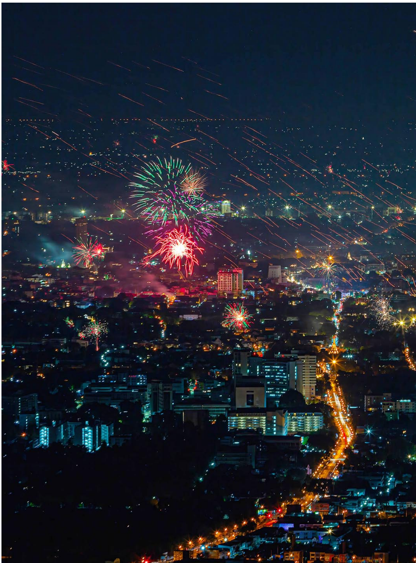
2022年12月31日，新年庆祝活动期间，清迈上空燃放烟花。

在这个剧烈动荡的时代里，作为个体的我们，究竟在经历着什么？“行星酒馆”的第一期，正是这个播客源起的故事。去年10月，我与好友Sig在疫情失散三年后重逢。我们各怀自己的包袱，最终在泰国的北部，分别找到新的生活座标。六个月后，我们即将再次离别，就有了这样一段对话——关于旅居，关于清迈，以及短短半年间，我们生活翻天覆地的变化。