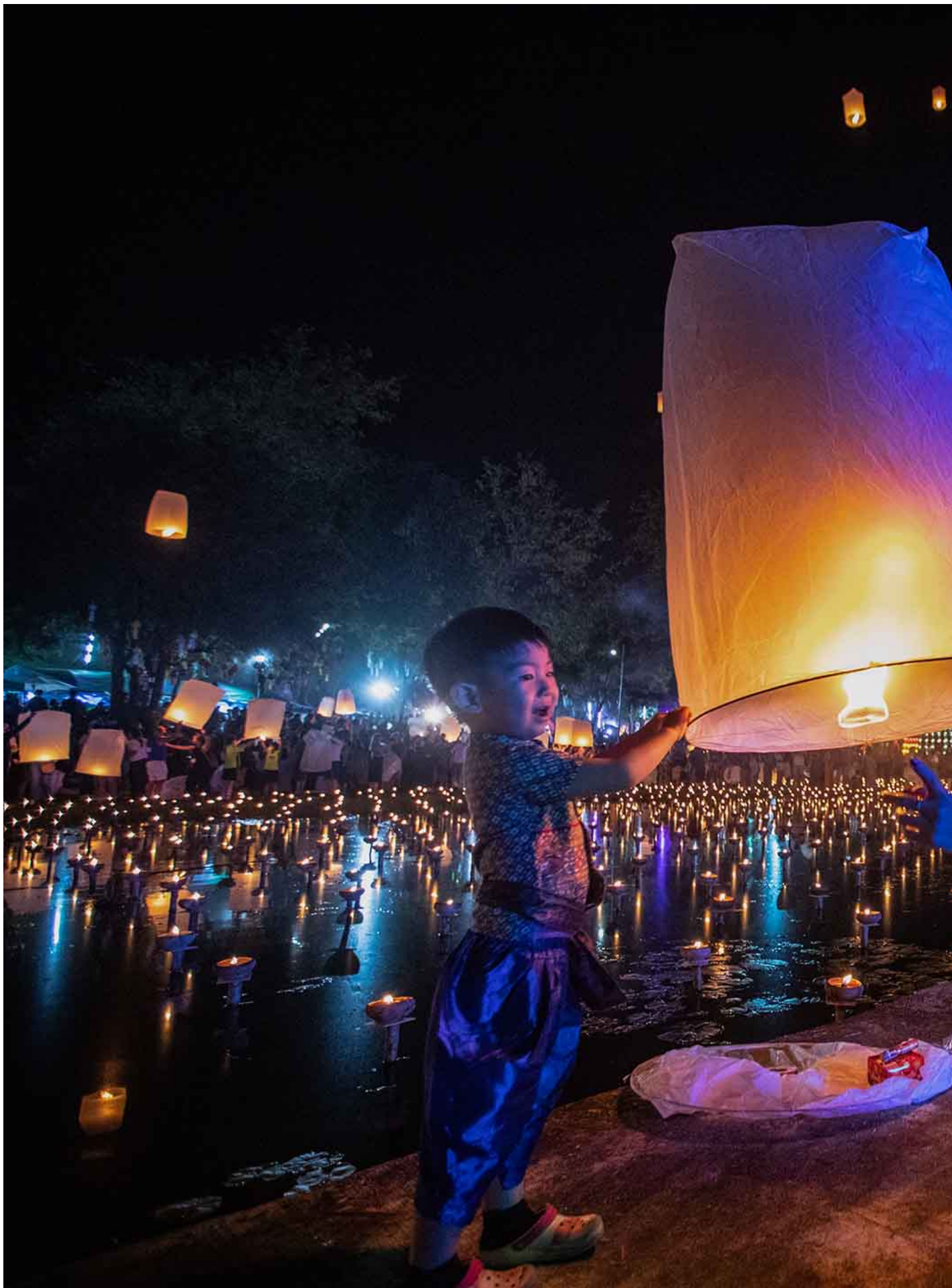
2022年11月8日，泰国清迈天灯节。

东尼：我们其实是一代人的缩影。整整一代人成长于全球化背景下，怀着“今天可以在这个国家，明天可以在那个国家”这样心态的一批朋友，不少受过海外教育或者在国外居住、工作，突然一下就被疫情冲散了。它不是大家的选择，而是有很多偶然在里面。我们突然就被时代裹挟着往前，不过最后我们又在曼谷见面了。