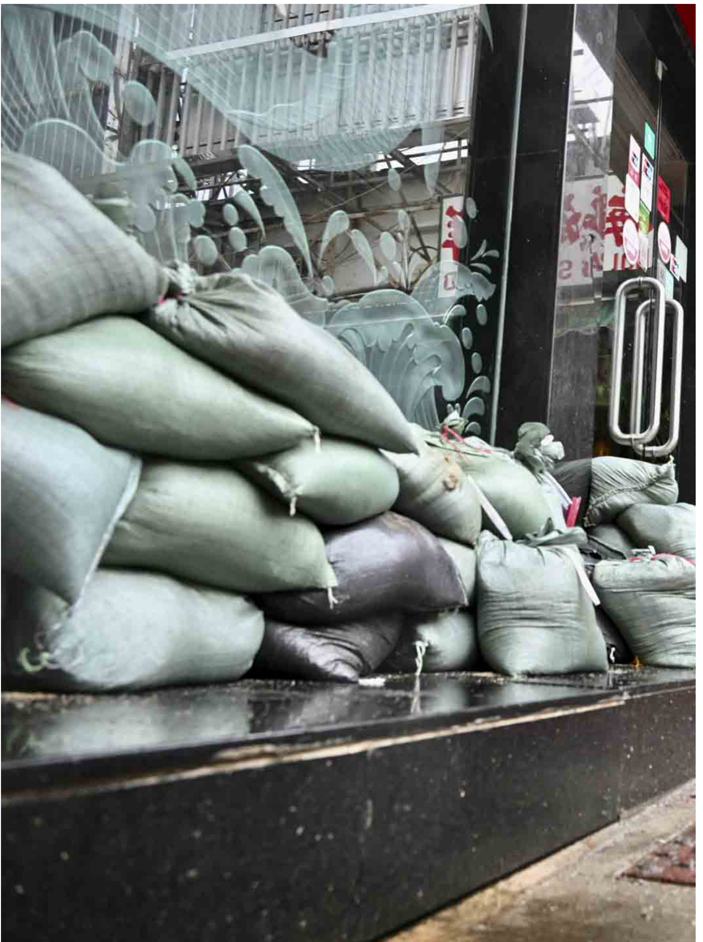
2023年9月1日，鲤鱼门的酒家用沙袋堆放在入口处，以防止海水倒流。