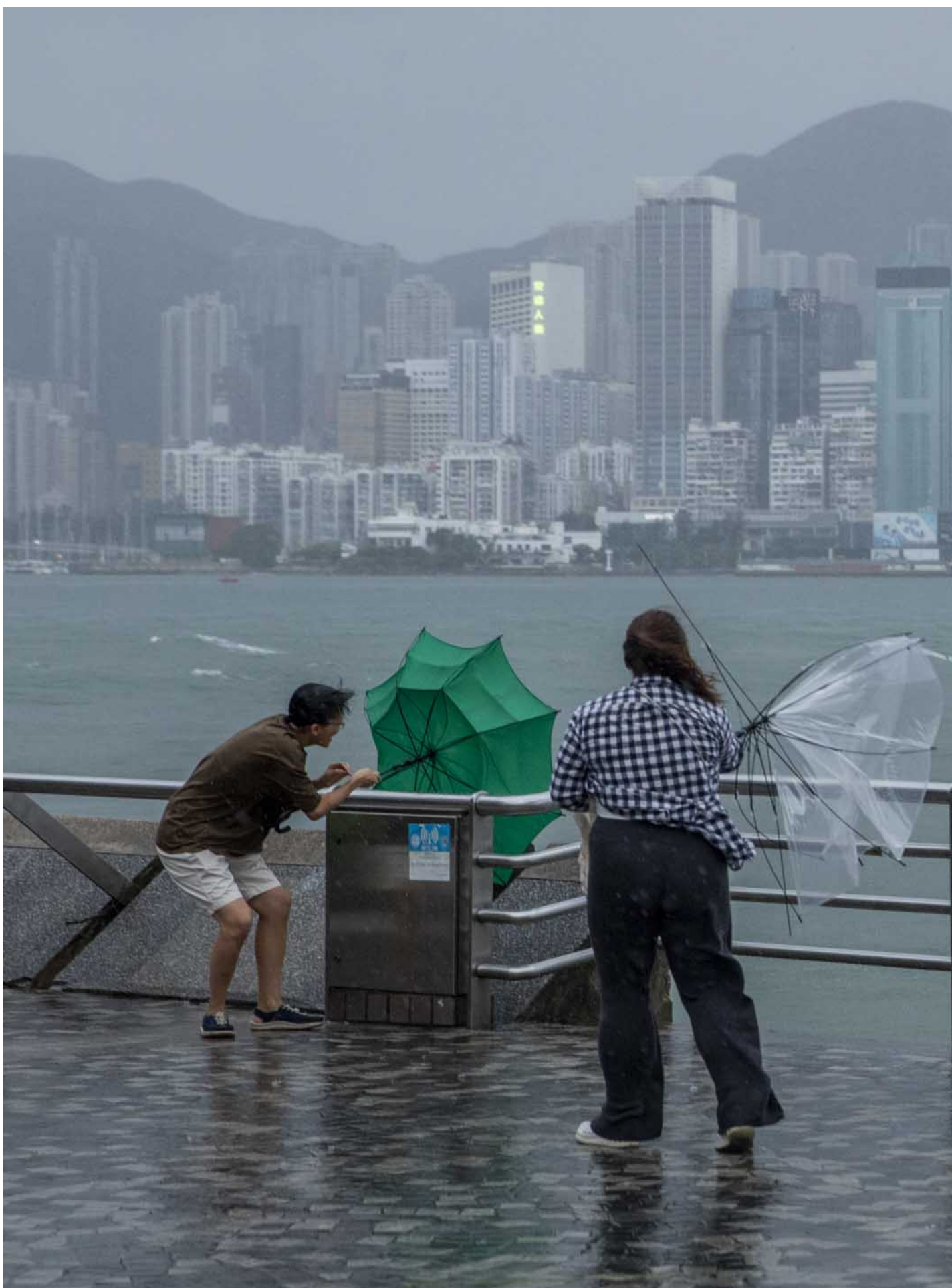
2023年9月1日，超强台风苏拉逐步靠近香港，8号风球下在尖沙咀海旁的市民。