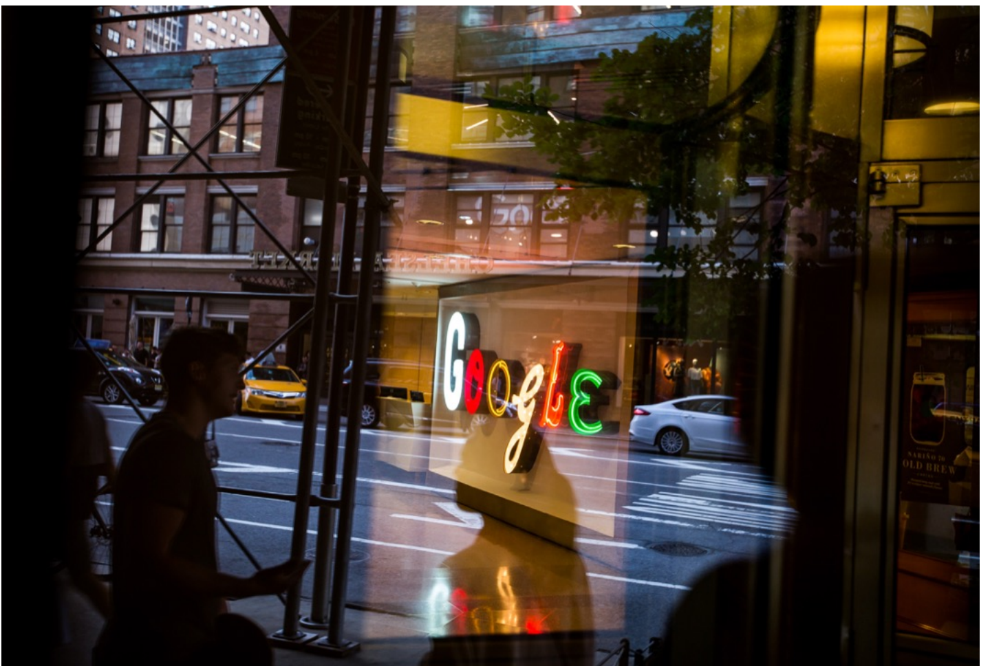
2016年8月22日，谷歌纽约办公室。

Google表示 自己将扩大广告透明度中心的披露范围，同时也将提供更多数据供研究人员访问。