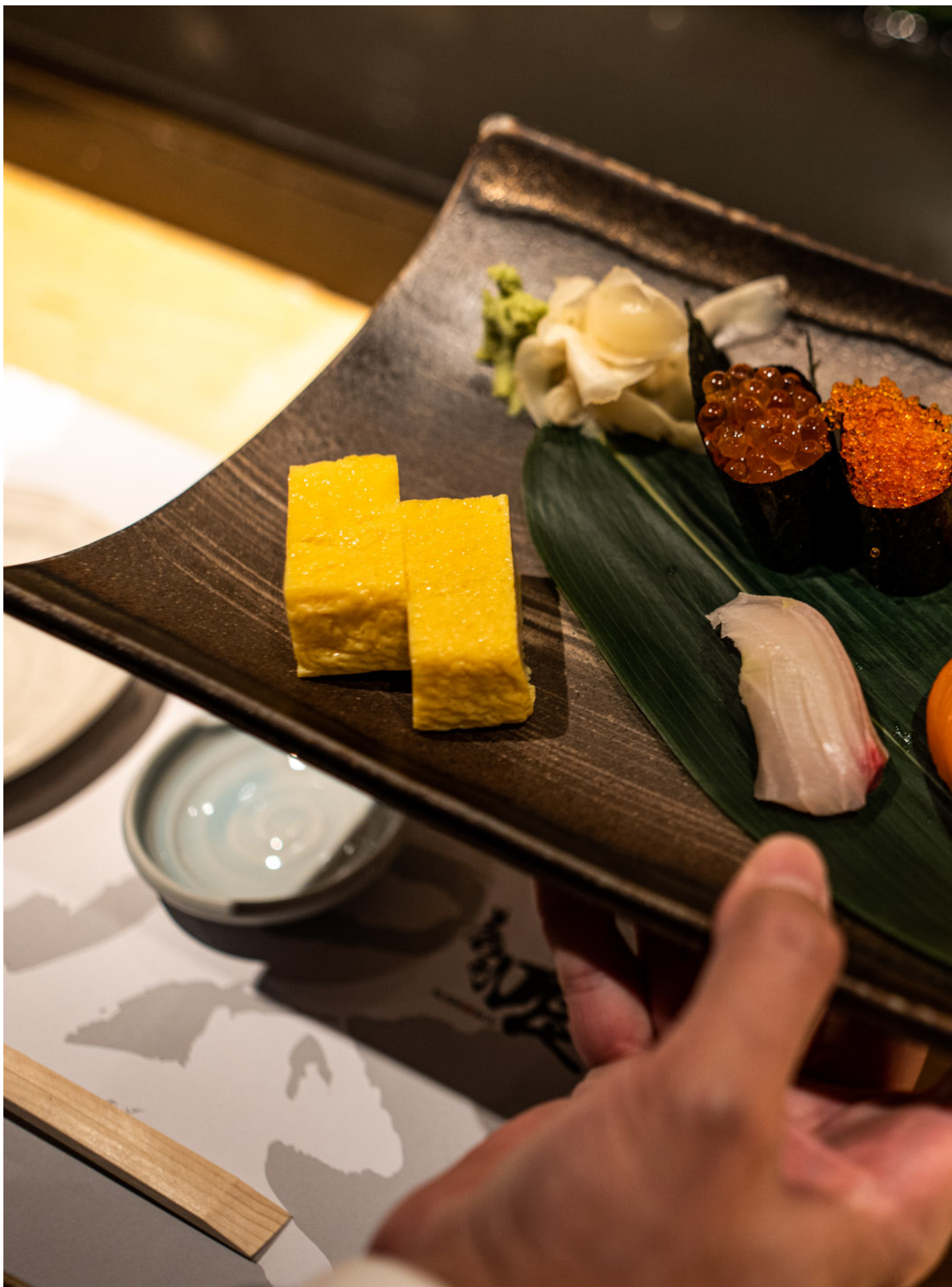
2023年8月29日，位于中环的寿司店“寿司喰”，店员正在为客人上菜。