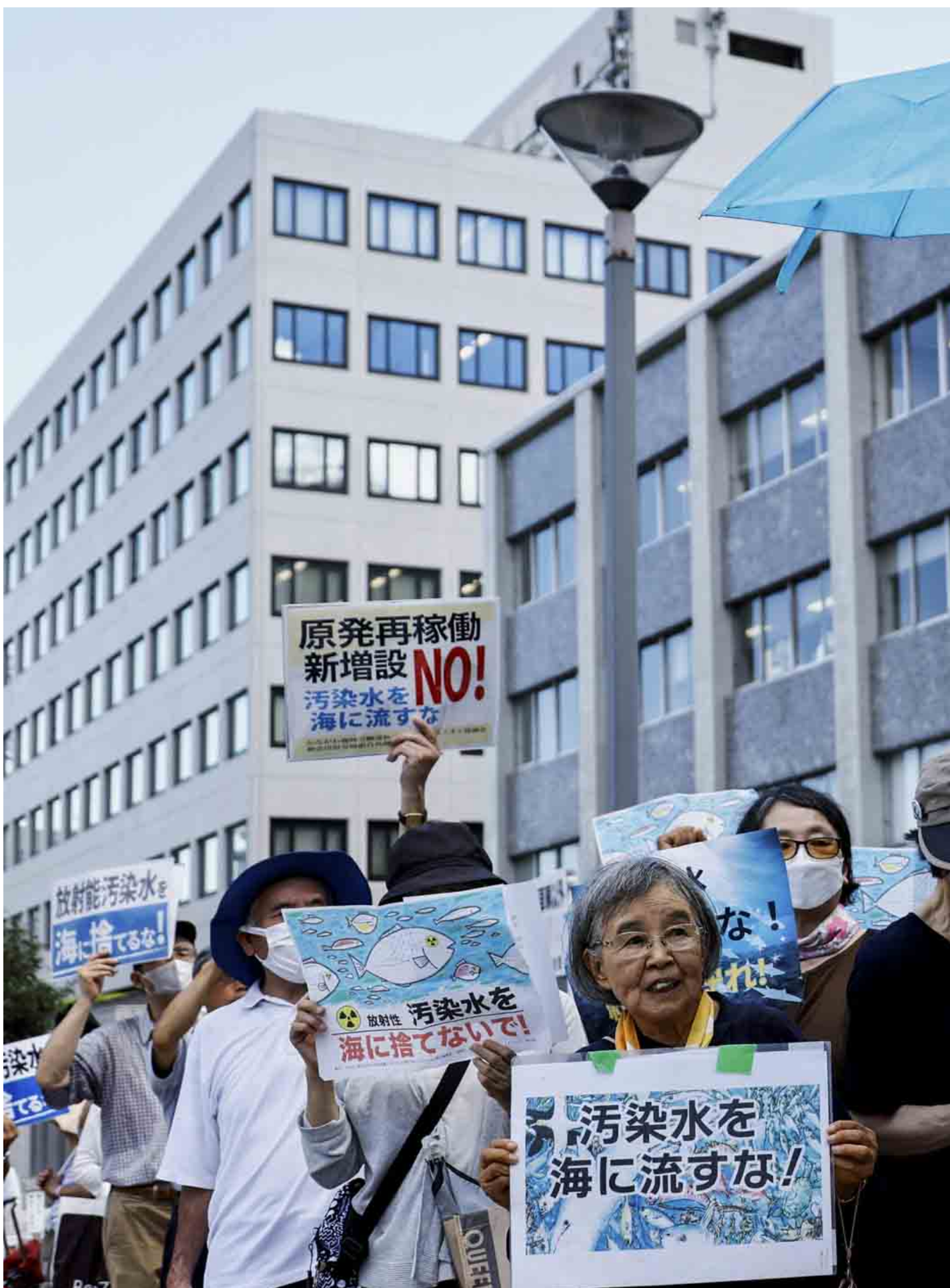
2023年8月25日，日本东京，示威者在日本首相岸田文雄官邸前举行集会，反对将福岛第一核电站处理过的放射性水排入海洋。

2021年，核废水储存量即将饱和，日本政府公布将核废水稀释并排出大海的方案。按计划，东电会以“多核素除去系统”（ALPS）处理核污水，过滤62种放射性物质并减少至合乎日本规定的水平，但不包括氚和碳14。之后，会以海水将ALPS处理水中的氚稀释至100倍以上，令浓度降至每公升低于1500贝可（Bq），是日本管制标准的四十分之一，合乎世卫饮用水含氚标准的七分之一以下。