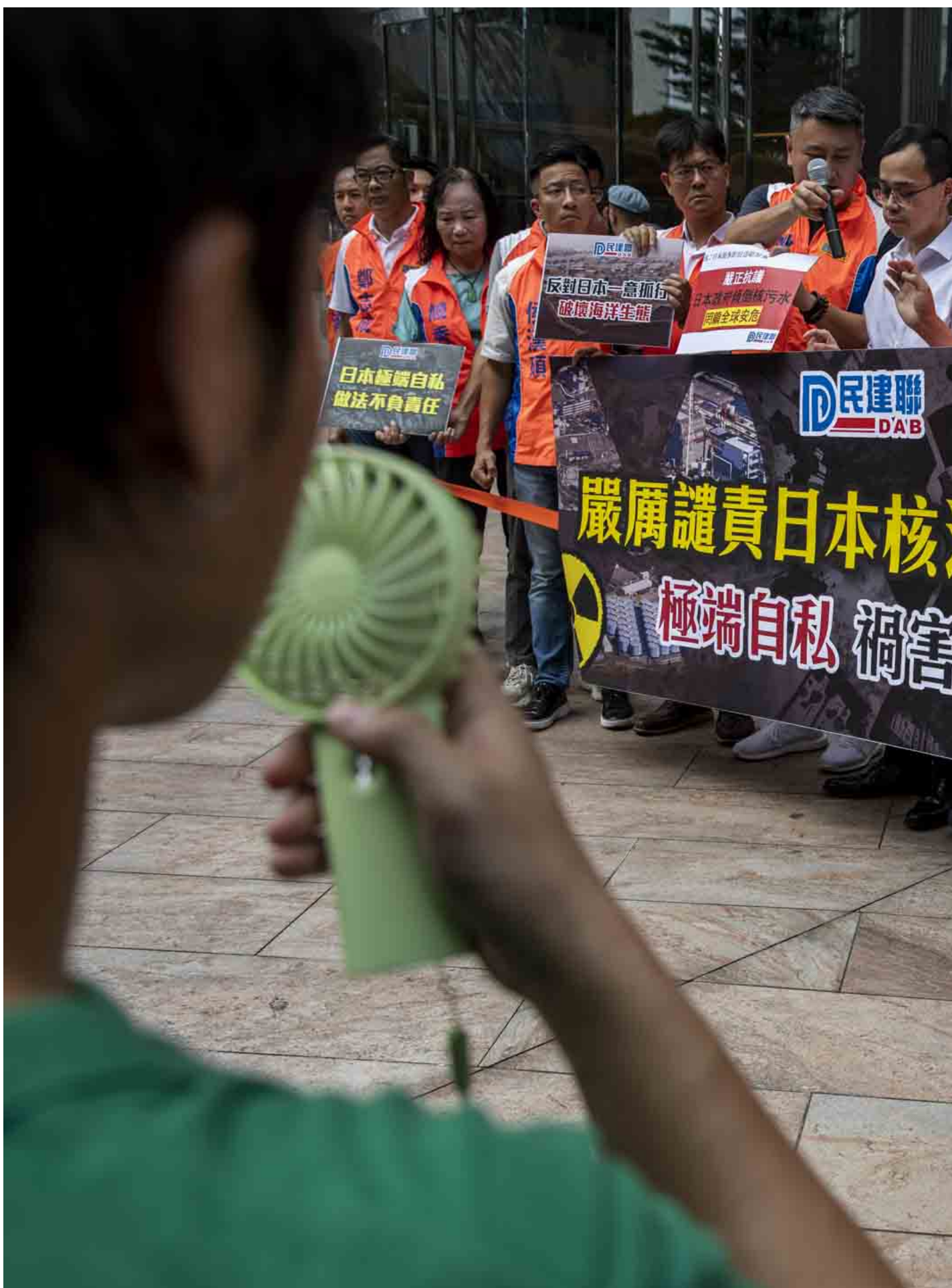
2023年8月23日，香港，民建联到日本总领事馆外请愿，谴责日本政府排放核废水。

中方质疑，日本净化装置能否长期有效使用、国际社会能否及时掌握超标排放的情况，以及放射性核素长期累积和富集，会给海洋生态环境、食品安全和公众健康带来的影响。