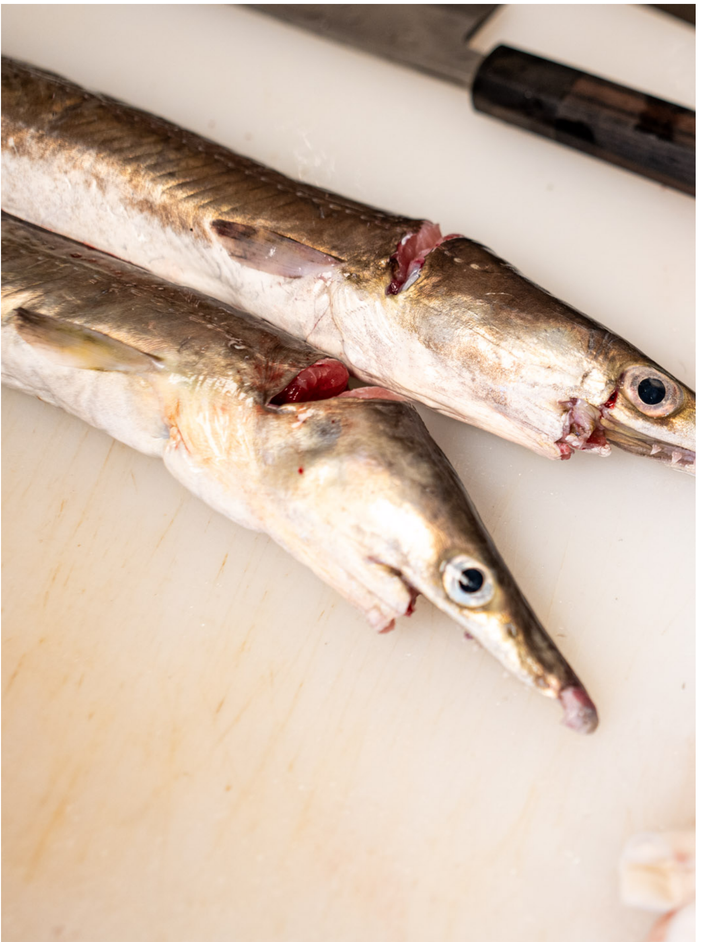
2023年8月29日，中环Omakase餐厅“KAMOSU 醱”的食材。

核废水排放后，他会继续食omakase。311大地震，核电厂受损至今十多年，他觉得要有的影响，其实一直已经在影响了，“食烟会致癌、食午餐肉也会致癌，但好多人也会继续去食。对自己负责就OK。”同时他对港府的抽验工作有信心，若验出食材的辐射量超标，“他们不会对香港市民置诸死地，不理他们”，日本政府也如是。