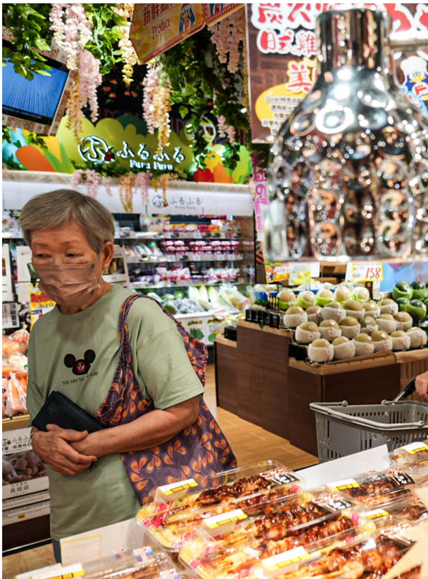
2023年8月24日，钻石山一间超市，市民正在选购日本食品。

同晚8时半，一街之隔的日本连锁超市唐吉诃德DON DON DONKI，雪柜内仍有不少寿司和鱼生饭，叠成两层排列，有三文鱼、吞拿鱼和带子寿司。标榜鱼生来自东京丰洲市场的宣传品仍挂起：“Our high quality fish will bring you smile”。另一旁的雪柜，包装上印有“豊洲市场発”的渍鱼“地区限定”半价发售，50元两包；三文鱼寿司“大特价”，由80港元10件降至58元。