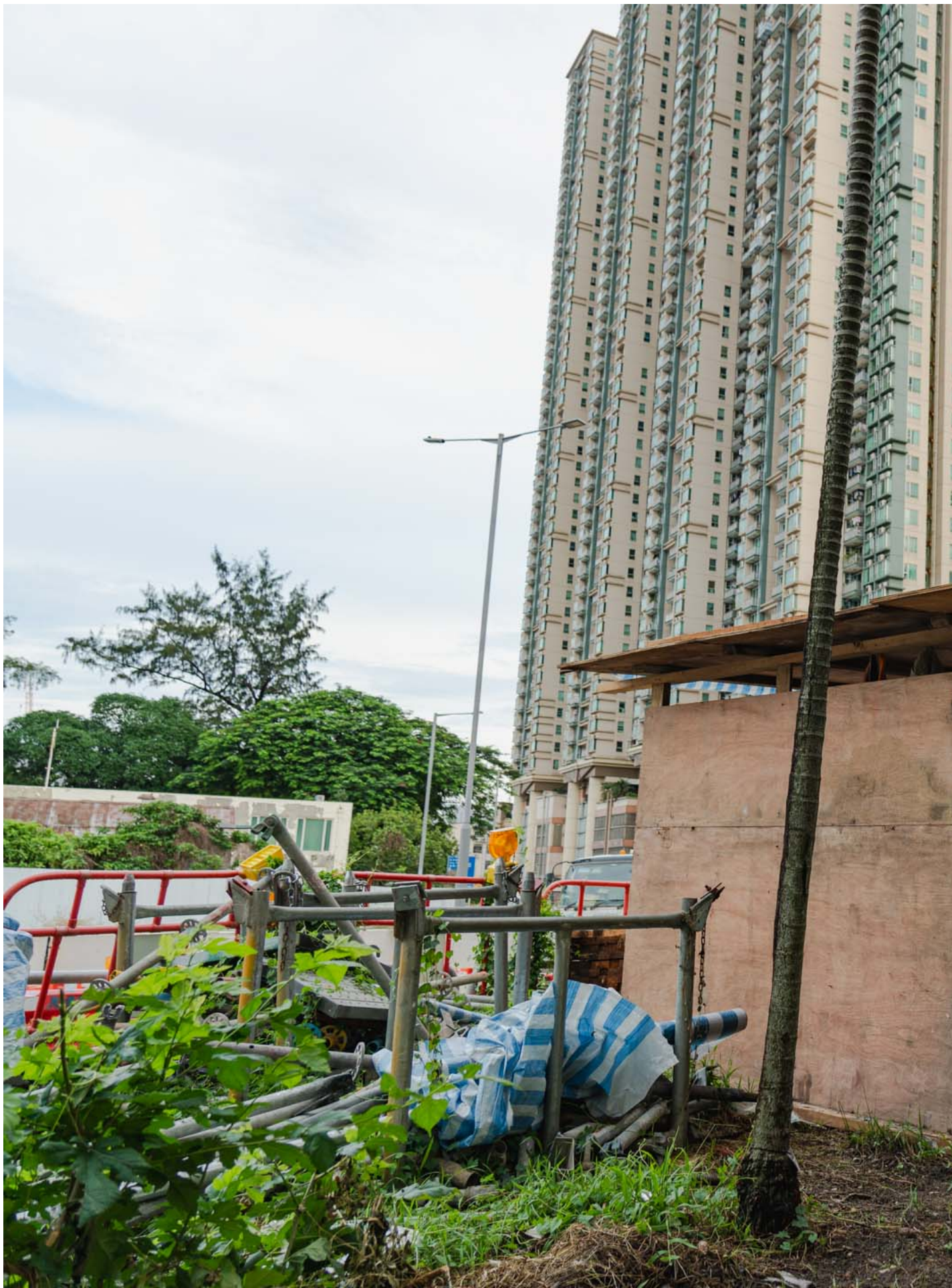
一间小木屋座落在新楼宇旁。

兜兜转转，伯伯还是要埋在沙岭。食环署让街坊们在殓房办告别式，而明泰也答应无偿为伯伯准备礼仪用品，并请法师主持法事。“始终我们都尝试过、尽了力。”马芊芊说。