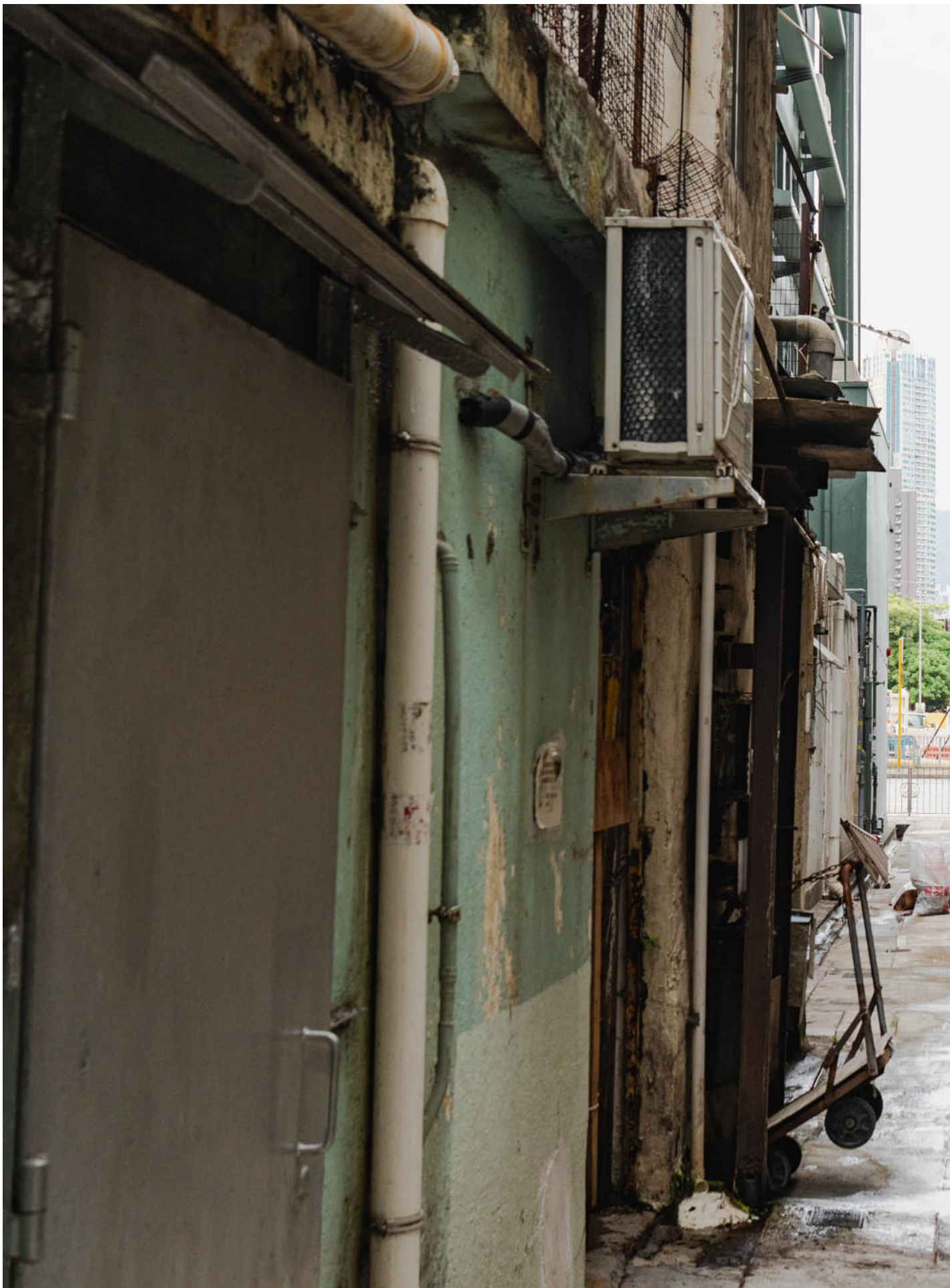
“面粉伯伯”被发现倒卧的位置。

伯伯倒下那条后巷，离Victor家只有5分钟路程，他在6月才从新闻上得知伯伯去世，“整个土瓜湾街坊也是后知后觉。”伯伯死讯传开后，明泰和义工们去了后巷。那地湿漉漉、混杂排泄物，冷气机槽的水滴答滴答，晚上没有光。差不多3个月来，天气潮湿和频密下雨，使东西都长霉，惹来昆虫。