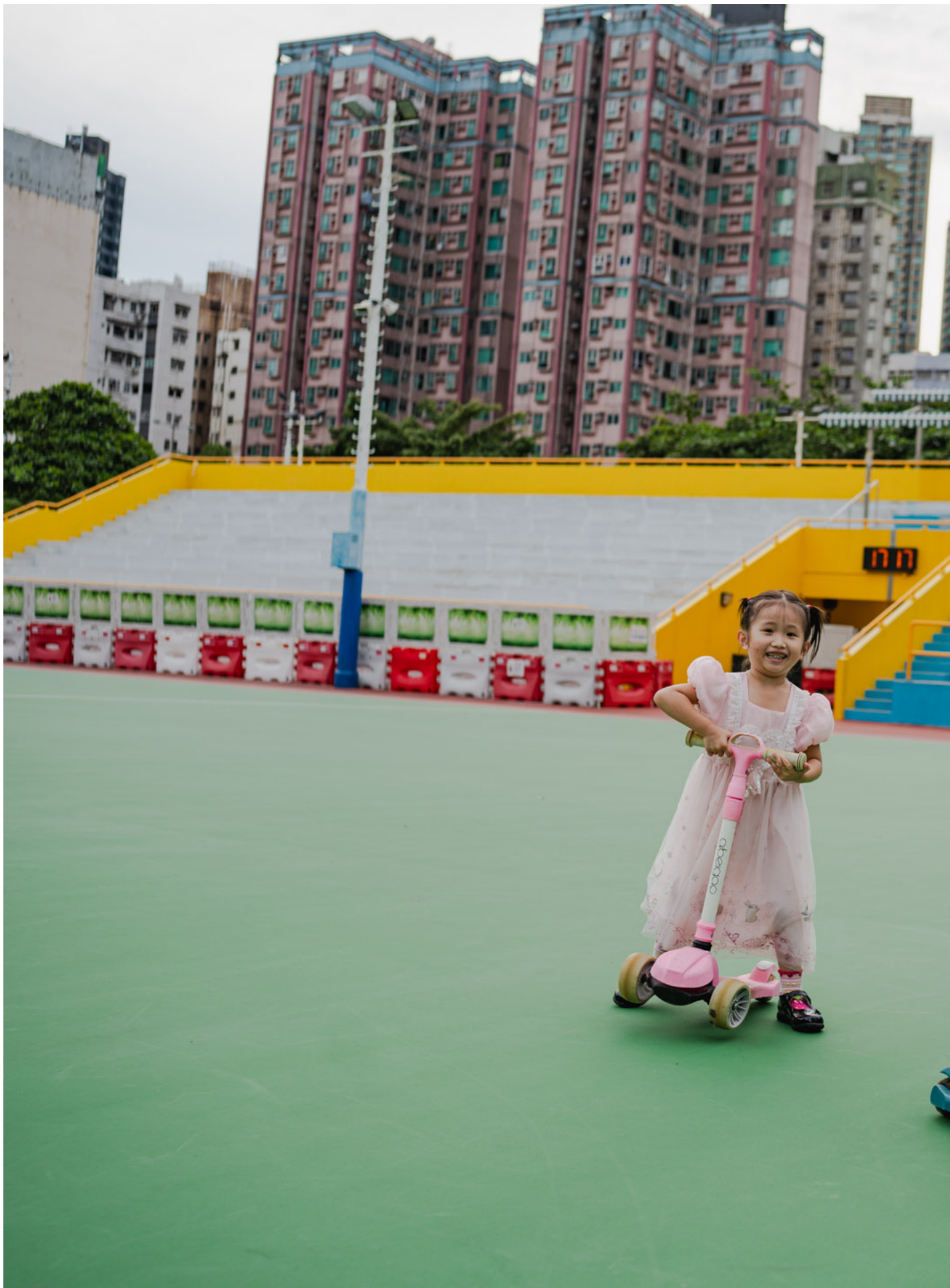
一对兄妹在土瓜湾游乐场玩耍，“面粉伯伯”多年来一直在这里露宿。

他说，伯伯看起来精神但不说话，问他的名字、贵姓都不回答。收到物资时，伯伯会露出牙齿笑道“摆低啦，多谢”；若不要物资，会说“唔要”。很多时候他们来到，伯伯已经睡着，他们不打扰，放下物资便离开。