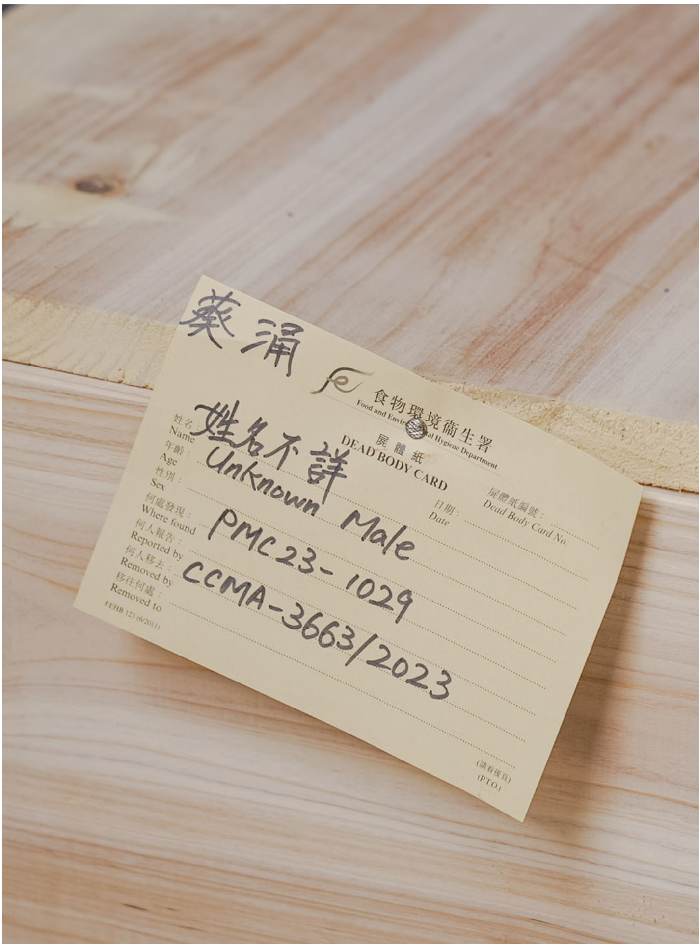
土瓜湾街坊，连同社区组织协会，在葵涌公众殓房举行“面粉伯伯”的葬礼，棺木上写著姓名不详。

“希望伯伯你没有痛苦，跟随佛祖身边修行，去到每一生每一世都有爱、没病没痛。”马芊芊双手合十、闭着眼碎念。