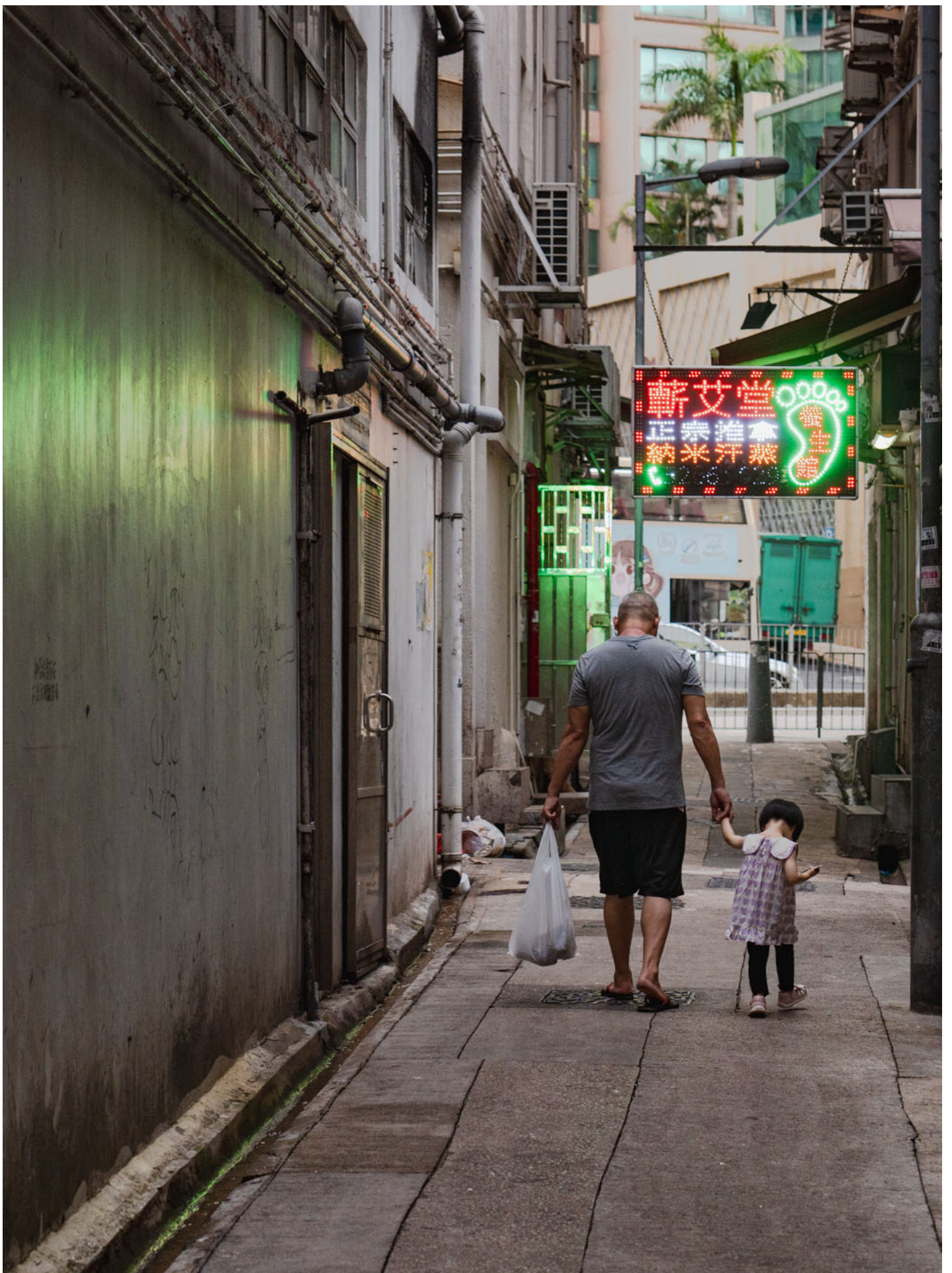
一对父女经过土瓜湾的后巷。