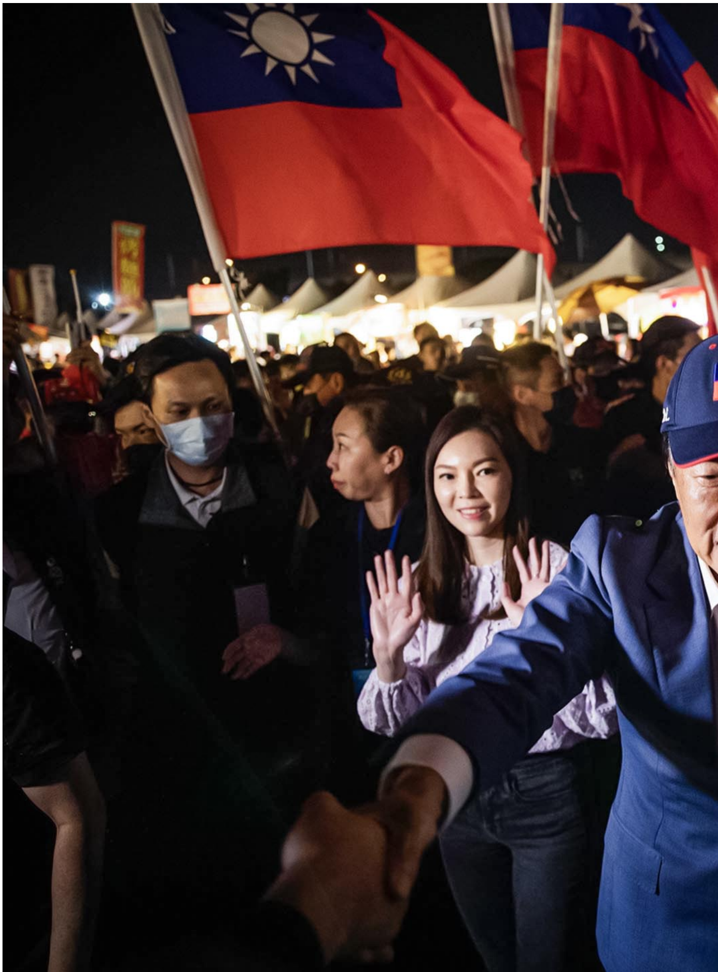
2023年5月12日，台中，郭台铭在造势活动中进场。