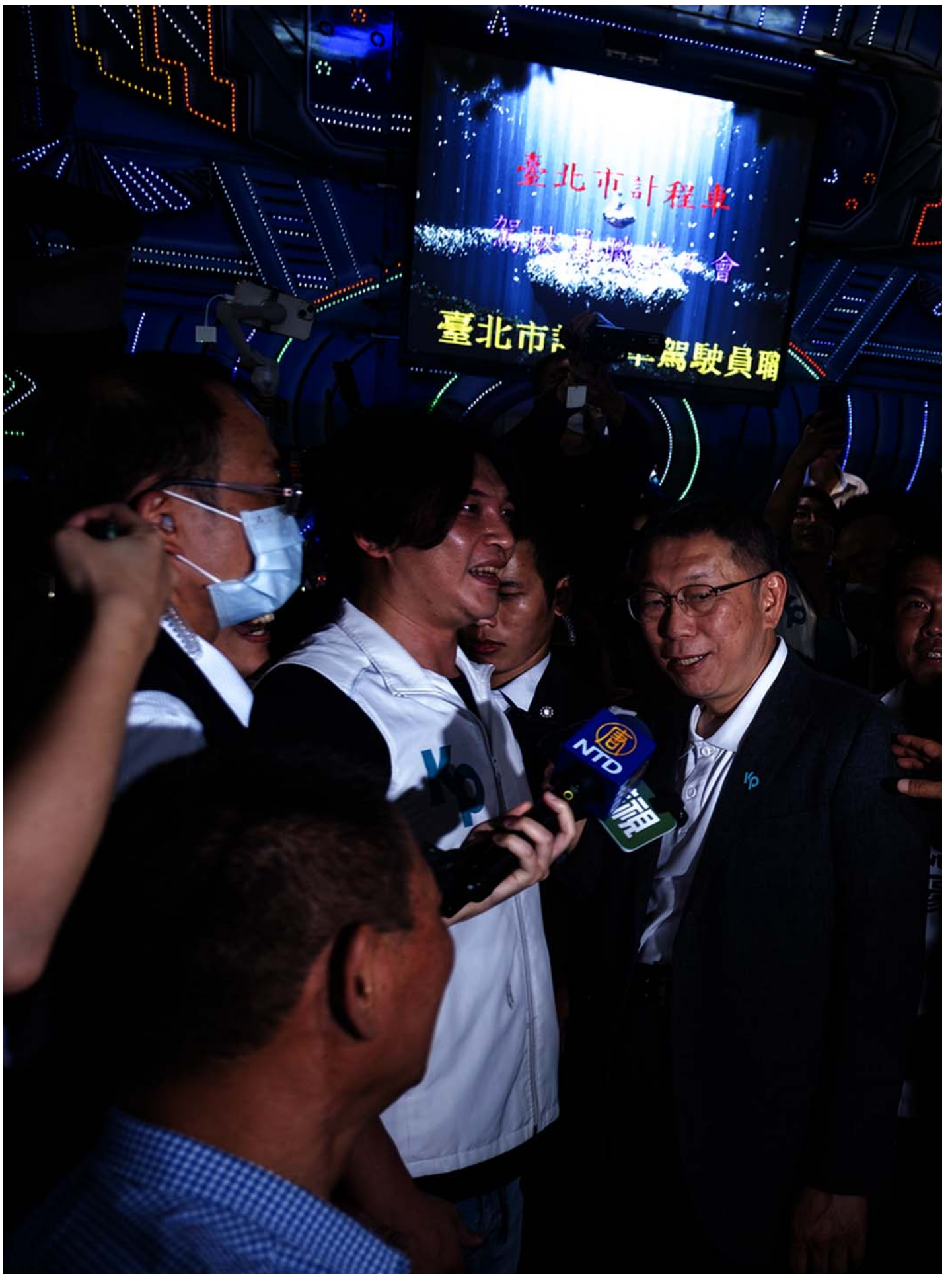
2023年8月29日，台北，柯文哲与郭台铭同场参加台北市计程车工会普渡餐会。