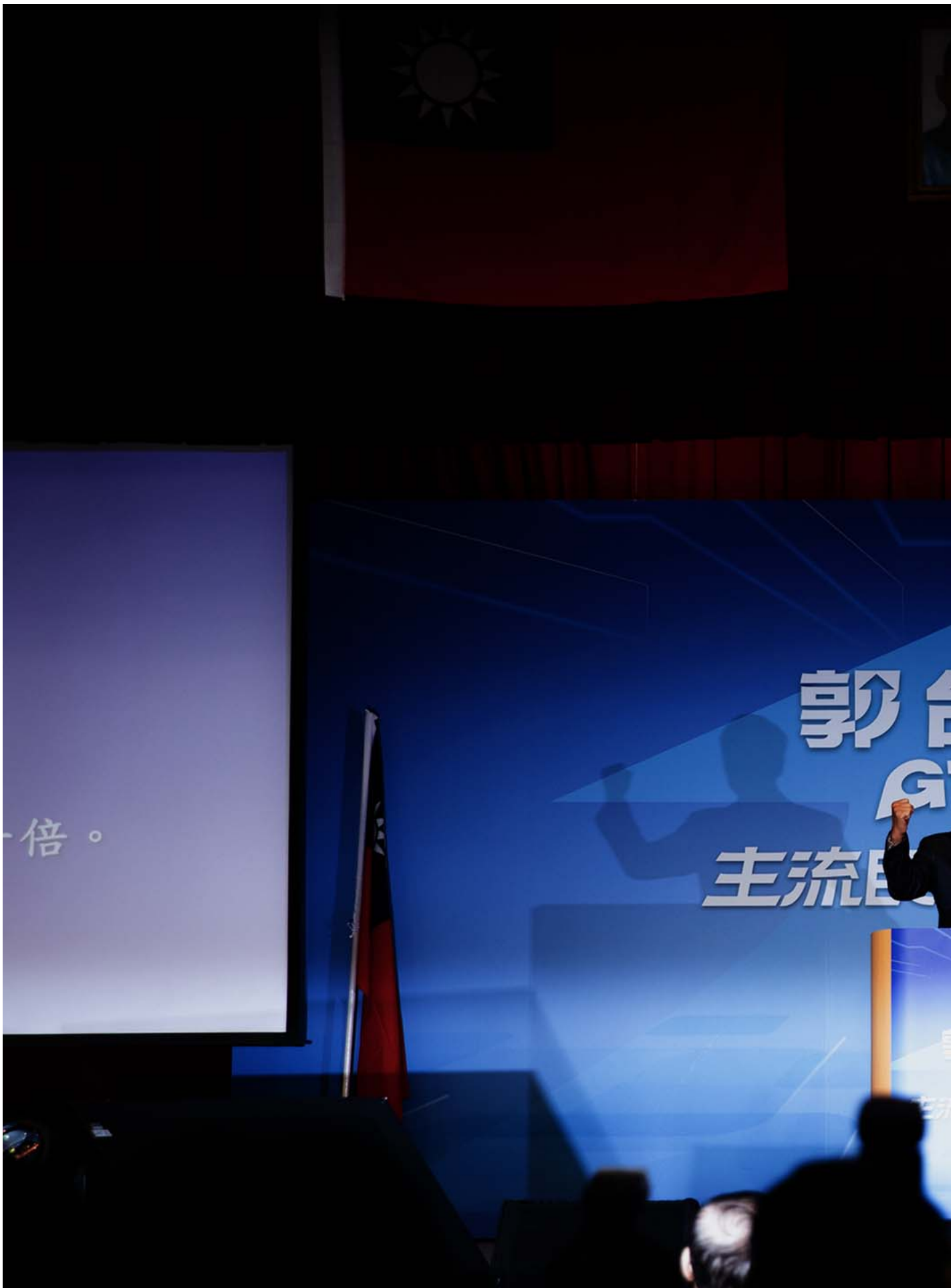
2023年8月28日，台北，郭台铭举行记者会宣布参选2024台湾总统大选。

与柯郭侯相较之下，民主和和平是共同点，但赖清德诉诸国际，继续与国际连结；而柯郭侯则是分别强调与中国交流、一中、九二共识，面向的是北京而不是国际社会。简单的说，民主与和平是目的，而赖清德的主张是延续蔡英文路线，透过与西方民主国家的友好和信任关系来维持民主和和平。而柯郭侯虽然也是诉求民主和和平，但方式却是转向中国，设法取得和中国之间达成共识。