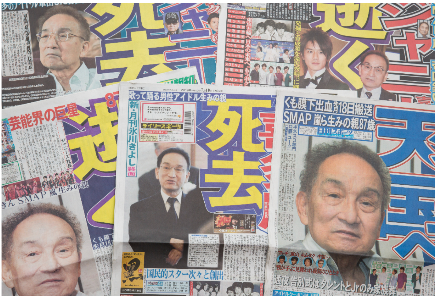
2019年7月10日，日本东京，各家报纸头版报导约翰·喜多川去世。