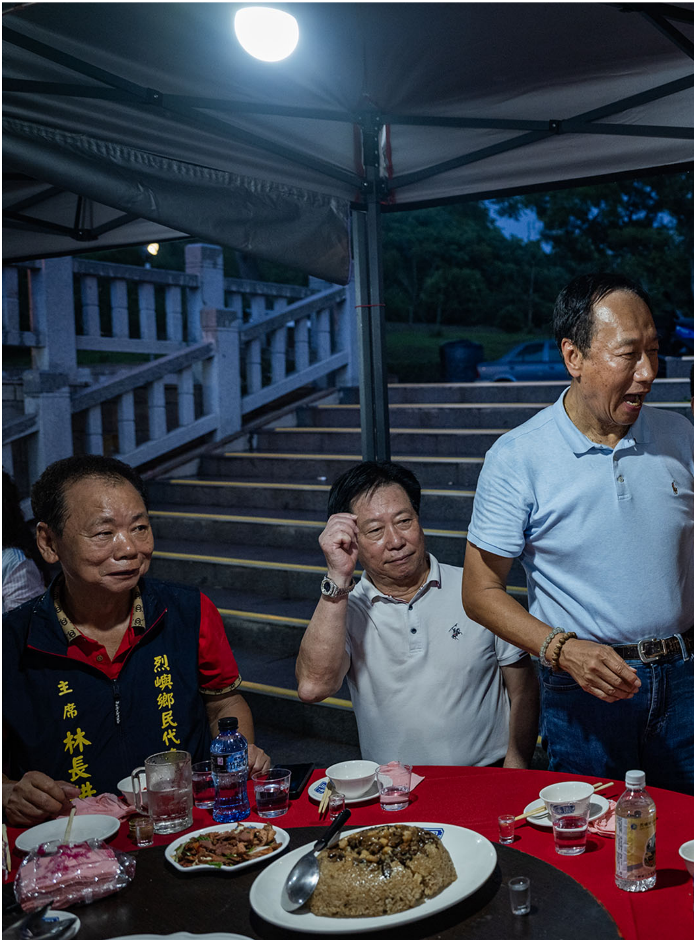
2023年8月23日，郭台铭于台湾烈屿乡参访造势。

倡议内容包含筹备成立“金门和平倡议基金会”，初步以2000万美元作为起始基金，推动“两岸和平协商办公室”、“两岸和平战略研究院”、建立新媒体平台、推动大专院校设立和平奖座与奖学金，以推动两岸和平发展交流。