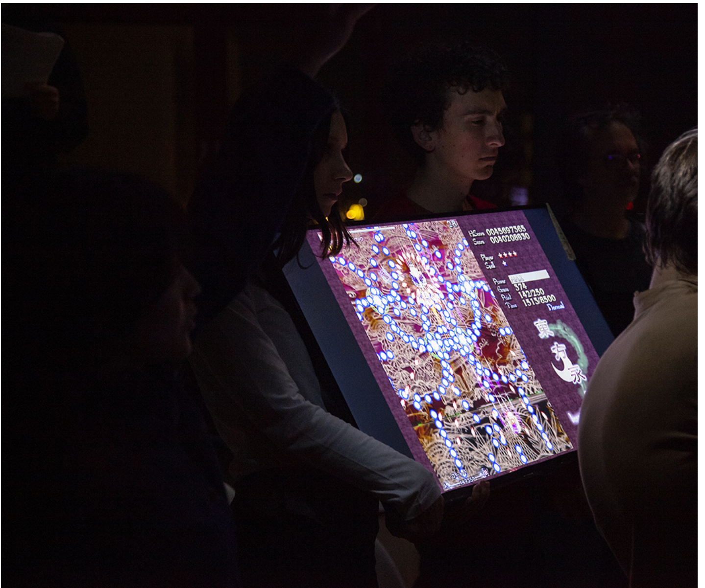
作者在法兰克福的游戏表演现场。