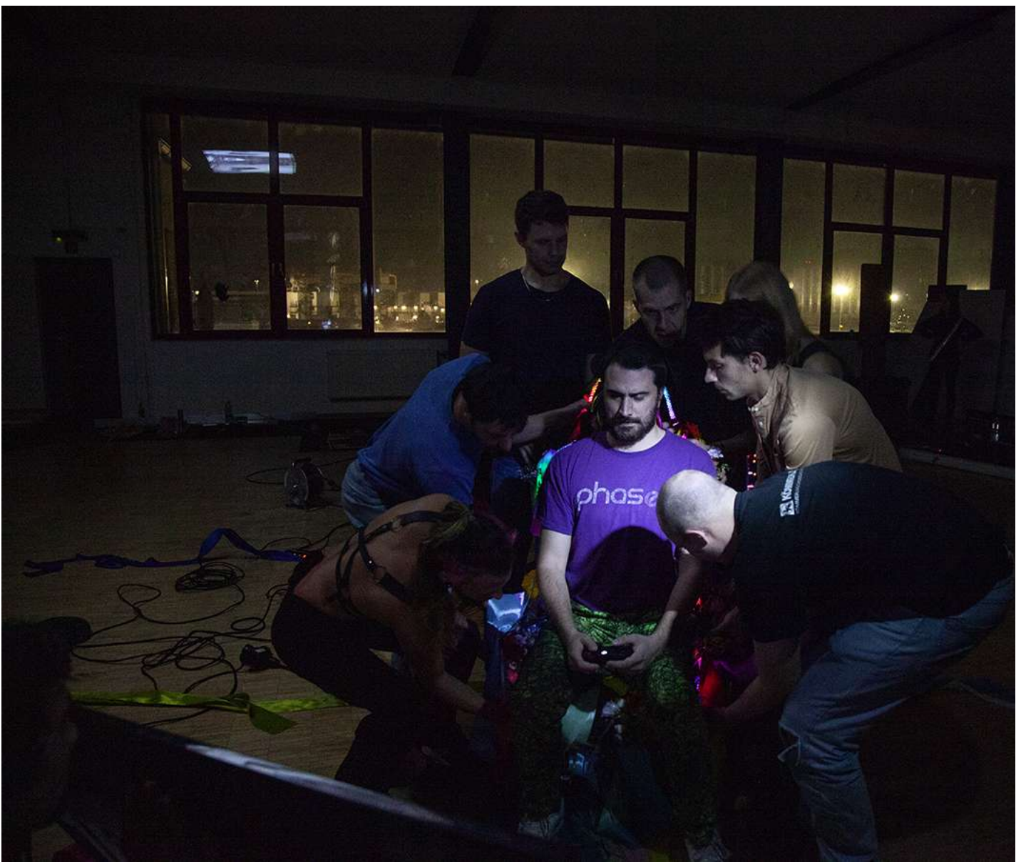
作者在法兰克福的游戏表演现场。