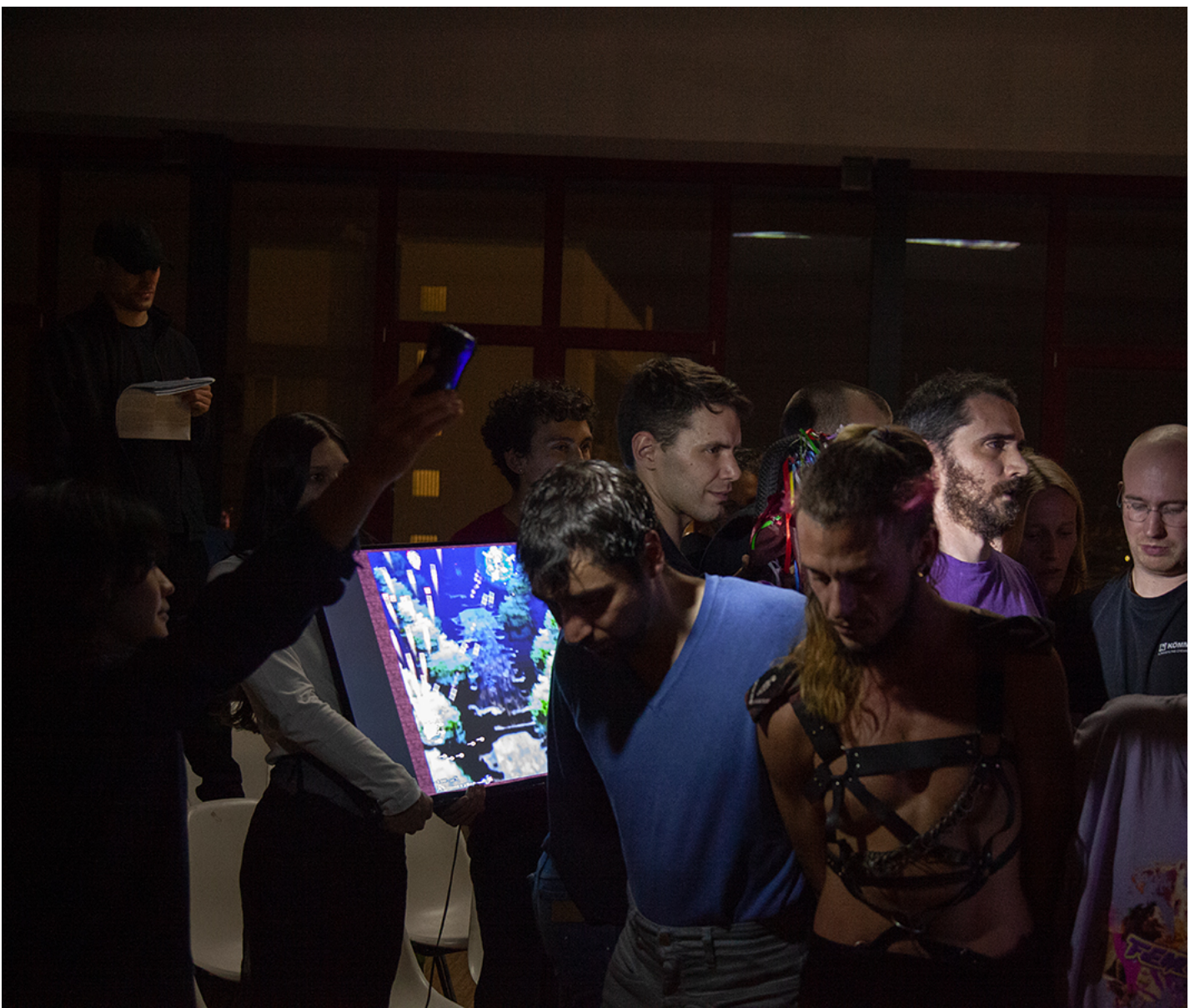
作者在法兰克福的游戏表演现场。