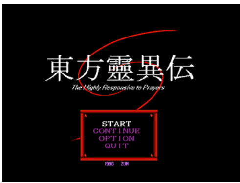
《东方灵异传~Highly Responsive to Prayers》

故事的主要角色博丽灵梦 (Reimu Hakurei) 是年轻的神社守护者，她使用净化法杖“御币”和“阴阳玉”战斗，与其他妖怪 (yokai) 魔法对决。妖怪总是以萌系美少女形象出现，这一系列设计产生了一种连续“弹幕” (danmaku) 的视觉奇观，使游戏因超高难度和令人印象深刻的视觉效果而闻名，这种视觉效果让人想起美国动画艺术家约翰·惠特尼 (John Whitney) 的排列艺术。