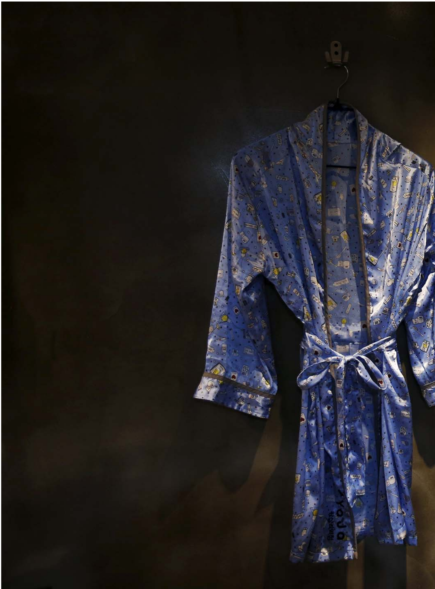
2015年7月21日，首尔，一间时钟酒店房间的墙上挂着浴袍。

A 听到后便在旁边嘤嘤假哭。我马上笑着抱着他：“不要伤心，他比你有钱而已！”我仍然不改口，“而且你床上技术比他好！”