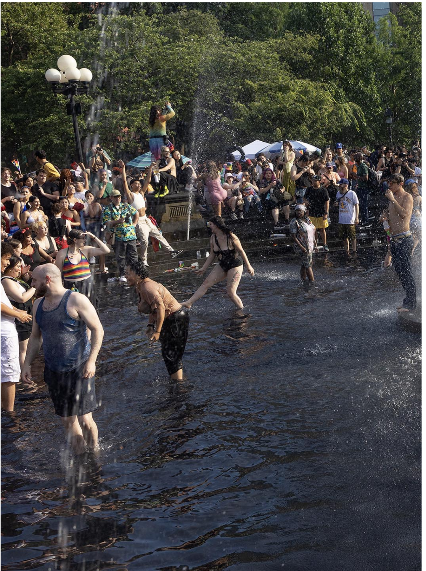
2023年6月25日，纽约市一年一度的同志游行。