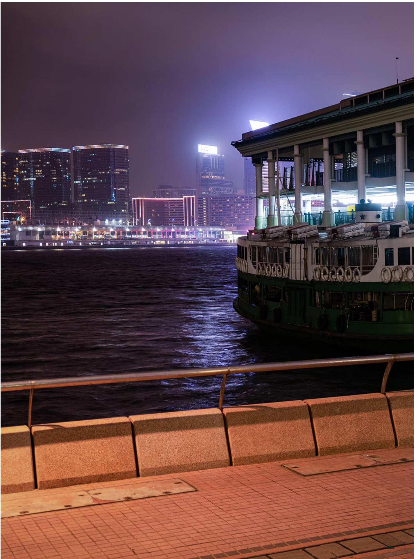
2022年3月6日，香港中环码头。

晚上回去之后，我有些陷入了这样的“恋爱”情愫——又或者因为要告别一个知己？我至今说不清。我在炮灯后抱着他，但他只是平躺着，轻轻摸着我的头发。我把头向他靠近，亲亲吻上他的唇，他热烈地回应，我一下子感受到发力感，然后他的手抱着我的腰和臀，甚至捏了几下屁股。我以为这是他希望做爱的暗示，于是我再次做那个打破暧昧气氛的人：“我们做爱吗？”