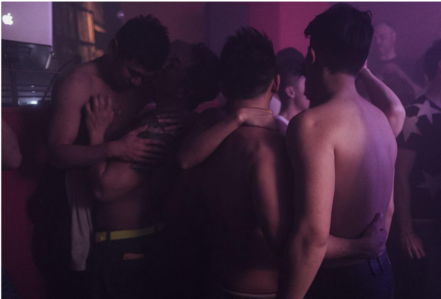
2016年1月30日，香港老牌 Gay Bar 的最后一夜。