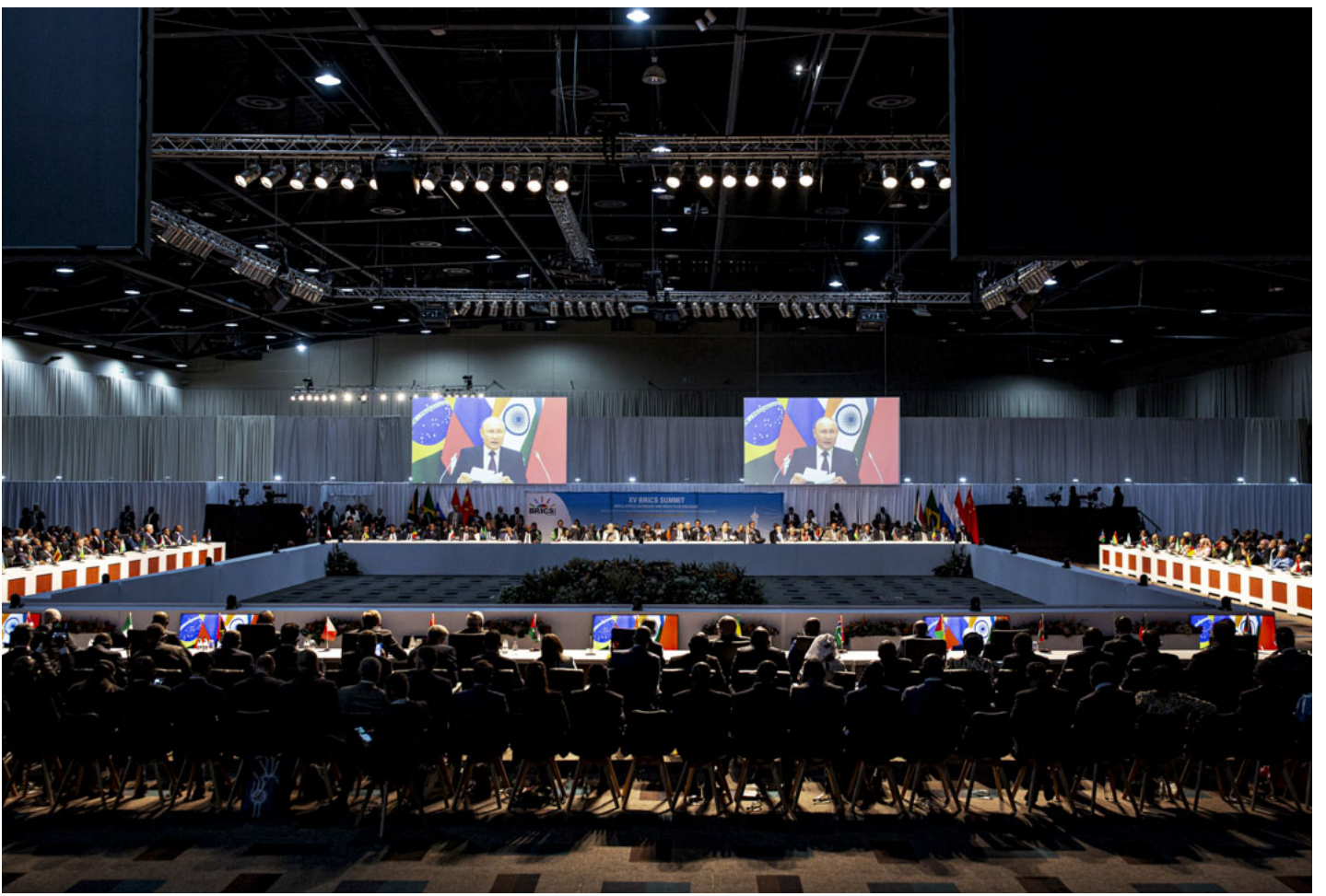
2023年8月24日，南非桑顿会议中心举行 2023 年金砖国家峰会，代表们观看俄罗斯总统普京在会议上发表讲话。

在会议召开前的几个月，俄罗斯总统普京是否会参会一度是媒体焦点。2023年3月，因涉嫌将乌克兰儿童非法转移至俄罗斯，国际刑事法院就相关战争罪对俄罗斯总统普京签发了逮捕令。南非作为罗马规约缔约国，有义务执行此命令。这意味着普京如果来到南非，按规约义务应该被逮捕。这一问题最终以普京派外长出出席会议，自己仅以视频形式远程出席会议而解决。