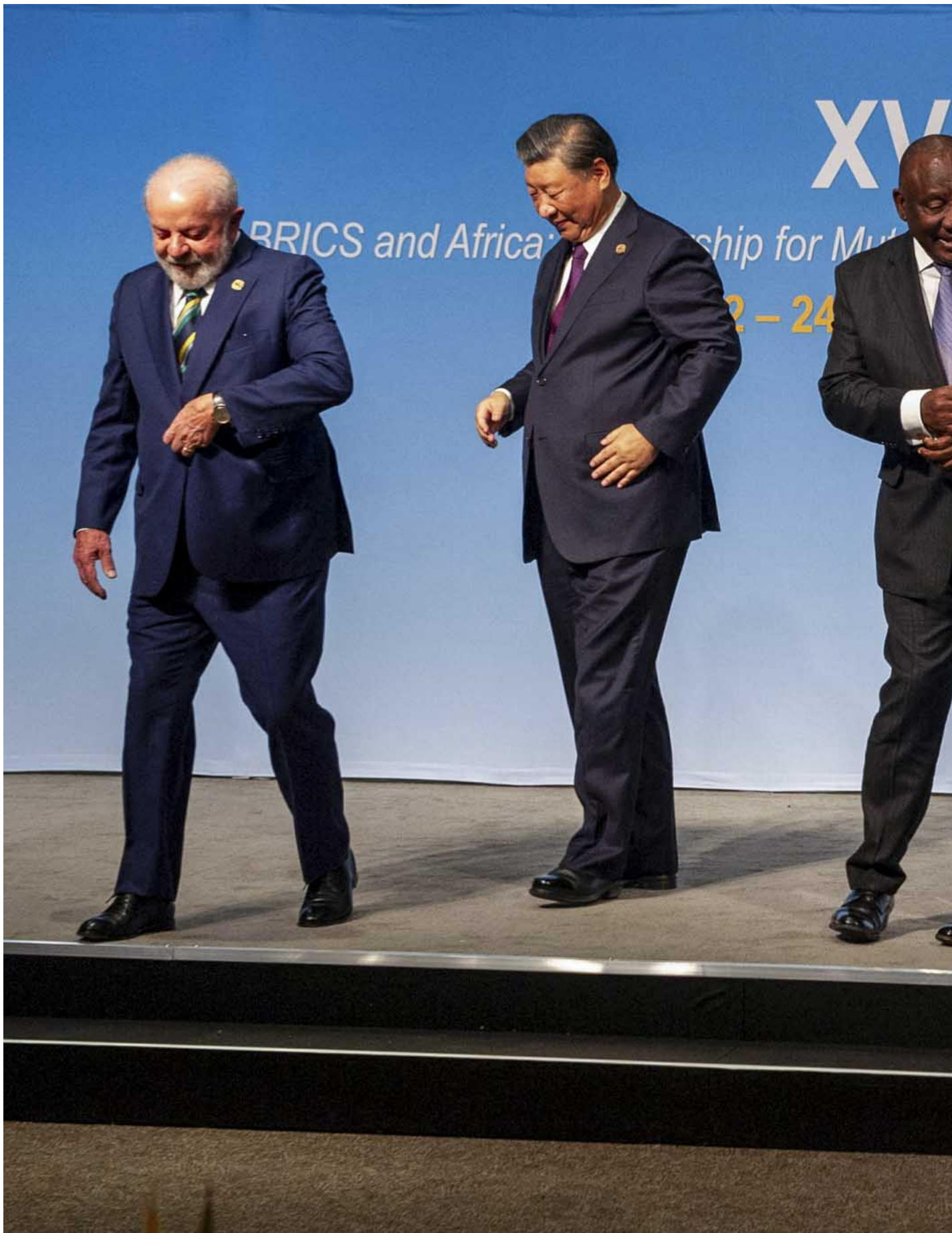
2023年8月23日，巴西总统卢拉、中国国家主席习近平、南非总统拉马福萨、印度总理莫迪和俄罗斯外交部长拉夫罗夫在南非金砖国家峰会上合影留念。