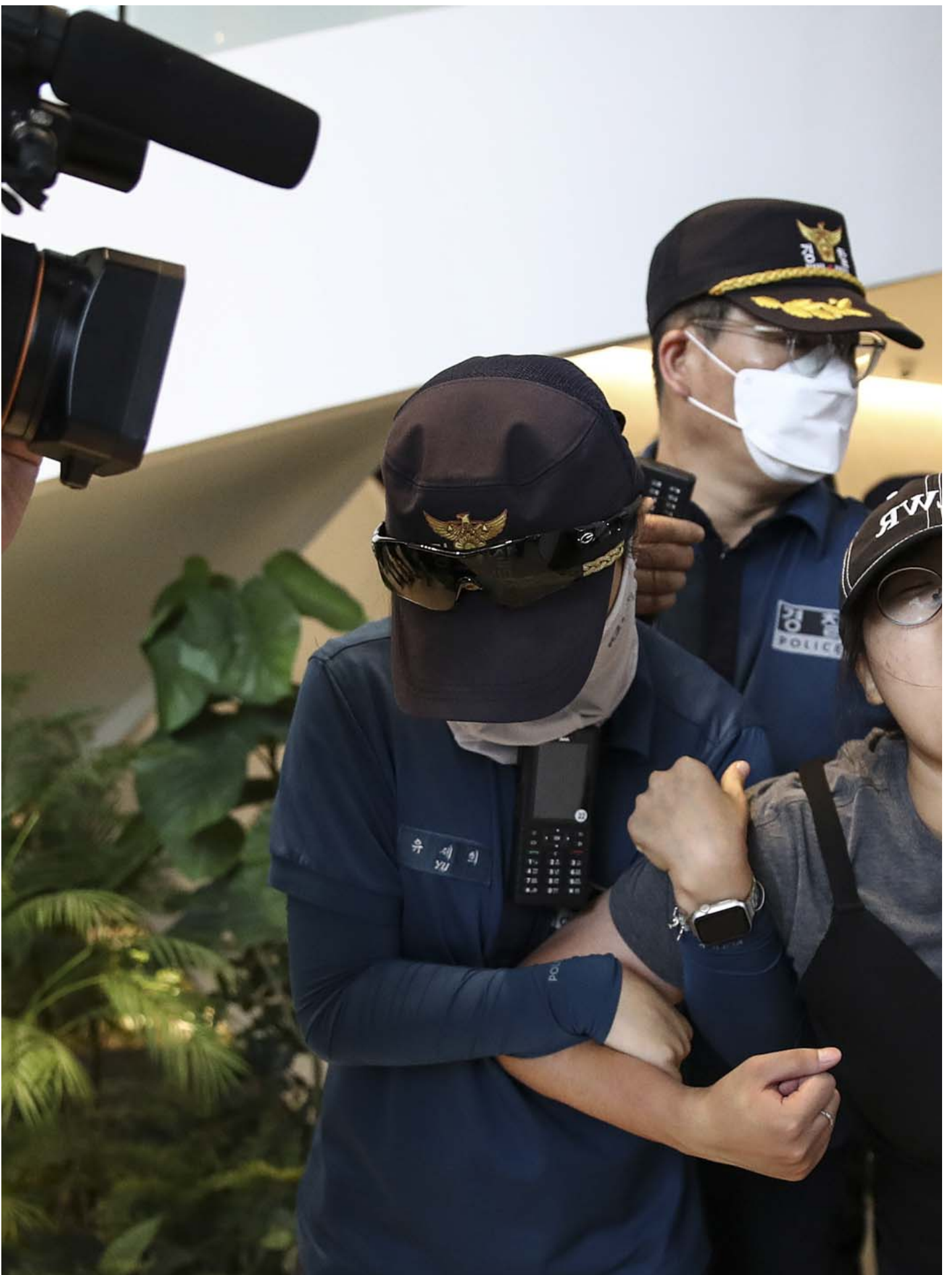
2023年8月24日，韩国首尔，一名试图闯入日本大使馆示威的大学生被警察拘捕。