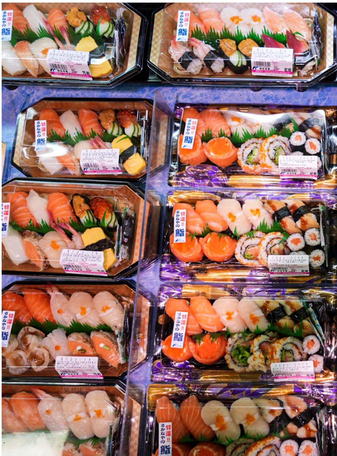
2023年8月24日，香港，九龙湾一间超市内的寿司柜位。