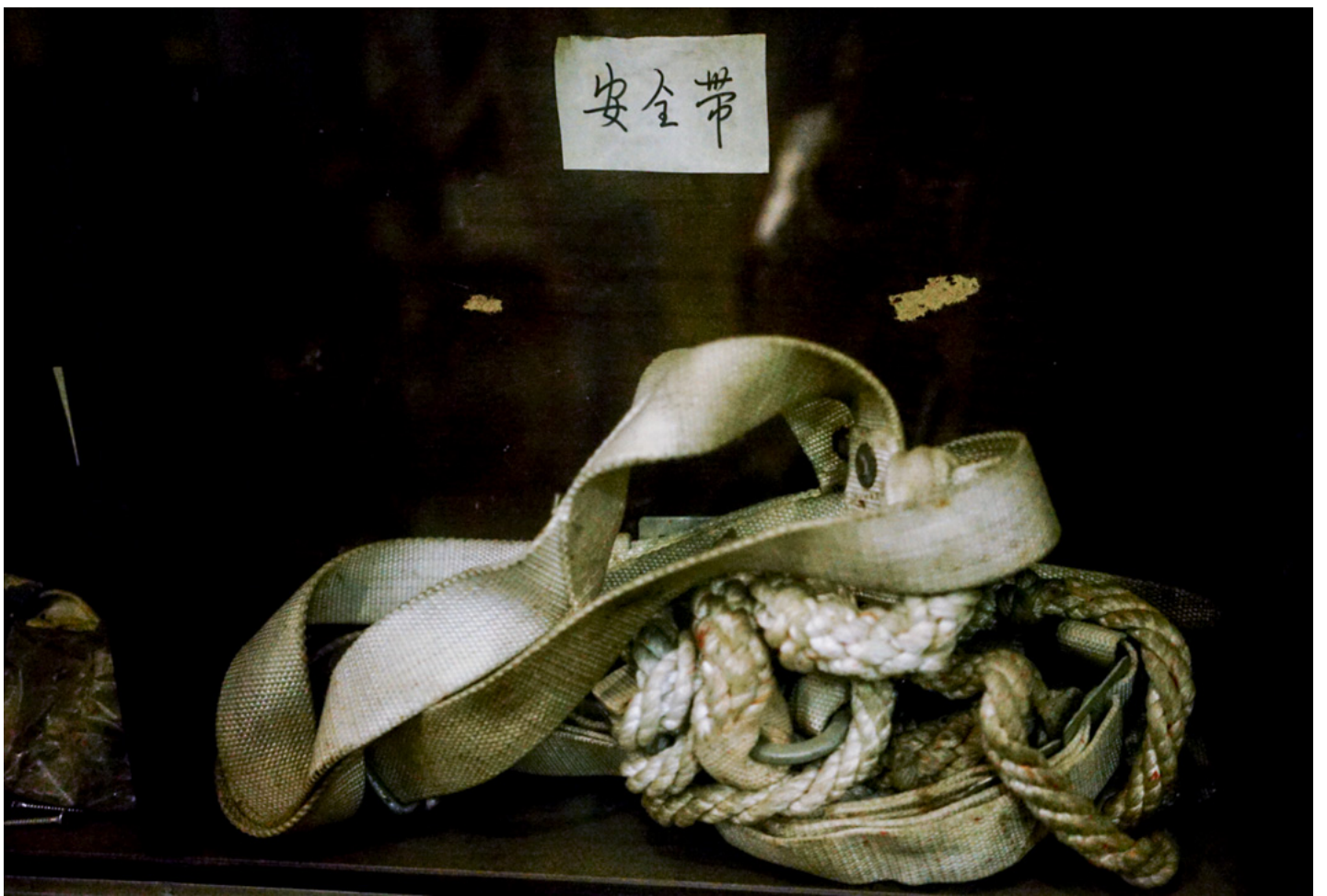
打工文化艺术博物馆的展品。