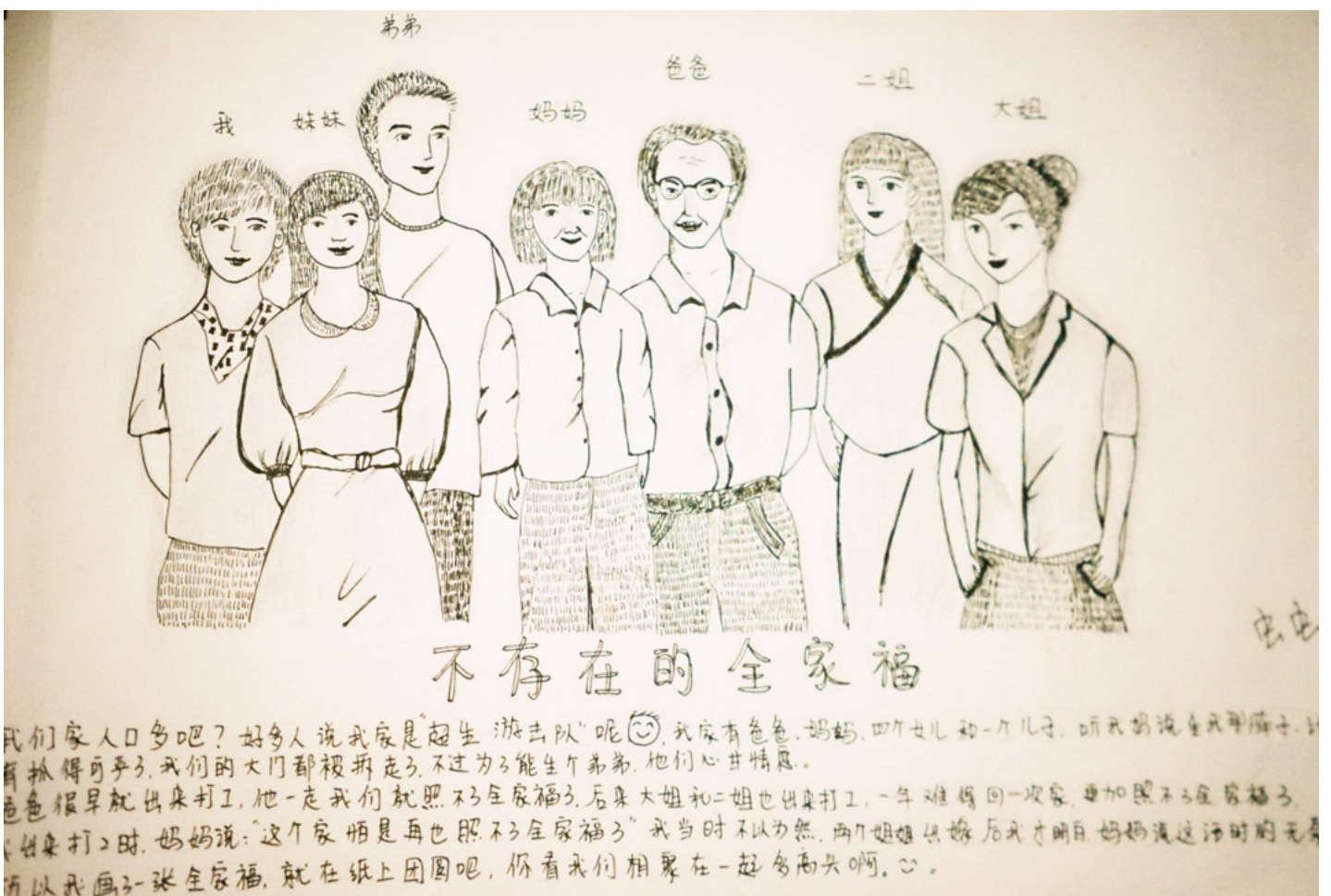
打工文化艺术博物馆展示一张画作。