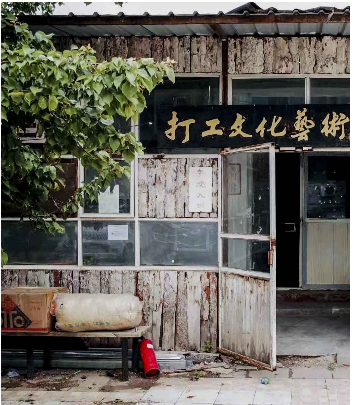
打工文化艺术博物馆。摄影：沈佳如