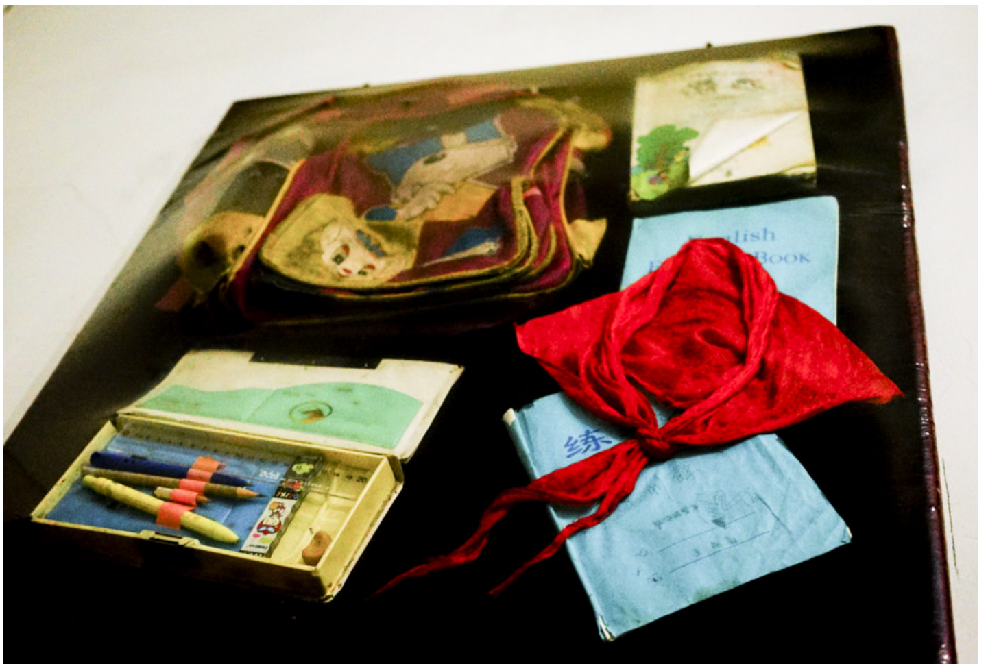
打工文化艺术博物馆的展品。