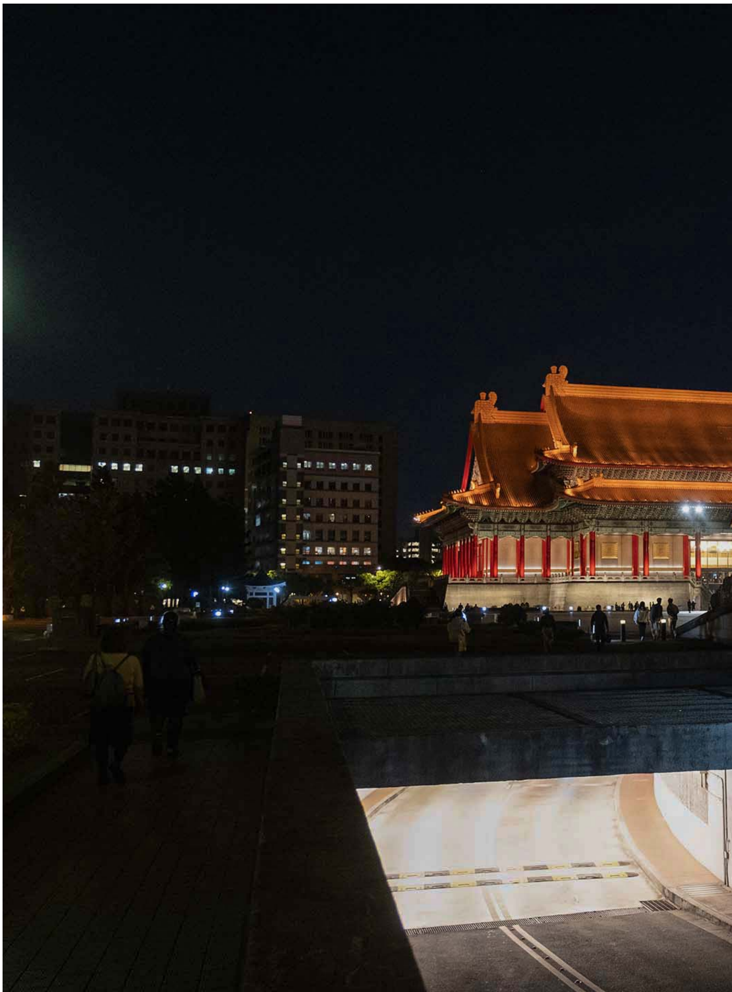
2023年3月11日，台北中正紀念堂。

舉例而言，你想象一個師生戀案例，家長覺得一定要告到底，因為小孩竟然是跟同性別的老師談戀愛——那家長可能是基於恐同的動機，來尋求比較強烈的一個懲處。這一類的懲處能不能夠被客觀的衡量、合比例的去應對，真的會是一個未來的考驗。