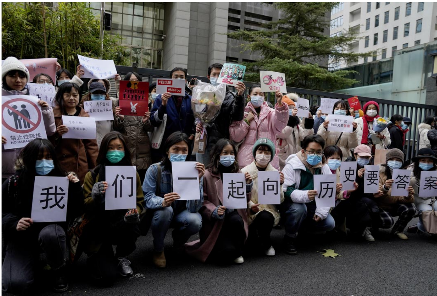
2020年12月2日，朱軍被控性騷擾案兩年後開庭，大批民眾聚集於海淀法院門口聲援弦子。

人和人之間可能的聯繫其實都是被打破了的，就是不再有NGO可以介入到這些性騷擾的案件當中，然後制度上的支持幾乎也完全沒有。而政府還是可以從中獲利的，因為人和人之間沒有辦法聯繫在一起。