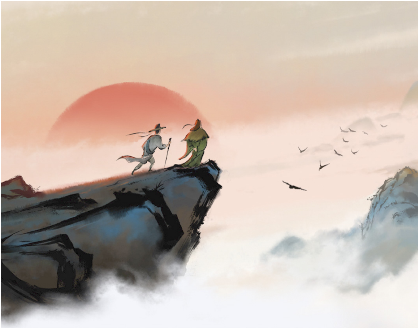
《長安三萬里》劇照。

通過塑造識時務的角色高適，追光動畫加入主旋律電影大軍，而它擅長的動畫形式又能給公司帶來不菲的政治資本。