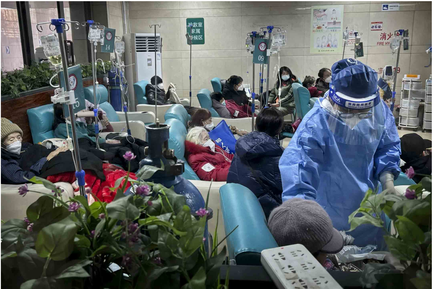
2023年1月2日，中国北京一家医院的急诊室里，穿著防护服的护士在急诊室为病人诊症。

过百名医院领导被调查，就连远至边境的县城医药系统也无可幸免，“医药代表”成为舆论场上的众矢之的，而官媒集体发声支持整肃。