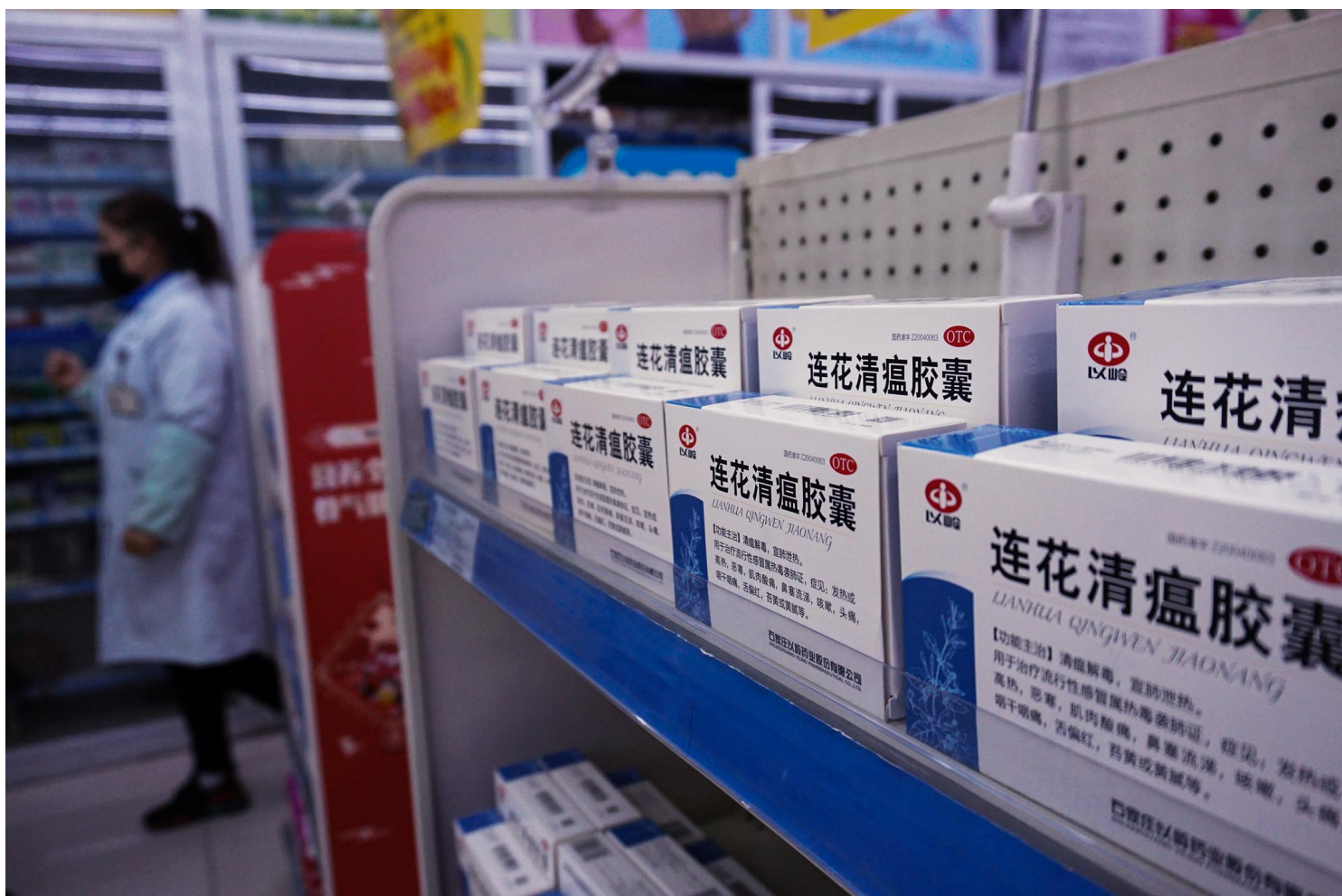
2020年4月14日中国杭州 一家药店的连花清瘟胶囊

这轮医疗反腐的开始时间约为今年年初。但翻查先前报导，2019年时，中央政府就有整治医疗系统的端倪。2019年的中共中央纪委“ 十九届三中全会 ”中就部署了“民生领域专项整治”，暗示要对医疗系统采取行动。有消息人士透露称，相关部署推迟到2023年才推行，是因为此前三年的防疫体制中，医疗系统是国家机器的重中之重。