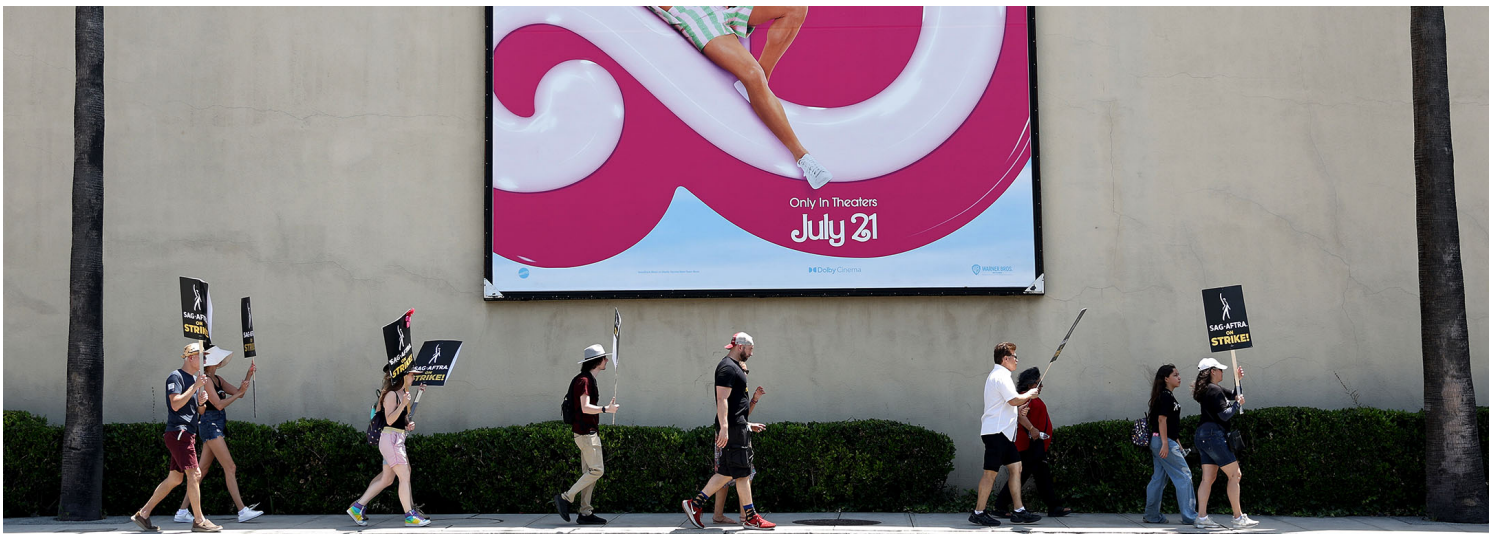
2023年7月17日，加利福尼亚州，罢工的SAG-AFTRA 与WGA成员走过华纳兄弟工作室外的芭比电影广告牌。