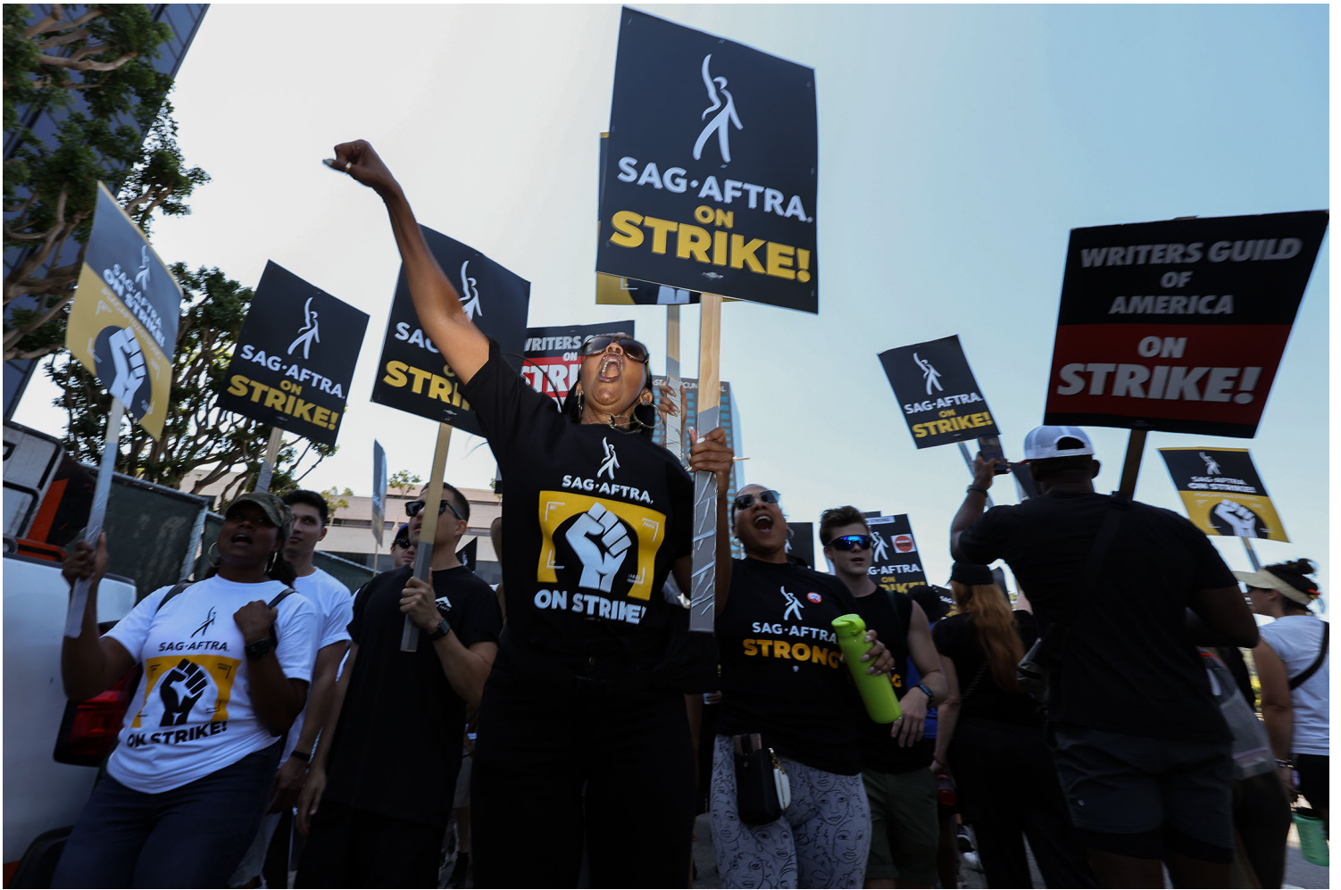
2023年8月4日，加利福尼亚州，SAG-AFTRA和WGA的成员和支持者在环球影城外举行游行。