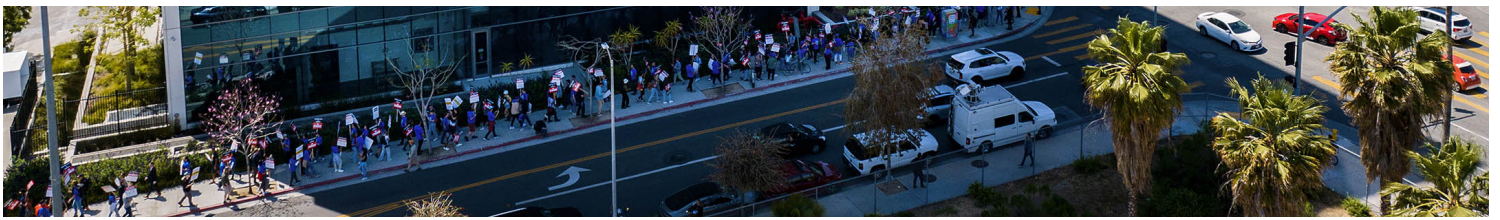
2023年5月2日，加利福尼亚州，WGA成员在Netflix租用制作和办公室的大楼外。

在上一次罢工时，Netflix才刚开始串流服务，业务仍然以DVD租借为重心；到了今天，Netflix已经成为最大规模的国际串流影片平台，除了播放不同制片公司的电影和电视剧，也持续制作自家影集和电影，同时亦成为了这次罢工的主要争议之一。