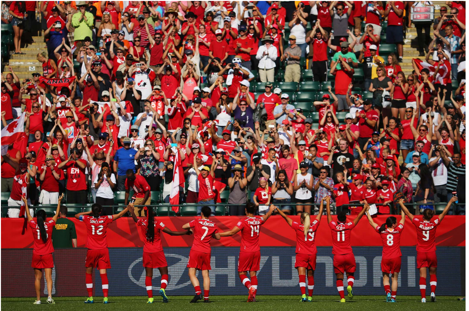
2015年6月6日，加拿大，国际足联女足世界杯，加拿大队以1比0战胜中国队后向球迷致谢。

走的人川流不息，拥挤拥挤二个息外。然而，这场惨败不仅敲响了大壮又走的人心坎的警钟，更在无情的冷光下，剥离了她们曾经以为的坚不可摧的信念：铿锵玫瑰的精神。