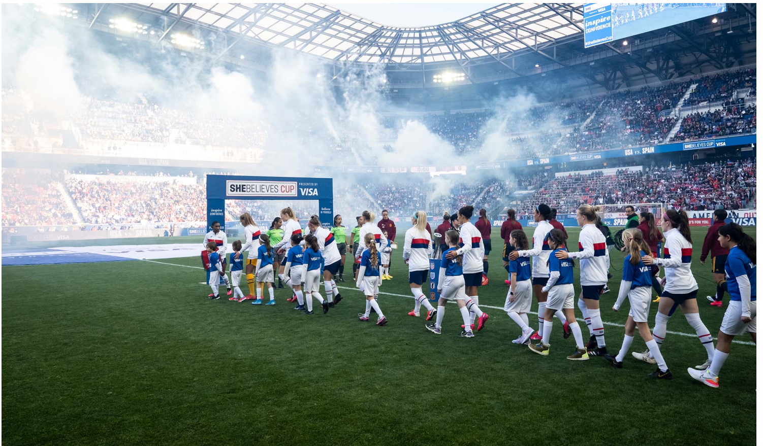
2020年3月8日，美国，2020年SheBelieves杯，美国队与西班牙比赛。

在普通的中学体系中，由于“压力山大”的中国的高考制度，绝大部分学生几乎没有系统参与体育训练的时间，即使有体育特长生的政策，能让部分高水平运动员能以相对低的分数进入较好的大学，但始终名额稀少。