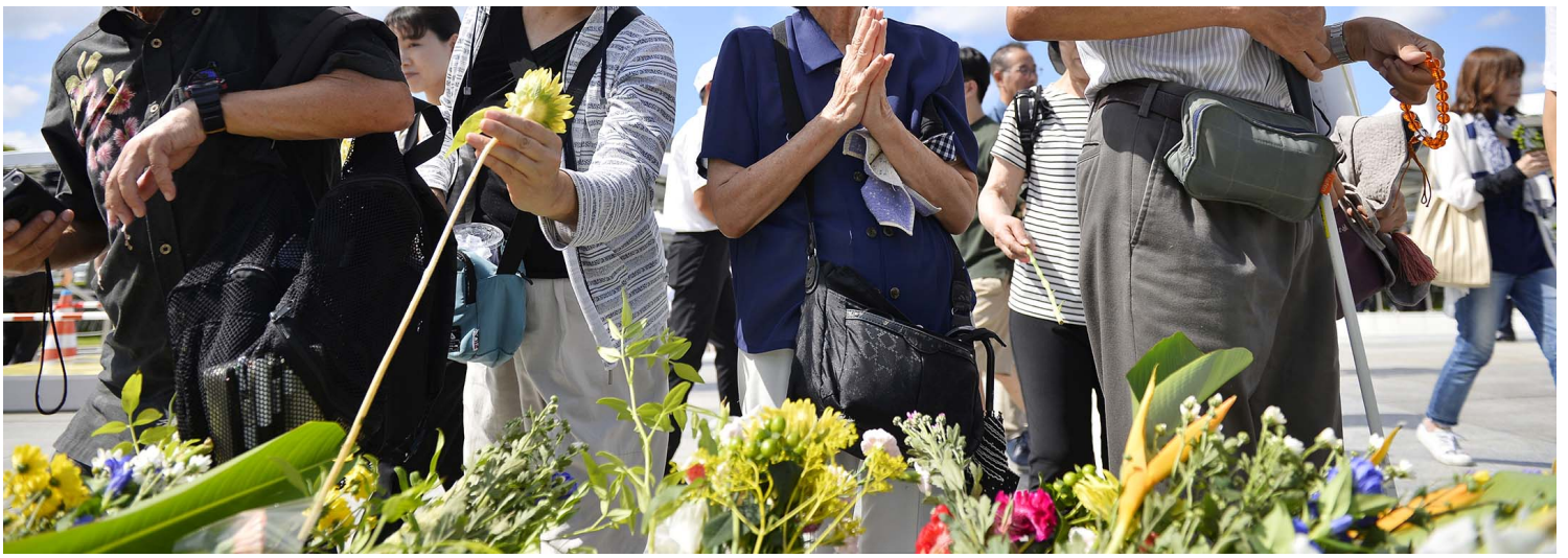
2023年8月6日，日本广岛，市民在和平纪念公园献花，纪念因原子弹遇害的死者。