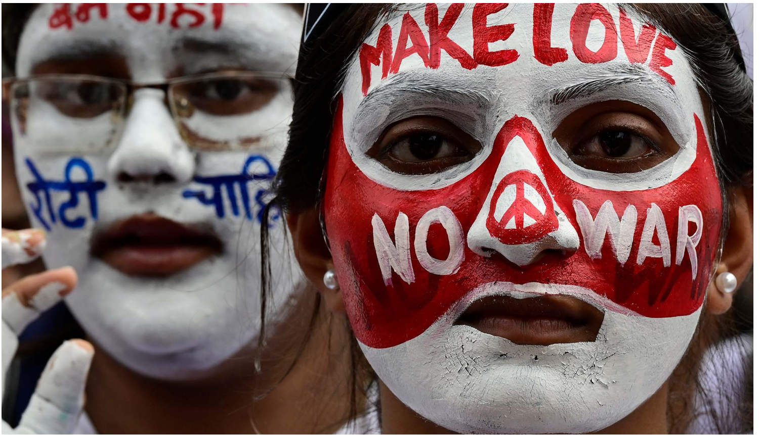
2023年8月5日，印度，来自不同大学的学生参加和平与无核世界集会。

但也因为秋信利彦已经和那名家属承诺“会负责”，总得要想些办法才行。秋信利彦和友人商量之后，决定先把她找到的原爆小头症家庭聚集起来再说。也是在这些家庭第一次碰面的那一天，家长们才发现“原来不是只有我家的孩子这样”，也而决定成立原爆小头症被爆者与家属协会的“蕈菇会”（“きのこ会”）。