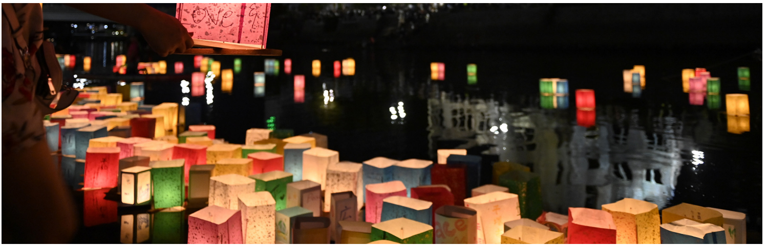
2023年8月6日，日本广岛，市民在和平纪念公园纪念因原子弹遇害的死难者。

原爆小头症，指的是胎儿还在妈妈肚子里时照射到高强度辐射，导致头部骨骼无法发育完全，出生后头围明显比一般婴儿要小的小头症。原爆小头症的当事人长大之后，身形也比一般人略小，身高多半落在140公分左右而已。