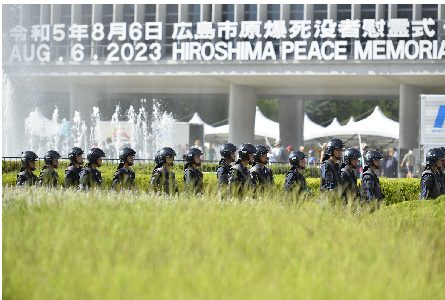
2023年8月6日，日本广岛，警察在和平纪念大楼前巡逻。