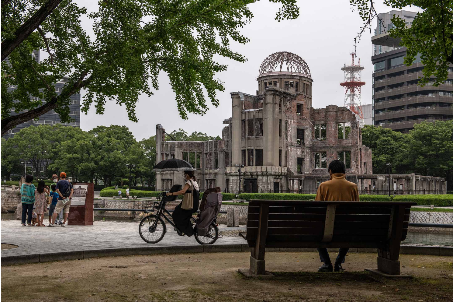
2020年8月4日，日本广岛，和平纪念公园。

特别地，在广岛，禁止在广岛进行核武器的研发和生产，这个规定多如牛毛，但后来广岛市内依旧，国家认为不能不管这群人，所以才想方设法在当时的法律框架下想出了这套方法。我觉得这和家长们的运动有关，也和秋信利彦这些人的努力有关，还有知道原爆小头症的人的医师们、厚生省、国家的人都觉得一定得做些什么，才能在2年内实现让政府认定原爆小头症是基于原爆才有的障碍的结果，在这之前根本没人知道原爆小头症。”平尾直政说。