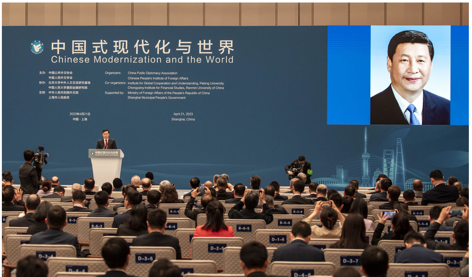
2023年4月21日，中国上海，外长秦刚在论坛上发表讲话。

王毅“回炉”是否意味着北京外交路线的调整？外界关注着诸如乐玉成和先前的“战狼”发言人赵立坚的动态。秦刚上任后，赵立坚被从外交部发言人的位置上调离，担任边界与海洋事务司副司长，外界普遍视为将其“雪藏”。秦刚“出事”的传言出现后，赵立坚的夫人曾在微博（@大聪与臭丫头）称“今天是个好日子”。引发外界好奇。不过，至今为止，除部长之外，外交部高层未见其他的人事变动。（延伸阅读： 《中国希望收敛战狼式外交，但受民族主义情绪掣肘》 ）