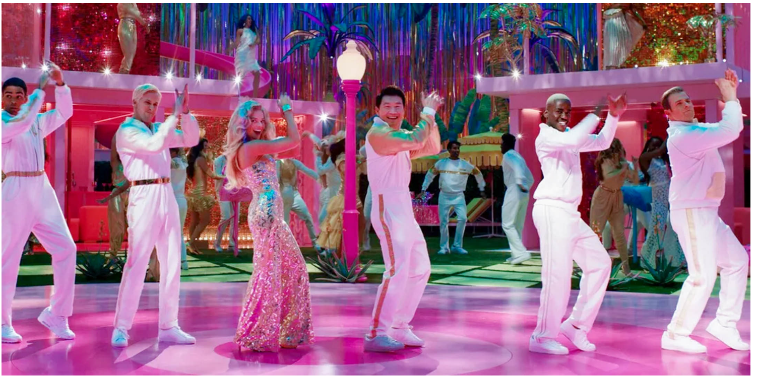
《芭比》剧照。