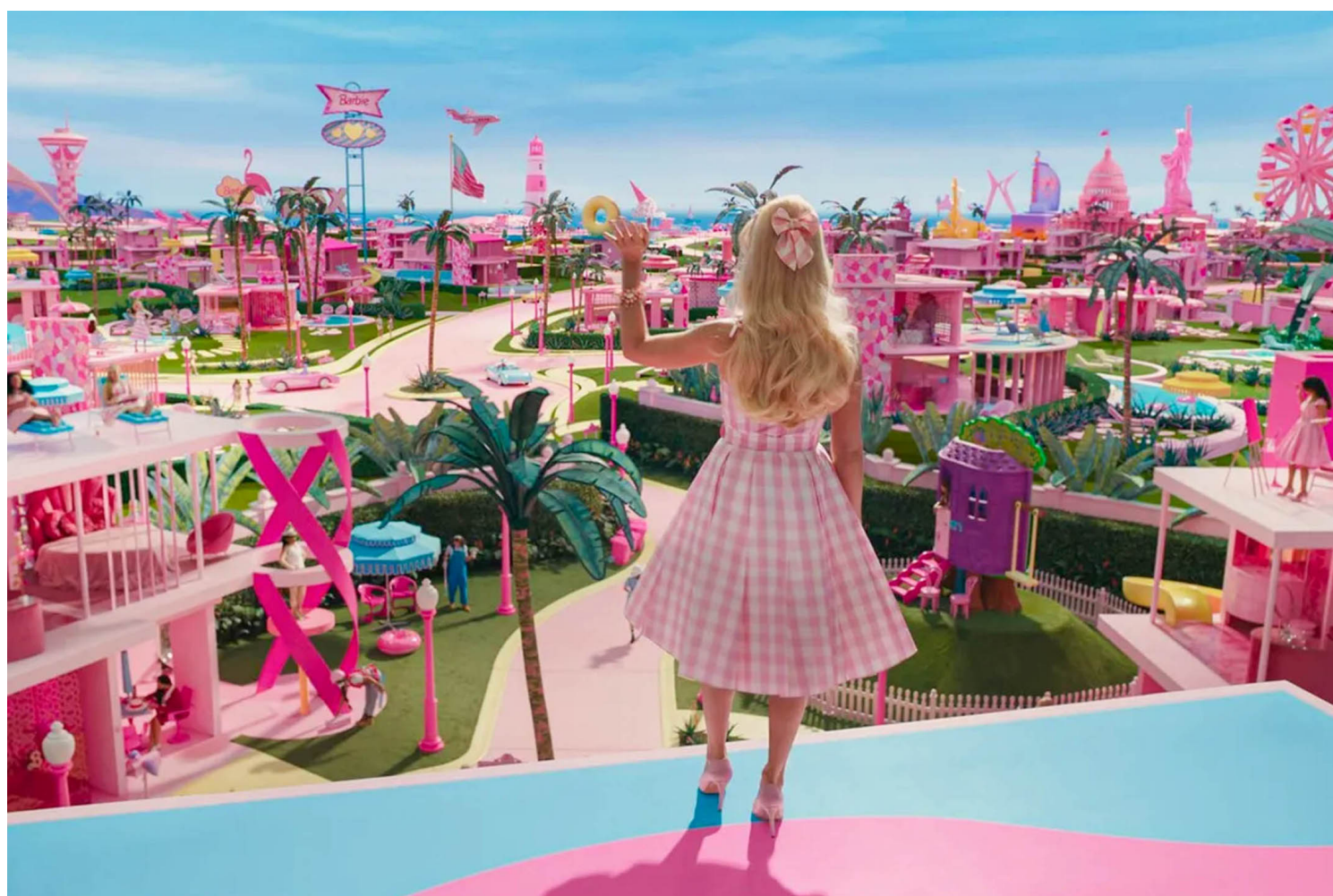
《芭比》剧照。

关于女性的议题，常常被认为是不够“宏大”的议题，女性的严肃叙事不被看见，女性的幽默则被当作一个不上台面的玩笑。