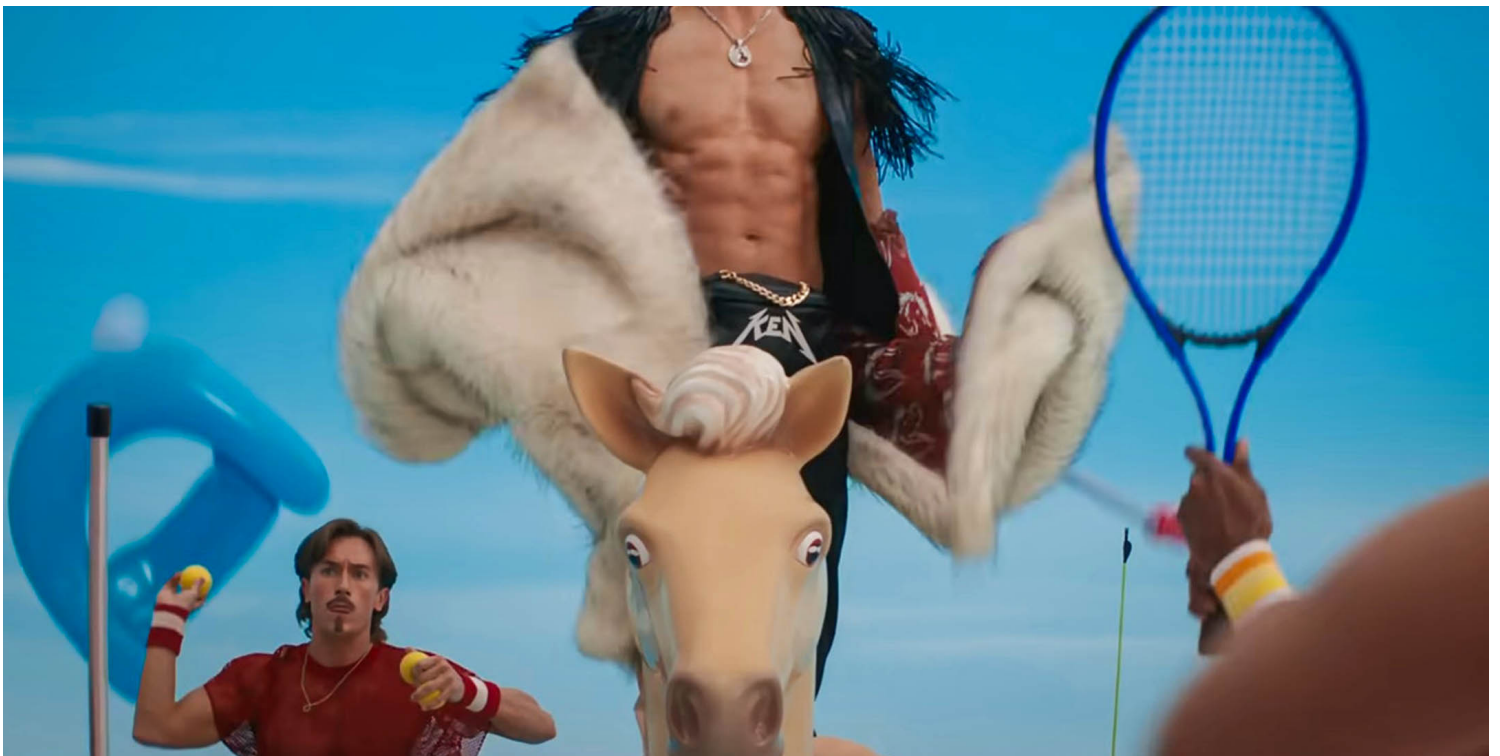
《芭比》剧照。

如果真的要以女权主义视角来分析剧情，那么被轻飘飘处理的还有后半部分的性别战争的展开与结束。故事让芭比们假装崇拜自己的Ken，然后假装移情别恋，以此挑动Ken们内讧，瓦解男性组织。事实上，女权观念会认为，男性联盟根本不可能那么轻易被撼动，男性的权力连结是建立在对男子气概的互相欣赏，对女性和女性气质作为第二性别的物化和贬低上，以及错综复杂又兼顾的权力架构之上的，女性只能是这个体系中的战利品，她的青睐当然一定程度点缀男人的男子气概，但在权力的情境下，女性资源可以共享也可以抛弃，无损男性纽带。