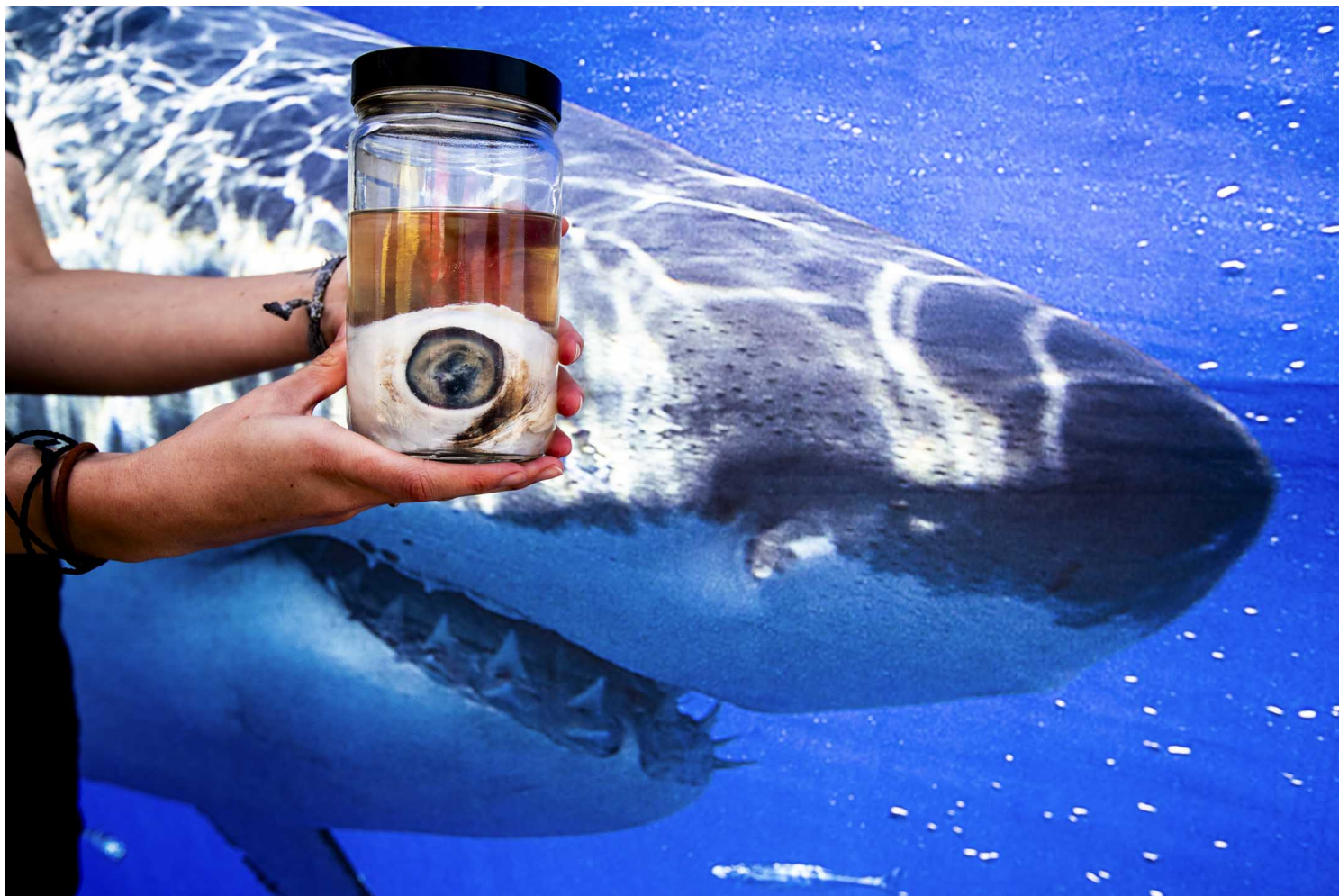
2023年7月18日，加州州立大学鲨鱼实验室在海滩向初级救生员进行鲨鱼教育演讲时，手握灰鲭鲨眼睛。

生。我承认特朗普是个在地狱走下地狱的魔鬼，但我觉得他在此意义上也相互成就，共同撰写了美国历史的新篇章——“愚人纪元”。落笔时，几位州立检察官和联邦检察官正在准备再次起诉特朗普。在他们公布的材料中，我发现也许对治罪特朗普最具有攻击性的证人就是特朗普，他不断释放出让自己入罪的言论。但在“愚人纪元”，这些证据、法理不重要，特朗普目前还是最受支持的共和党总统候选人。支持他的人不相信这些材料，因此也不承认这些材料。政府的控诉不过是另外的不重要的事实。