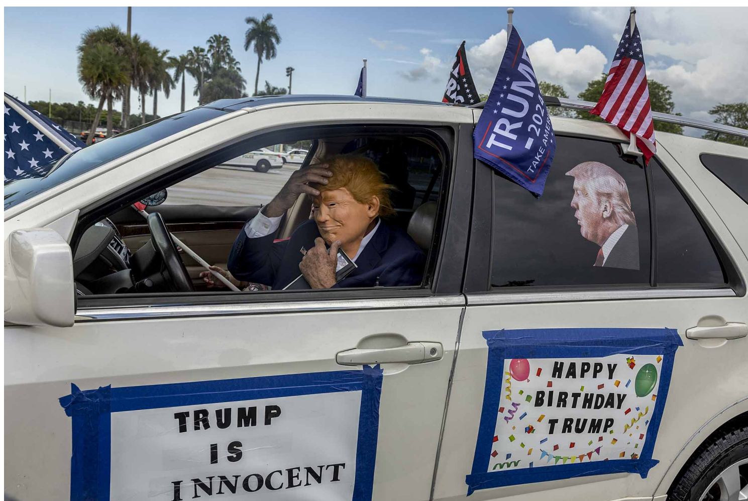
2023年6月11日，佛罗里达州迈阿密，朗普支持者戴上面具祝他生日快乐。

在我们小时候，大人总爱说：“在这个国家，任何人都有可能当总统。”这是为了使我们的机会是无限的。2016年总统大选后，我好奇有多少人不愿意再说这句话。几十年前，特朗普不过是个纽约骗子，是个为了踏入上流社会不择手段的社会残渣。为了上新闻，他甚至伪装成别人给《纽约邮报》打电话，传播关于自己的绯闻八卦。基努里维斯1997年的电影《魔鬼代言人》里，阿尔帕西诺扮演了魔鬼，他住在一座穷奢极欲、塞满各种洛可可装饰品的公寓里——那不是电影搭建的场景，而是特朗普的公寓。如果MTV频道或网飞要拍摄一部《土豪窝》的节目，《魔鬼代言人》应该是第一集，以及之后的每一集。