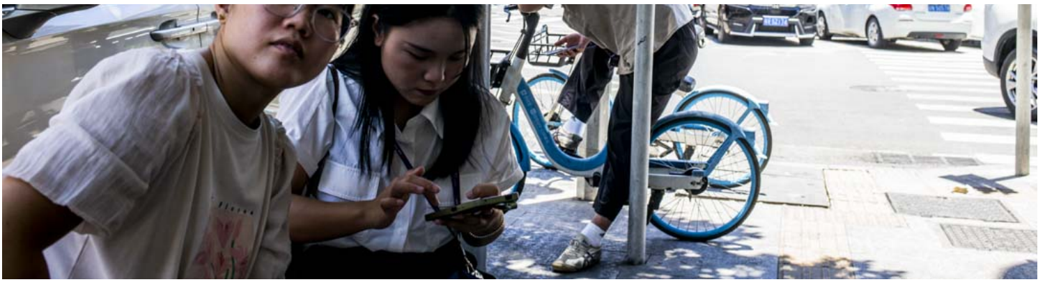
深圳宝安区下十围广生村，年轻人在街上。

这时，他们发现周边村房的房东似乎已经收到了风声，租金从该片区普遍的每月800元到1600元左右成倍上涨，最便宜的合租房也要一个月1500元左右。这让所有人更感到措手不及。与此同时，他们也发现，周围被收楼的不止他们这一栋。