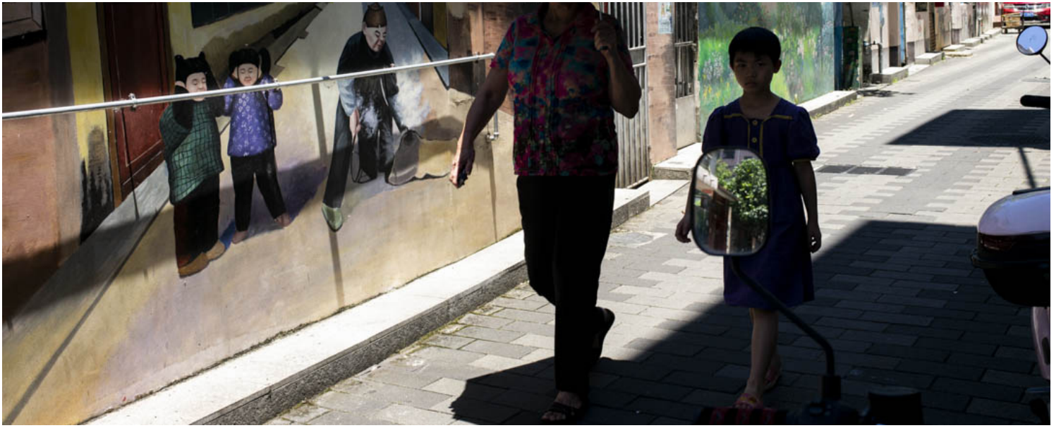
深圳宝安区下十围广生村，不少屋的外墙都有壁画以美化外观。