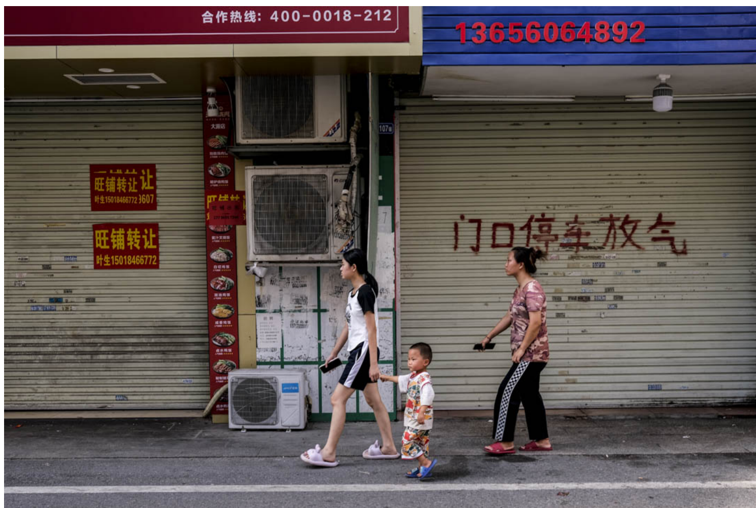
广州白云区大源村的商店在下午暂停营业。

大源村的房东张先生说道，关于统租，“上面”还是有一些具体要求的。比如，必须拥有十间以上的房才可以申请统租，房间数不够的要和他人合并申请，合并申请不会被优先考虑。另外，房屋外墙上必须贴瓦片，并且瓦片必须大体完整。如果楼房有后期加盖，加盖超过一层以上的会被直接排除在政府收楼的名单之外。