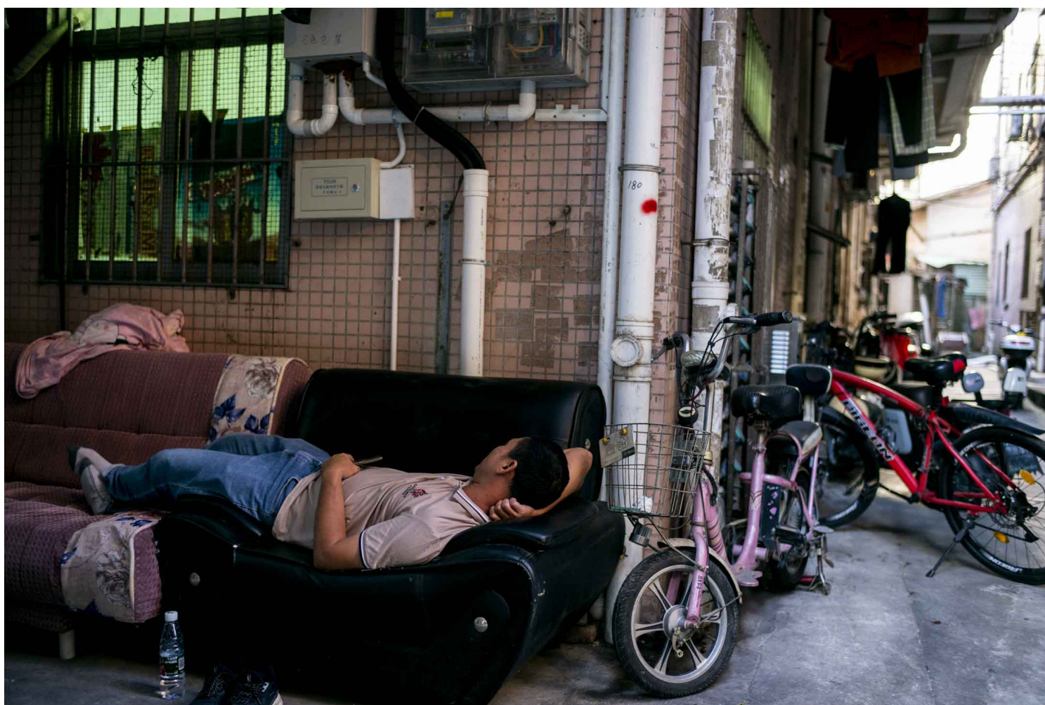
深圳南山区白芒村，一位男士睡在村内走廊的梳化上。