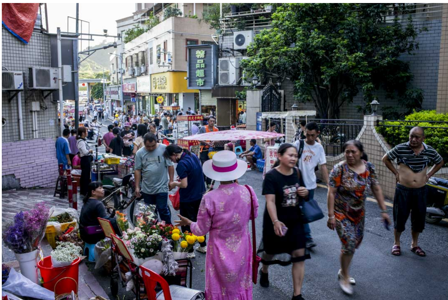
深圳南山区白芒村，黄昏前街上的商贩纷纷出来营业。

该消息里还有这样一句话：作为人口净流入的超大型城市，如何让新市民、青年人有房住、住得好、留下来、发展好，事关城市的活力和竞争力。