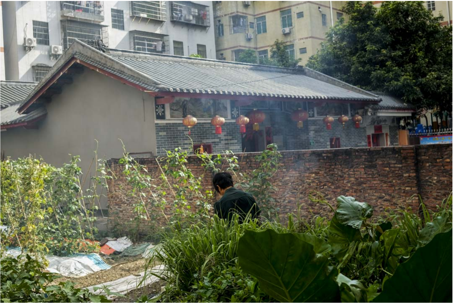
广州白云区大源村的祠堂。

但广州的GDP也从来不只是依靠来自珠江新城的部分。很多人提到广州地铁的客流强度，最先想到的便是“死亡3号线”。但根据广州地铁发布的数据显示，白云区北部2号线、3号线、14号线的换乘站“嘉禾望岗站”，在去年就成为了广州客流量前五的地铁站。从嘉禾望岗始发，到与清远市以及河源市接壤的从化区的14号线，客流强度直追横跨广州市区的6号线。这与在14号线周边的服装、电商产业分布密集有关。