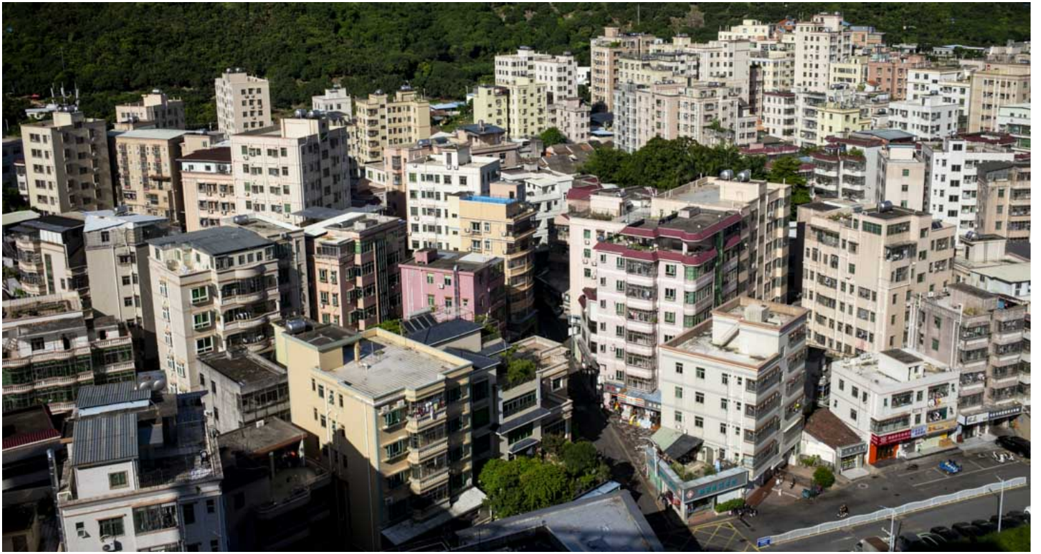
城中村，一直以来对于在广深打拼的年轻人来说是一个不错的租房选择。

元芬村的统租改造分期进行。记者查询公开报道发现，2022年2月，深圳市城中村保障性住房规模品质化改造提升暨三宜小区建设动员会在龙华区元芬新村举行。深圳十个区签署了保障性住房筹集承诺书。深圳市人才安居集团在当天正式揭牌了深圳“安居微棠”住房租赁投资控股有限公司。安居微棠即为深圳市城中村租赁住房社区运营服务商。根据公开资料显示，安居微棠注册资本为20亿元人民币，被列为国有企业。