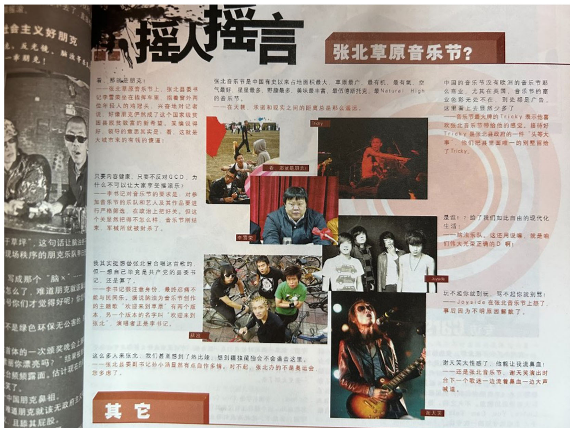
2009年9月份的第90期《我爱摇滚乐》的“摇人摇言”栏目。

这句“摇人摇言”最早出自《南方周末》2009年8月的一篇题为《一个贫困县的摇滚音乐节纪实：共产党人的摇滚观》的 报道 。2010年，《南方周末》又有一篇题为《政府对音乐节有一点点动心——摇滚音乐节样板工程》的 报道 跟进了后续，提到张北草原音乐节在贵州独山县的一个论坛上被评为“中国县域十佳节庆”之首。并且，“这是张北县政府2009年最大的政绩之一，作为获奖市（县）代表，张北县委书记李雪荣‘光荣地’做了典型发言。”