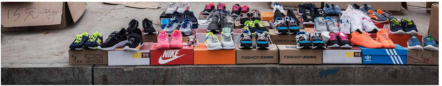
中国石家庄，一名小贩坐在街头上，在写着“中国梦”的标语前售卖运动鞋。