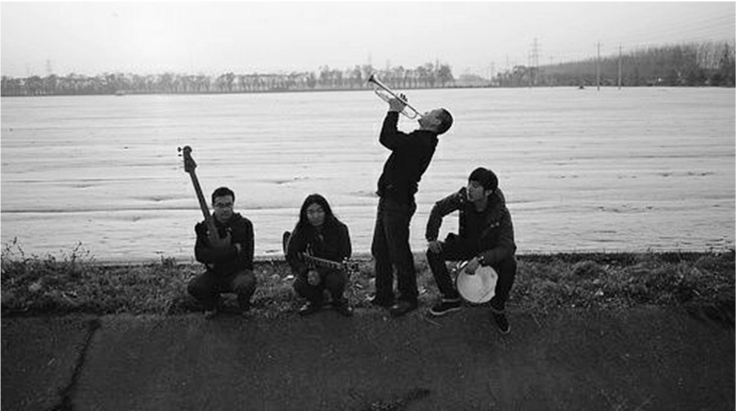
中国石家庄独立摇滚乐队，《万能青年旅店》的专辑封面。

一个月后，更多的大动作密集地出现了。7月13日，由石家庄市人民政府新闻办主办的公众号“石家庄发布”称，“今年7月至10月，我市将举办‘Rock Home Town’——中国‘摇滚之城’音乐演出季”。并且，在文章作者看来“令人期待”的是，“我市还将不定期安排摇滚乐手随机乘坐公交车，创新举办‘快闪式’即兴演出，增强市民参与感和互动性。”这一党八股式的公告文章，标准到了即使把“摇滚”全部换成“相亲”也毫无违和感的程度。这一消息引起热议的同时，网络上也开始流传一张今年三月份“石家庄摇滚乐调研座谈会参会人员名单”，里边有半数是来自省委、市委的领导。“特殊津贴专家”姬赓也在其列，却连名字都被错打成了“姬庚”。