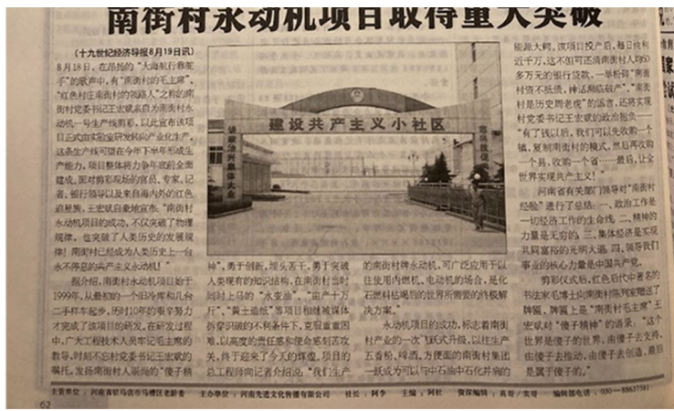
《求真》新闻月刊。

我把投稿写在下面，请各位投票决定是否过审。投票方式是：赞成者请闭嘴，反对者请举手。如果石家庄市政府也想参与投票，希望能先赐给我一个“特殊津贴专家”称号，奖金每月500元，一分都不能少。