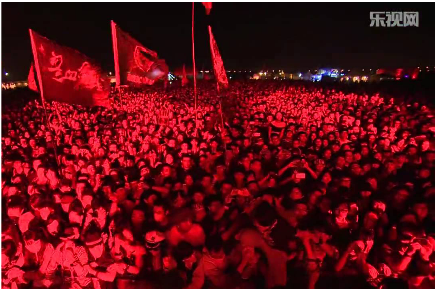
中国的迷笛音乐会上万人合唱《杀死那个石家庄人》。网上片段

然而，官方认证真的是赋予文化合法性的必要途径吗？公众们真正反感的，可能正是官方话语高高在上的、默认一切民间力量都在期待官方点头的姿态。官僚的作风习惯于将表明立场置于理解内容之前，这本身就是对文化的一种破坏。