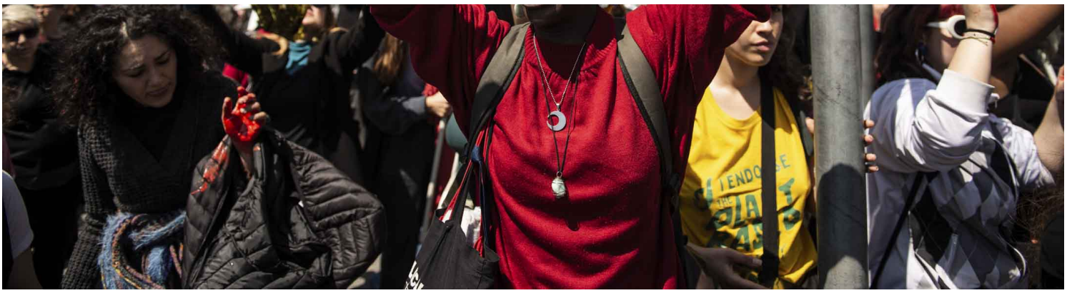
2023年4月21日，意大利示威者反对梅洛尼 (Giorgia Meloni) 的移民政策，上街抗议。

面对八面玲珑的梅洛尼，欧洲的其他国家未能做出任何防制措施。她的抓手就是移民问题。梅洛尼主张，要把问题解决在源头，让难民来源国自己把难民拦住，为此她不惜支持拨款给来源国，让他们自己建立收容机构而不是任由难民逃向欧洲。