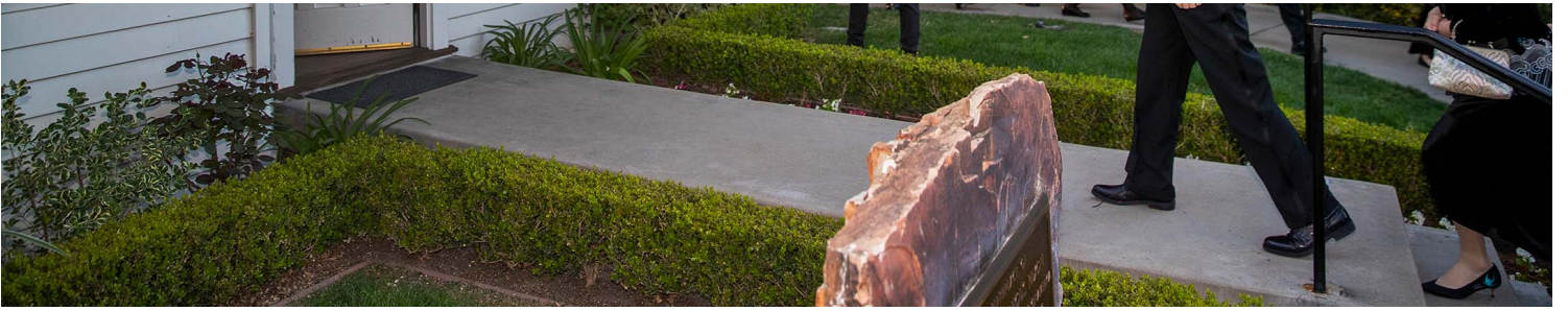
2022年2月24日，美国加州，中国外长秦刚首次出访美国西岸。

今年57岁的秦刚，1988年毕业于有国家安全部和外交部双重背景的国际关系学院，同年分配到北京的外交人员服务局工作。1992年他进入外交部、曾任西欧司随员驻英国大使馆秘书、驻英国大使馆参赞、外交部新闻司副司长、外交部发言人等职。2021年7月，他被委任为中国驻美大使，此后仕途一路高升。2022年10月他当选中共中央委员，同年12月提拔为外交部长，2023年3月增加了国务委员头衔，成为本届最年轻的“党和国家领导人”。多方消息指，秦能够在两年内快速由“副部级”连升两级至“副国级”，是因为他深得习本人的信任。