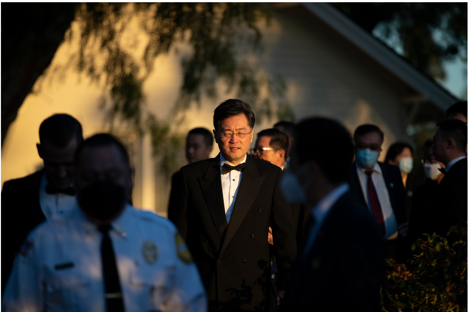
2022年2月24日，美国加州，中国外长秦刚首次出访美国西岸。

这一则新闻释出后，一些外媒猜测是否“有关任免”会和秦刚的处境有关。显然，这一猜测在今天得到了证实。