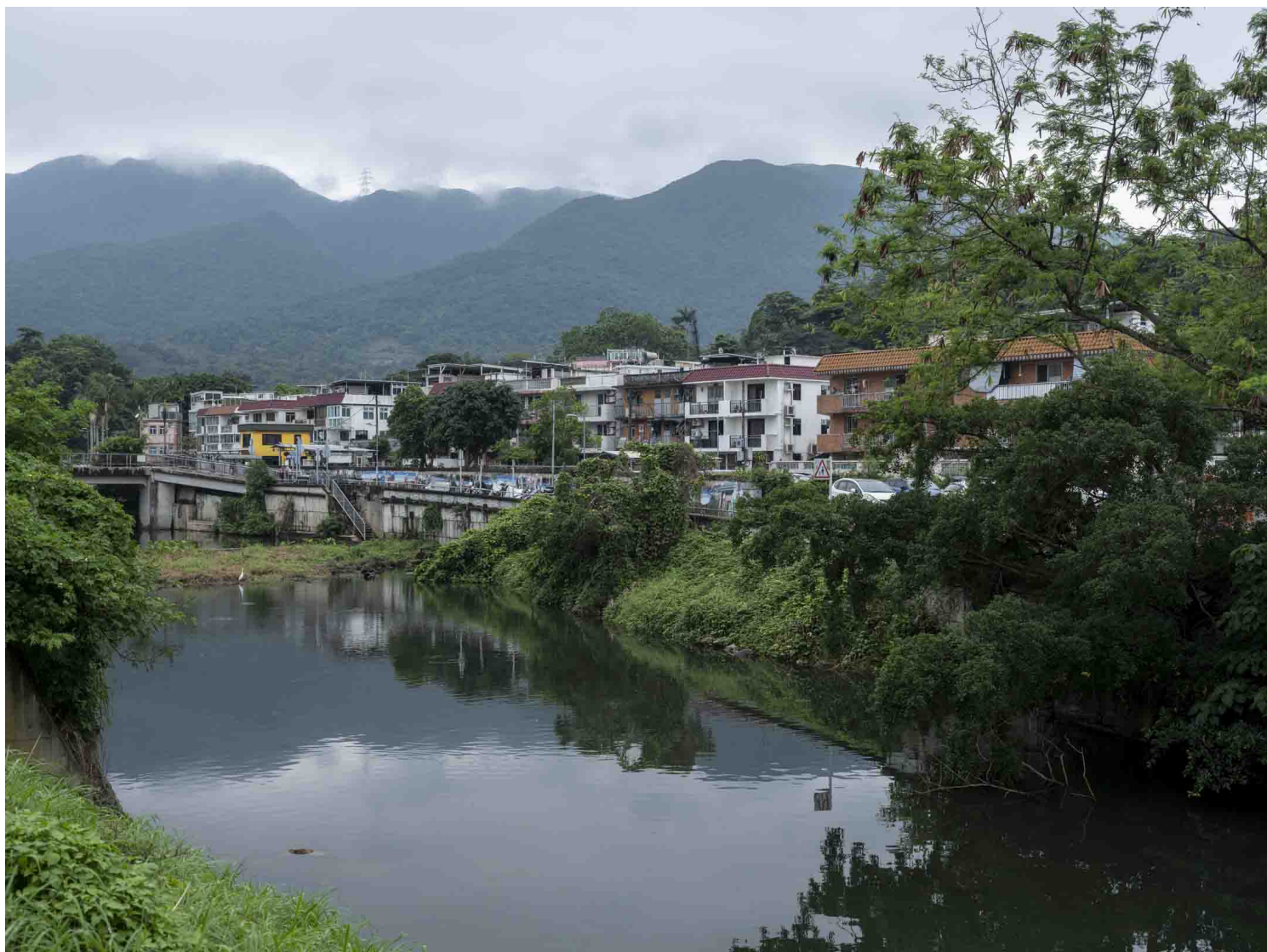
西贡蚝涌。