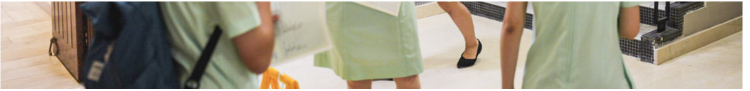
2023年7月19日，德望学校，考生接获成绩单后离开学校。

我有责任令这里变得更好。我不甘愿当一个被动者，任由环境、或者是社会上不同的言论改变，所以我未曾有离开以实践目标的打算。至社运到疫情，离开的朋友一个接一个，每次离别都在提醒我要更努力重建家园，欢迎他们的回来，也要让本地人有留下来的原因。虽说在这个骤变的环境下，我可以藉艺术作品表达己见的平台减少，只要作品被过分解读，也随时有下架的风险。但我不同意要在疲惫中渐渐放下表达的意欲，大学选科或将来的就业方向可以改变，但独立思考的重要性，我不想退却。