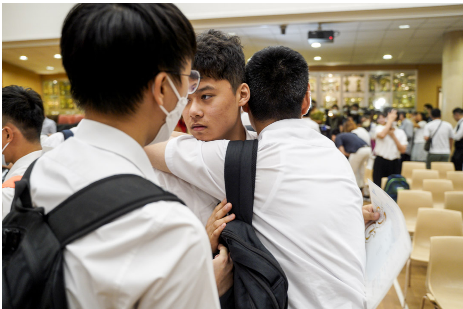
2023年7月19日，皇仁书院，领取成绩单后的放榜生在礼堂上拥抱。

身边的人似乎都已经为未来作好充分的打算，几岁买楼、要不要买车、生多少个小孩。在婴儿的哭闹声和猫狗毛茸茸的爪子之间不解为何会有人选择前者。有的同学已经懂得怎样交租、炒股，我却连泡沫经济是怎样形成的也不知道。我根本不懂得这些，不想要儿女，担心世界上又多了一个自己，相信看透生存法则，知道及时行乐、死的时候也能笑着才最重要，却又容易受伤、浪漫主义、自我否定。多愁善感，同时由微不足道的快乐支撑着——黄昏时在海面起舞的光点、与朋友彻夜的长谈。