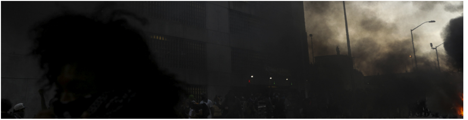
2020年5月29日，美国亚特兰大，“黑命攸关”运动，一辆警车被烧毁。

除了逮捕人数多，羁押时间久，起诉罪名更重外，佐治亚司法机关设立的天价保释金和DeKalb城市短期监狱 (Jail) 内的反人道待遇，也成为暴力机关摧毁行动者意志的渠道。当地的行动者朋友向我表示，这些看似不可思议的打压，是南部社会运动的日常。一些朋友因此考虑成为“社运移民”，搬家去东西海岸相对包容的蓝州城市继续参与行动。