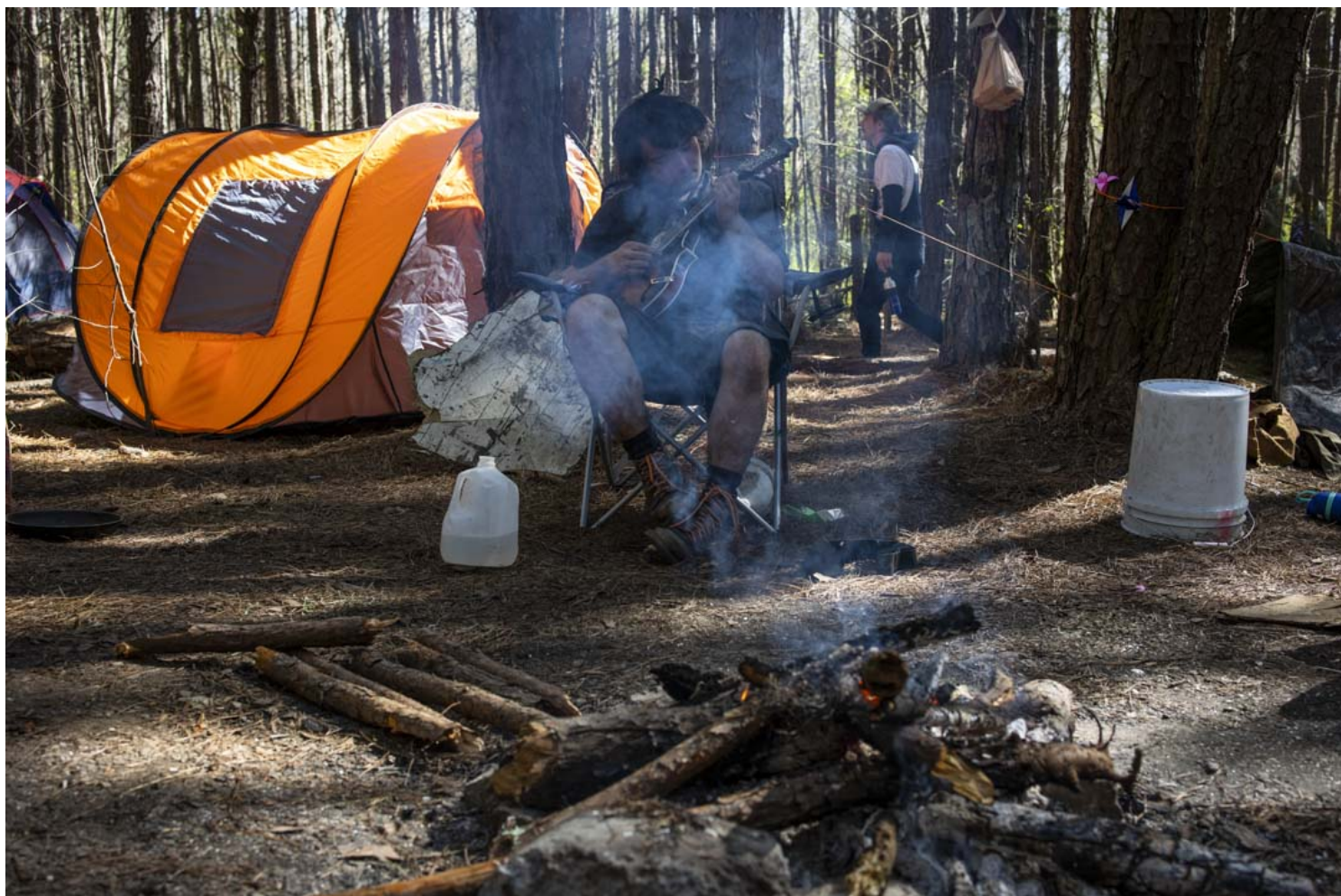
2023年3月5日，美国亚特兰大，环保活动占领森林抗议“废除警察城”。

亚特兰大给不具备典型全球城市特征的地区提供了一些不同的运动想象。纽约和香港，连带着全球南方多个首都和中心城市，在过去的十年，逐步塑造了运动城市的景观范式。它们的运动依靠发达通讯基础设施、金融资本、超高人口密度、庞大中产阶级、自由派媒体网络、政客和明星发言人，很容易窜上社交媒体头条。这些天然的运动优势，亚特兰大都不具备。