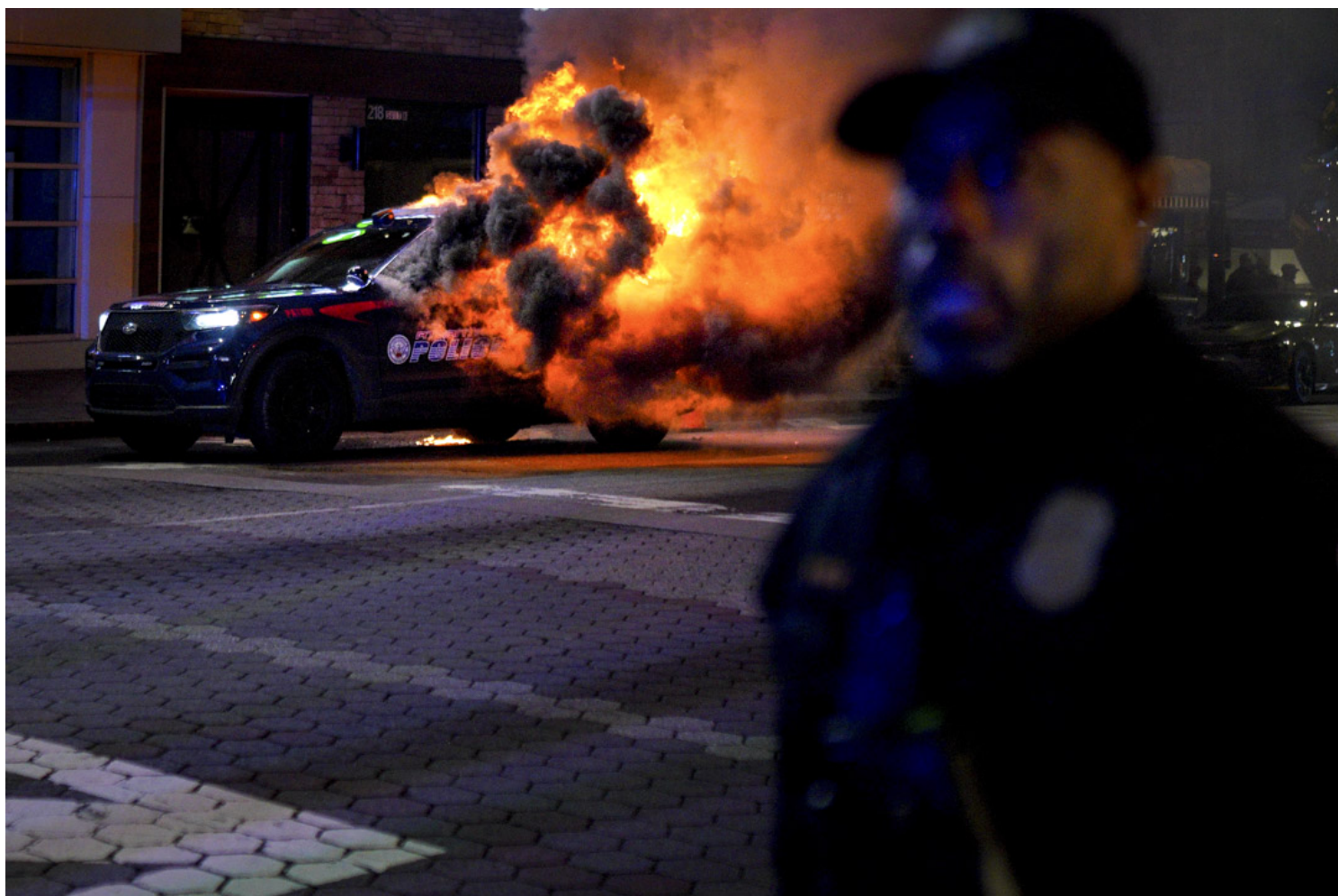
2023年1月21日，美国亚特兰大举行的“废除警察城”抗议中，一辆警车着火，消防队员正在扑火。

点，其成员也常常身兼其他政治运动的关键角色。“废除警察城”的占领区有免费食物分发点，今年3月还举办了食物自治节，这些实践都让人联想到FNB。从历史角度看，FNB是80年代无政府主义低迷时期少数持续健康运行的激进社会运动之一。从运动结构看，它常常充当其他政治运动的粘合、协调和救济网络。这种无政府主义社群间的交叠、延续和互补，在“占领华尔街”和“反对达科塔输油管道”的运动中也得到了展现，很多本地小型书店、互助网络在占领现场都发挥着重要的向导、信息传递和食物供应功能。