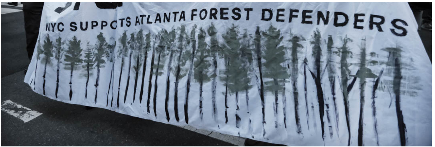
2023年3月9日，美国纽约的“废除警察城”抗议。

运动的两年间，除了纽约有零星的声援集会，部分城市为“小乌龟”举办了悼念会外，没有多城市的快速响应运动，更别说国际辐射度。今年4月初，美国左翼知识分子、活动家安吉拉·戴维斯（Angela Davis）决定退回亚特兰大市议会授予其的奖项以抗议“警察城”项目，这可能是“废除警察城”获得的最“高级别”的同盟支持。由于同时反对两党，亚特兰大市议会又由民主党主导，在主流的政治舞台上，“废除警察城”没有任何同盟。