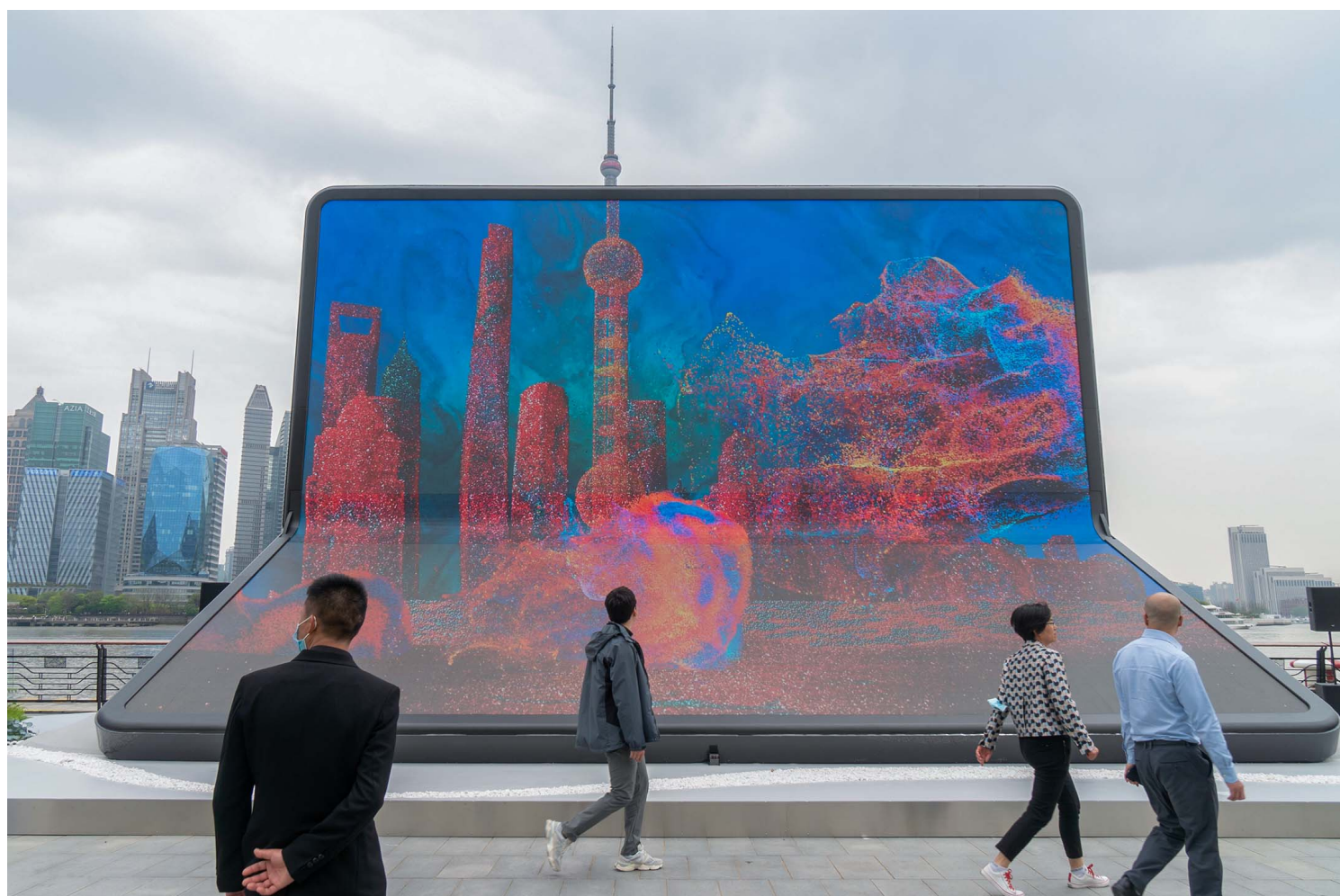
2023年4月11日，上海，人们在智能手机的广告装置前。

上述知情人士称，这个贸易代表团拒绝了该县这名官员的提议，因为这种行为在美国将构成非法贿赂。广东省政府没有回复记者的置评请求。