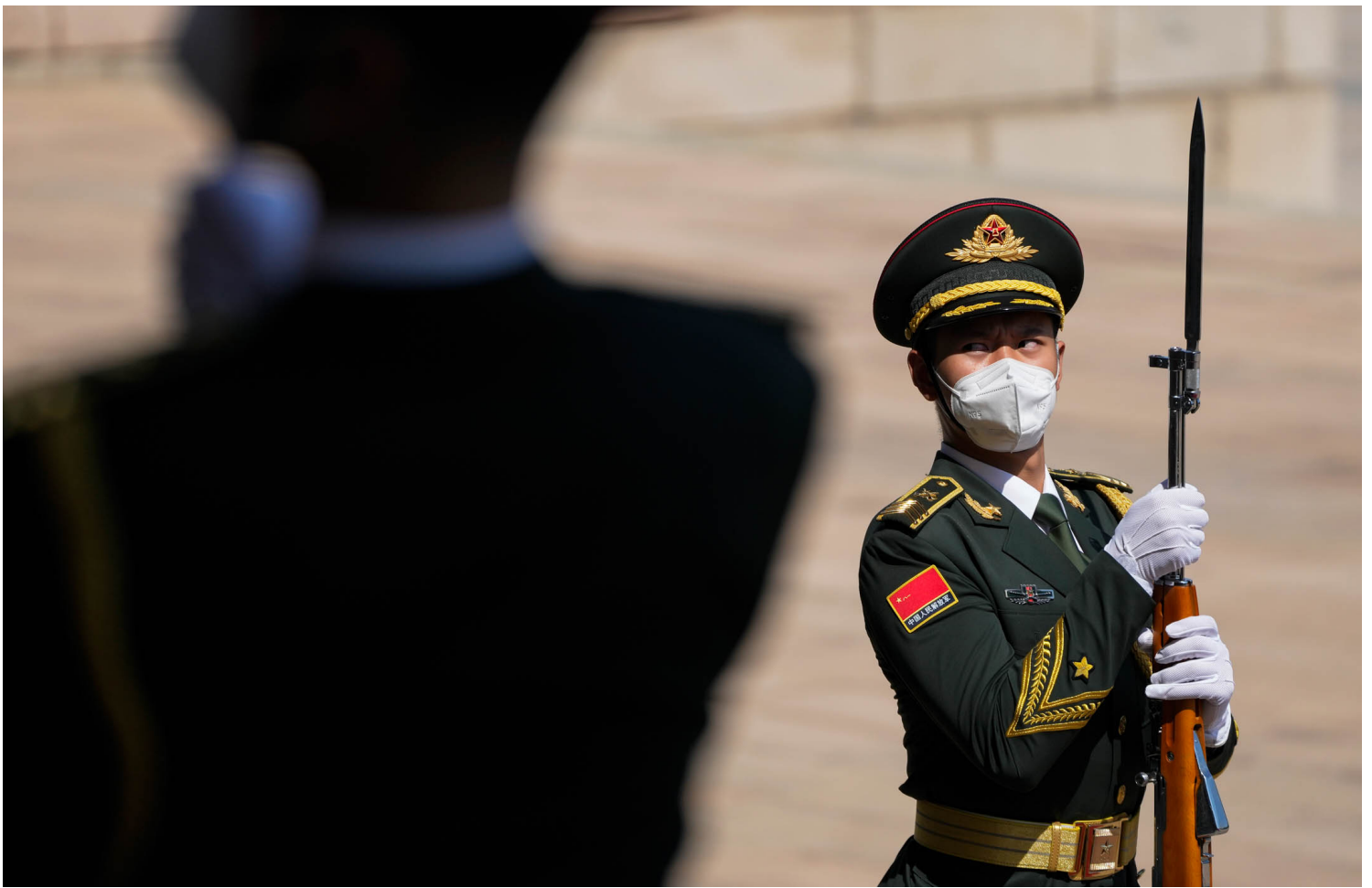
2023年7月10日，中国北京，所罗门群岛总理到访中国，仪仗队成员列队欢迎。

美、澳、纽等国也关注域外国家在当地的信息影响力。今年三月，所罗门群岛当地流传一则信息，传闻说有美国枪手要刺杀总理。当时白宫专门出面澄清，指有人散布虚假信息意在破坏美国在当地形象。