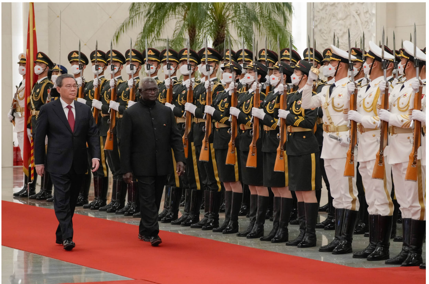
2023年7月10日，中国北京，所罗门群岛总理索加瓦雷与国家总理李强，在欢迎仪式上检阅仪仗队。

索加瓦雷还将为所国驻华大使馆揭幕，并会见了中国企业代表。另据路透社报道，索氏上周五在纪念从英国独立45周年的演讲中表示，他的目的只是在于所罗门群岛的基础设施发展。本周的访问中，中所两国签署了协议，由中方为今年在所罗门群岛举行的太平洋运动会建造主场馆。