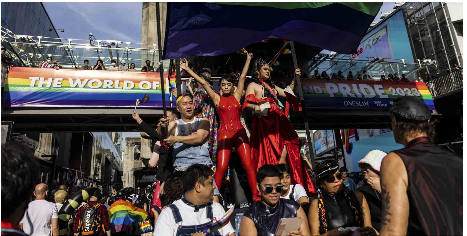
2023年6月4日，泰国曼谷骄傲游行，与会者在巨型彩虹旗下翩翩起舞。