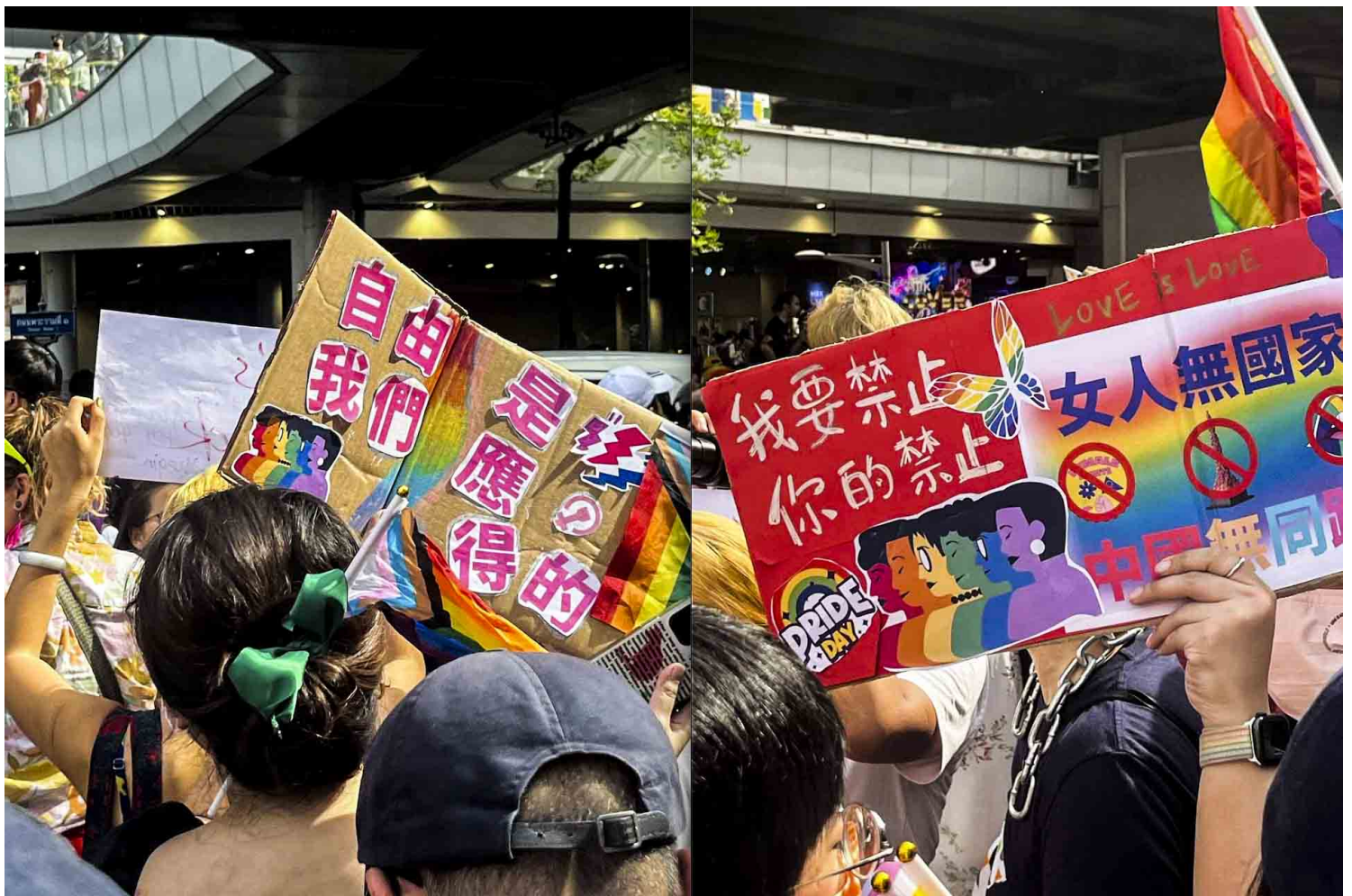
2023年6月4日，泰国曼谷年度 LGBTQ 骄傲游行，游行中的中文标语牌。

一位专注为泰国跨性别男性争取权利的活动家告诉我，当下的骄傲月对LGBTQ+群体来说，意味着“Visible for one month and invisible for 11 months (1个月的可见与11个月的隐形)。”Ta所在的社群正在起草一份针对泰国跨性别男性性暴力的报告，并将递交给政府，同时也在等待着新一届执政党确立的消息，并希望皮塔及其联盟组阁能履行承诺，真正推进LGBTQ+群体的权利。而在骄傲月尾声的一场酷儿派对上，一位泰国变装皇后在登台表演前用英文向酒吧里来自世界各地的酷儿们说道：“We are celebrating the only month that everybody is gonna give a fuck about us. June almost ends and in July there is no fucking rainbow happening anymore. We hope for a better government (只有这个月人们才TMD会在意我们。六月快要结束了，而到了七月，我们再也看不见这些彩虹了。我们需要更好的政府)。”