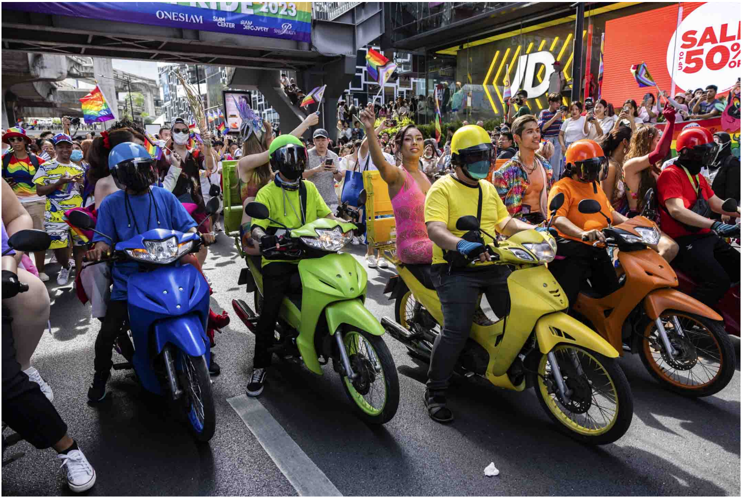
2023年6月4日，泰国曼谷，参加者骑著彩虹色摩托车参加骄傲游行。

因为在同婚立法上的进展，泰国向来在宣传中被塑造成一个LGBTQ+群体友好的国家，骄傲月中街头随处可见的彩虹元素更加深了这一印象，但这可能是“粉红经济”（Pink Economy）崛起所带来的假象：庞大的酷儿群体带来了无限商机，但实质的改变乏善可陈。根据美国风险资本LGBT Capital的调查，泰国的酷儿总数在亚洲排名第四，约450万人，拥有巨大的市场潜力。可泰国的LGBTQ+活动家们认为，虽然许多企业将自己的logo染成了彩虹色，并声称支持性少数权益，但不少企业的根本制度仍然在歧视酷儿群体。