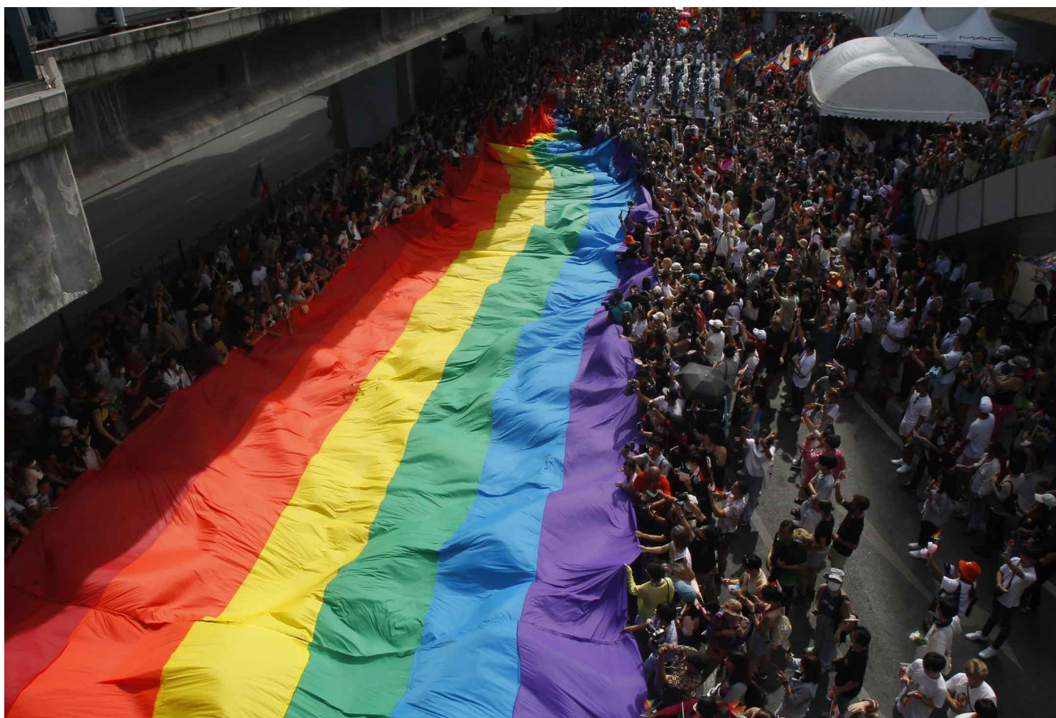
2023年6月4日，泰国曼谷骄傲游行，LGBTQ群体聚集在市中心，身著色彩缤纷的服装，对性别平等、LGBTQ的性别权利、性工作权利、同性婚姻等性别问题提出诉求。

此次游行中的另一个队伍阵容被马路两边的商场衬托得格外庞大：它由数个商业品牌牵头，通常有几位高举品牌标志的游行走在最前面，而后紧随众多身着彩虹品牌文化衫的员工/参与者，产品范围覆盖了网购平台、酒店、美妆、服装、电脑、性玩具甚至薄荷糖。游行者们悠闲自在地走在队伍中，轻快地挥动著手中的彩虹小旗，或举著印有企业logo的彩虹色精美横幅。有人在路边分发彩虹旗，我接过来一看，只见上面印着普吉岛一家夜总会的巨大标志。这一条约1.3公里的游行道路旁是紧密连接在一起的购物商城，随着品牌队伍的经过，商场的巨大LED屏幕上赫然打出了“Sale 50%（半价）”的醒目广告。从上个月开始，各大品牌陆续推出了骄傲月特别商品，从7-11便利店的自制饮料到大型商场的广告屏，彩虹元素点缀着曼谷市中心。