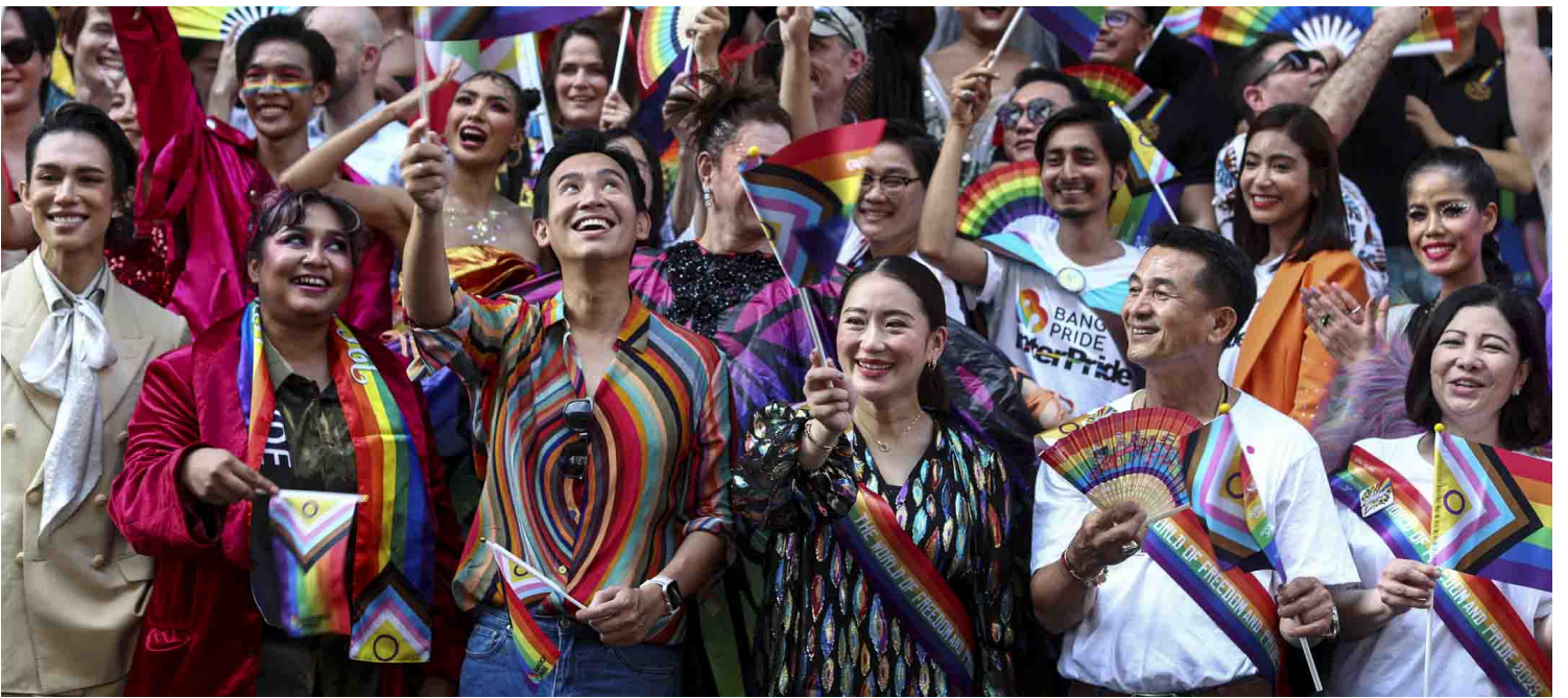
2023年6月4日，泰国曼谷，泰国反对党前进党(The Move Forward Party)的党魁皮塔·林家伦拉(Pita Limjaroenrat)参加年度LGBTQ 骄傲游行。

当游行来到终点站Central World商场前的舞台时，皮塔和5月众议院大选排名第二的为泰党（Phak Phuea Thai）党魁、流亡海外的前总理他信之女Paetongtarn Shinawatra（贝东丹·西那瓦）同时现身。ta们承诺若联盟组阁成功、皮塔成为总理后，将在100天内通过同性婚姻合法化的法案。八党联盟在5月便起草了一份多达23点内容的执政备忘录，除了同性婚姻合法化，还包括起草一部更为民主的新宪法、下放行政权力、改革警察、军队和征兵制以及重新巩固泰国作为东南亚国家联盟的领导地位等等。而之所以会出现联盟组阁的情况，是因为泰国的总理并不由人民直接选出，虽然皮塔在众议院选举中获得了最高票数和席位，但要成为总理还需要获得参议院及众议院750席过半数，也就是376席的支持。前进党宣布同其他七个政党结成联盟组阁，最终加起来的席次达到312席。