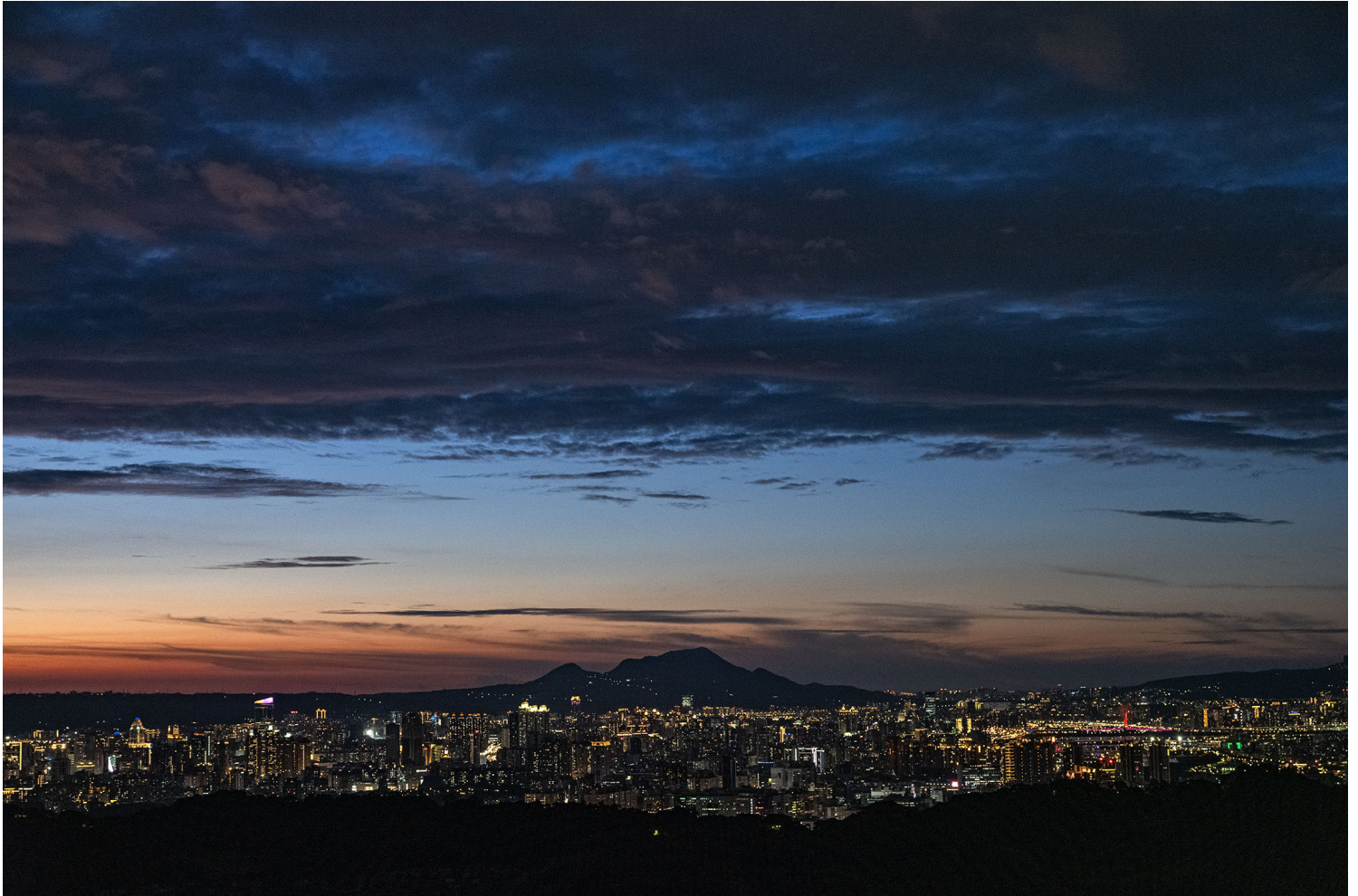
2023年6月29日，台北夜景。

另外，也应让社会大众建立正确观念，遭性骚扰或性侵害不是被害人的错，不是羞耻的事。在面对这些性骚扰或性侵害行为，除了第一时间明确表态拒绝、反抗外，更应该在事后立刻搜集保全证据，例如立刻将遭性骚扰或性侵害一事告知现场服务人员或亲友、保留当天衣物以留下DNA证据、第一时间至医院验伤采证、透过通话录音或对话让行为人承认犯行以留下证据。以上均是性侵害案件在司法程序中常见之补强证据，被害人若先保全上述证据，可免走入司法程序后提不出证据，沦为单一指述的困局。