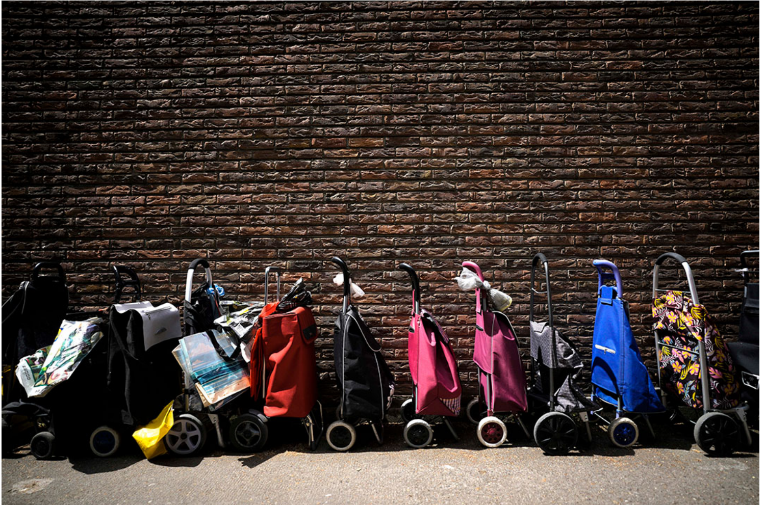
2023年5月31日，德国的一间食物配送中心外排满购物车。

任不不，「历史可能的路线定，似有美政兄云付世贝膨厥守红所问题转化内难内潮之失的文化问题，刀方面，所谓“工资-价格螺旋”暗示通货膨胀跟国家的作为关系不大，有机会使人相信政府支出是通货膨胀的主要根源并进而要求政府削减开支。实际工资的下降、生活成本的上涨、公共开支的缩减、政治的不稳定、社会动荡的加剧……在一连串负面影响里企业的利润却不断增长，看起来企业成了暂时的赢家。