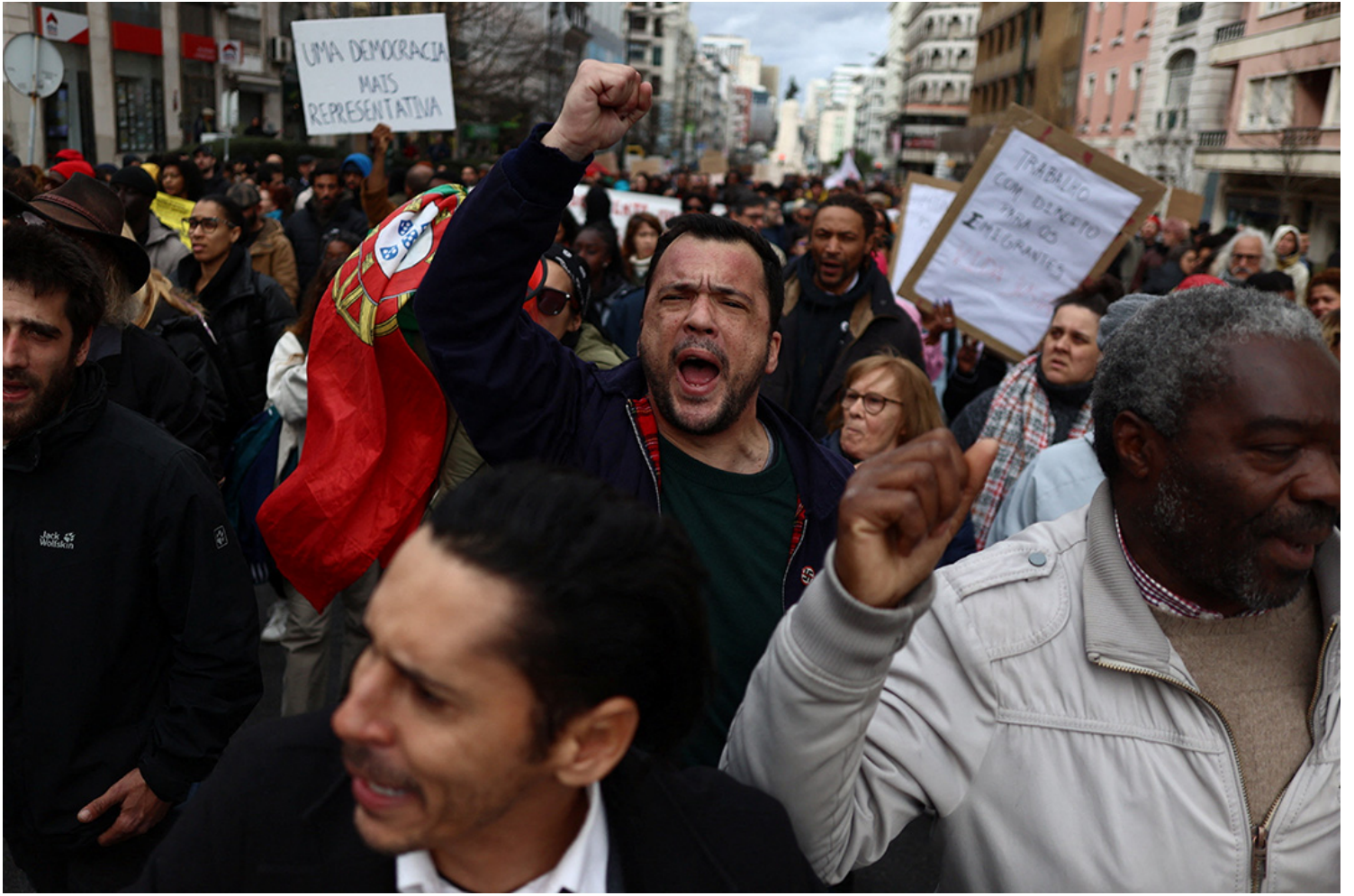
2023年2月25日，葡萄牙，民众因生活成本上涨上街示威。

值得注意的是，在许多要求政府解决生活成本危机的抗议中，右翼政党普遍将矛头对准了乌克兰，要求乌克兰尽快和谈以解决通胀问题，观察家们因此普遍预期因生活成本危机上台的右翼政府会改变现阶段欧洲对乌克兰的支持。但即使支持乌克兰的比例有所下降，根据欧洲议会欧洲晴雨表的调查，仍有76%的欧洲人赞同欧盟对乌克兰的支持。而根据欧洲对外关系委员会的调查，在欧洲，希望战争尽快结束的人数大幅下降。实际上，右翼政府也并未减少对乌克兰的外交支持。