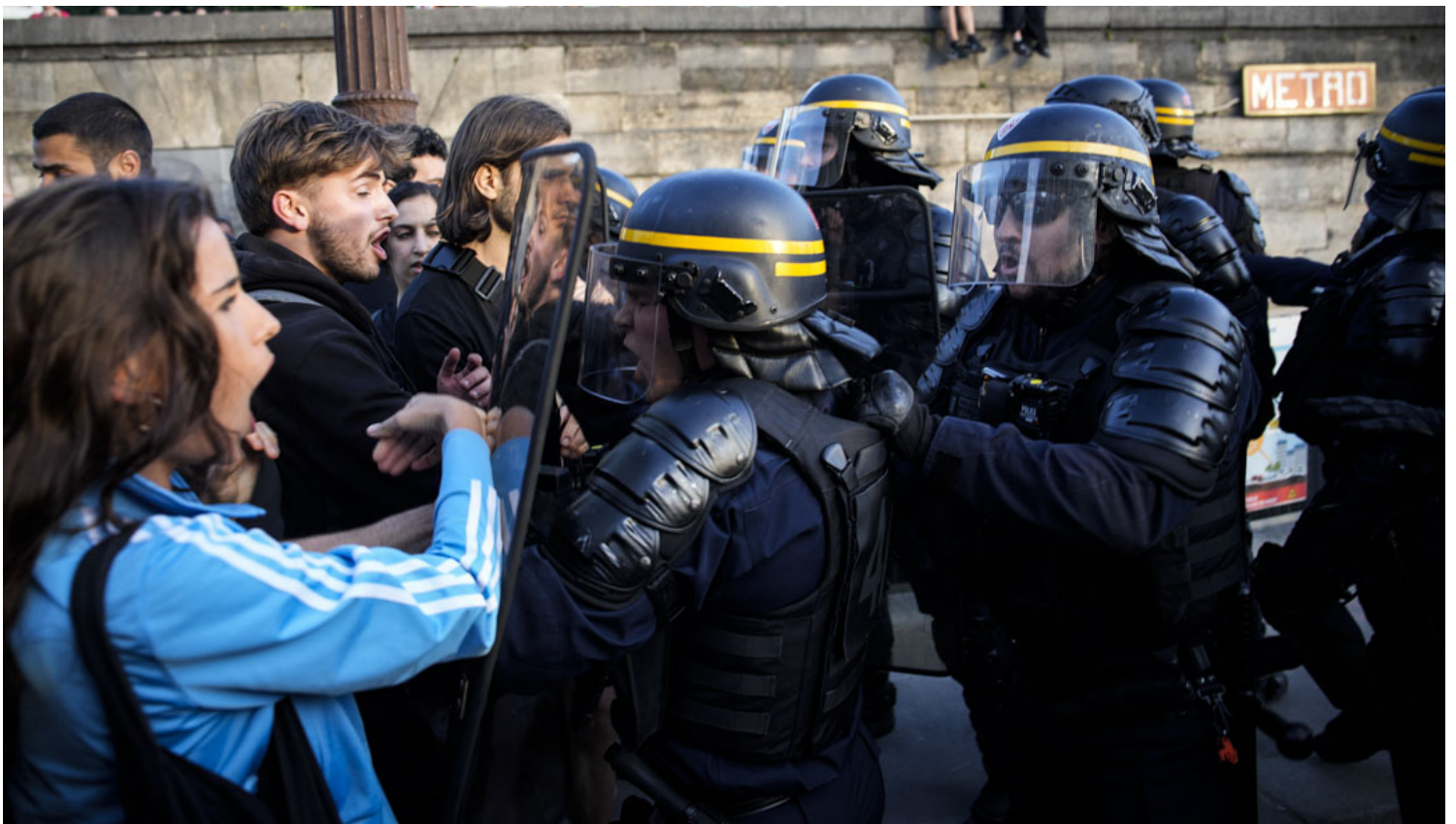
2023年6月30日，法国巴黎，一名17岁青少年被警察枪杀，引发全国骚乱并与警察发生冲突。

面对警察暴力问题，总统马克龙的立场如他面对许多其他议题时一样反复横跳。2017年竞选期间，马克龙曾明确谴责过警察暴力。但当他上台遭遇“黄背心”后，又改口声称“在法治国家，‘警察暴力’这种字眼是不可接受的”。