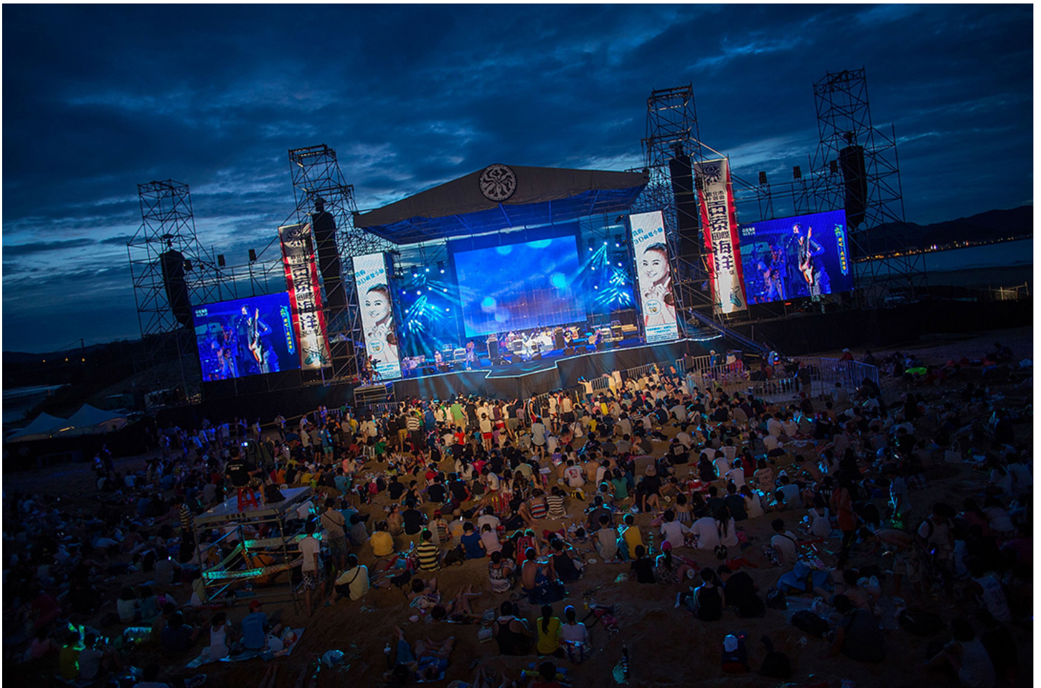
台湾乐队苏打绿于2013年，在沙滩上举行的音乐节上演出。

呼吁文化部，在盛大的典礼之外，阐述该届颁奖脉络与方向，让其后续效应能进入真正的文化讨论，金曲奖才能在受到质疑以外，主动向大众伸出橄榄枝，负起美学责任，正如葛西瓦的专辑名称“我这里有一批很纯的你要不要”，金曲奖不能只是留下结果与问号，也不能只是讲讲空泛的得奖理由，主动论述必然是奖项是否能扩大效应的唯一解答。