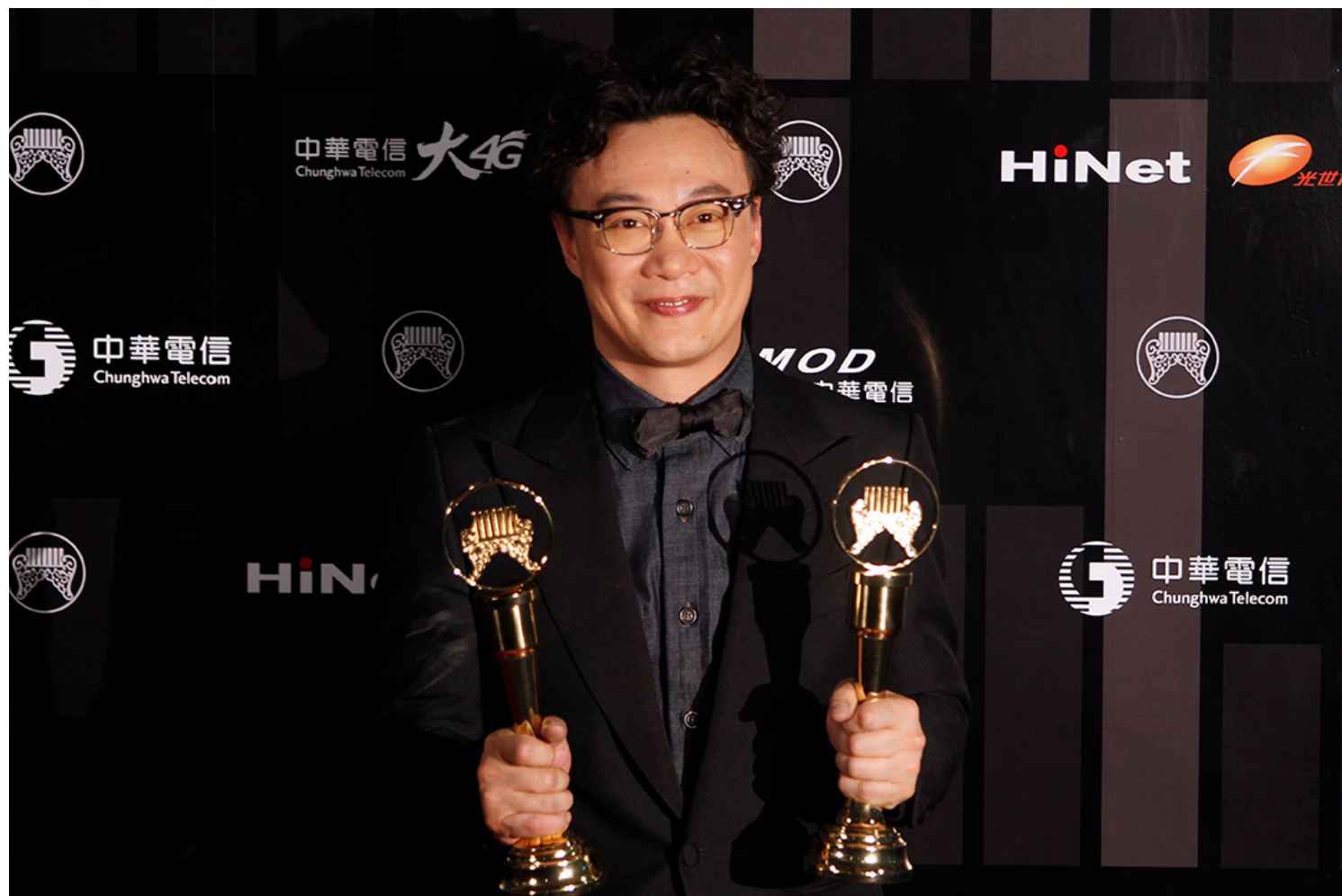
香港歌手陈奕迅于2018年出席第29届金曲奖颁奖礼，获最佳国语男歌手奖和最佳专辑奖。

从来就是金曲奖的一部分，从王菲、陈奕迅等多次入围、而创作歌手何韵诗、卢凯彤与岑宁儿等，都给予了台湾市场与金曲奖激荡。