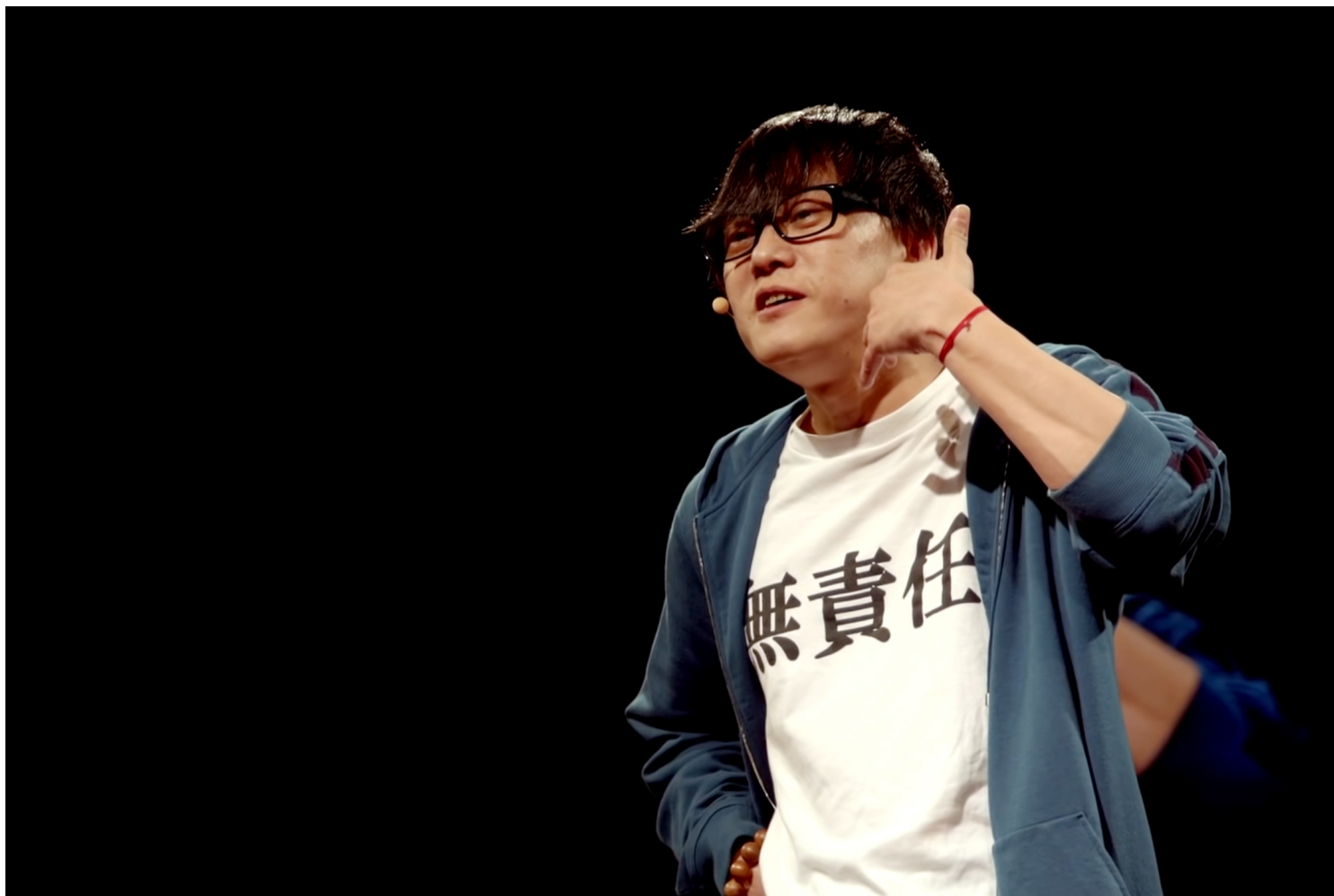
香港填词人林夕在TED Talks上演讲。YouTube截图

台湾金曲奖以自由为资产传承，但毕竟至今仍以“语言分类”为主，香港作者多年霸榜，粤语歌词却从未被提名、获奖。