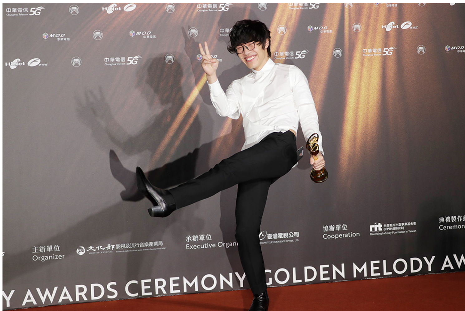
2021年，第32届金曲奖，台湾歌手卢广仲获年度歌曲大奖。