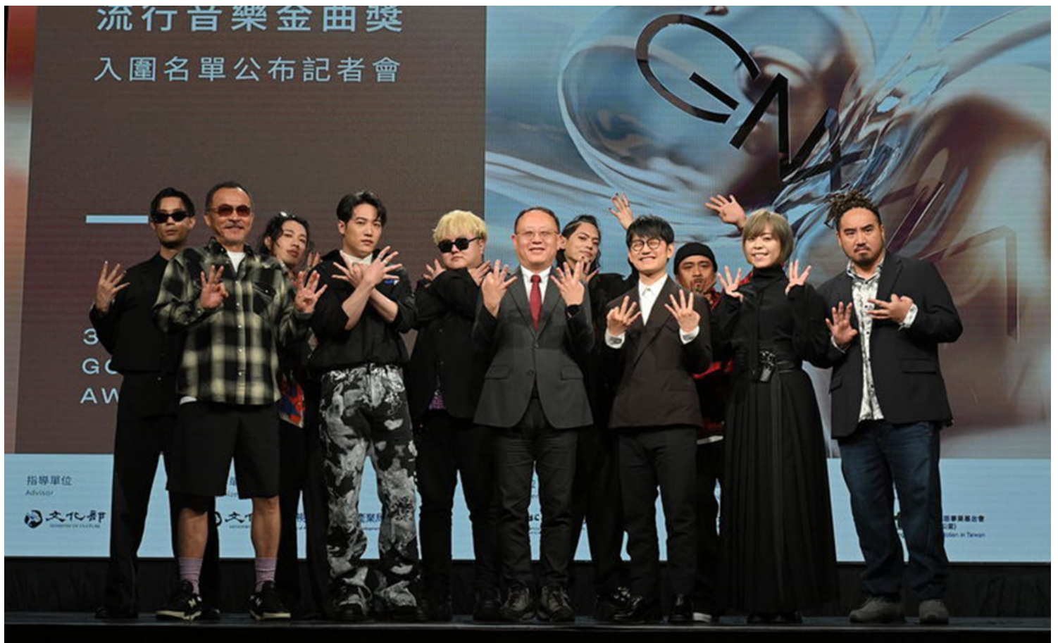
2023年，第34届金曲奖入围记者会。大会图片

台湾人既能理解其他华语（mandarin）地区幕前幕后音乐人的魅力与实力，也毫无疑问将这些歌手的音乐，视为台湾音乐文化脉络的一部分。