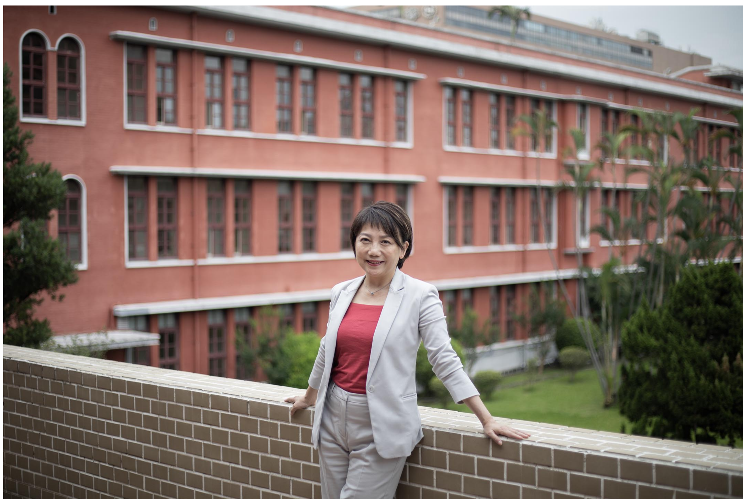
立委范云。

尽管旁人都说性骚扰案大多告不赢，劝她放弃，但范云仍决定诉诸司法：“如果连我这种懂性骚扰法律定义的人去告，都告不赢，那这制度不是有问题吗？”