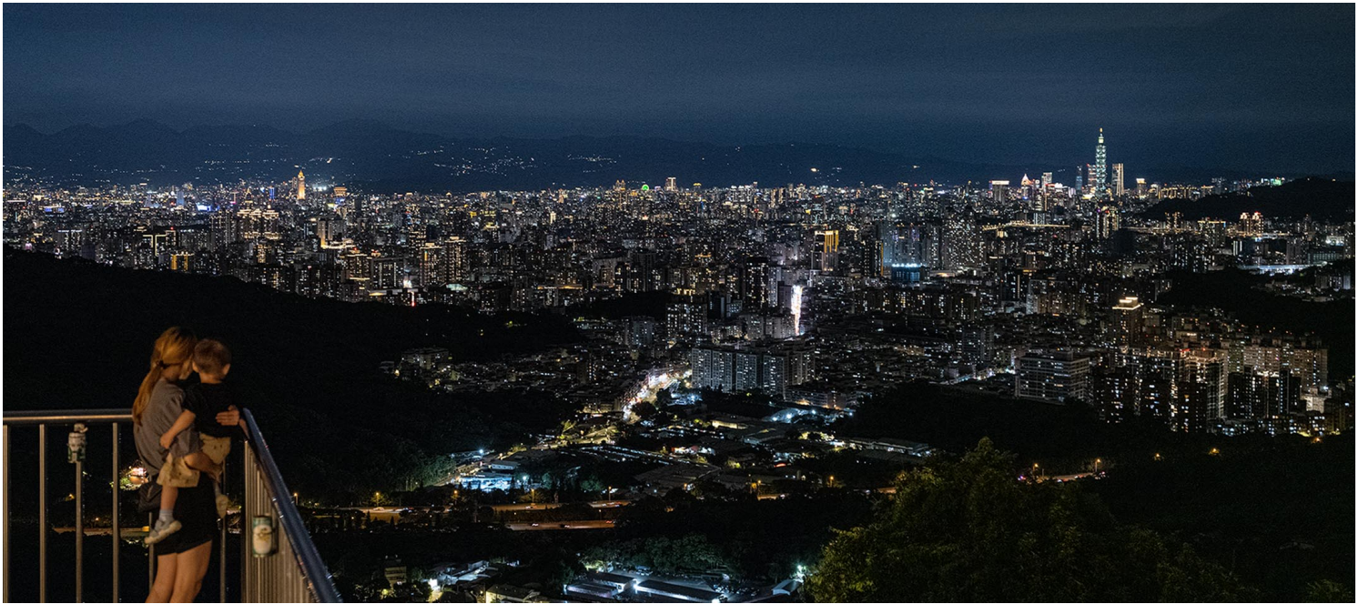
2023年6月28日，台北夜景。