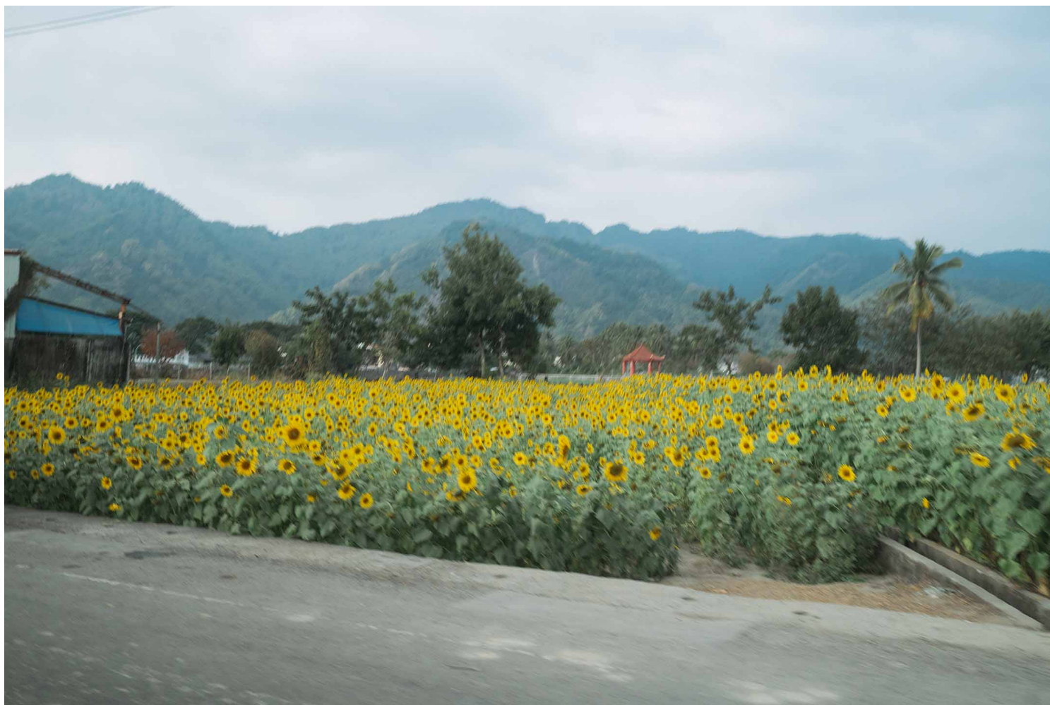
高雄美浓。