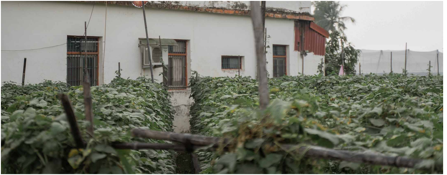
高雄美浓。