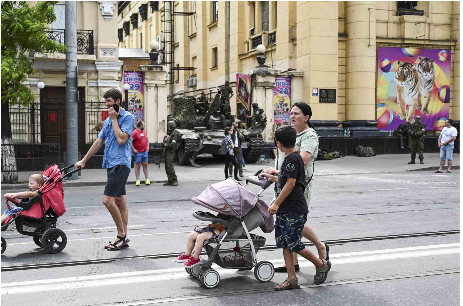
2023年6月24日，俄罗斯顿河畔罗斯托夫市，人们走过由瓦格纳私人雇佣兵集团战士控制的南部军区总部附近的当地马戏团。