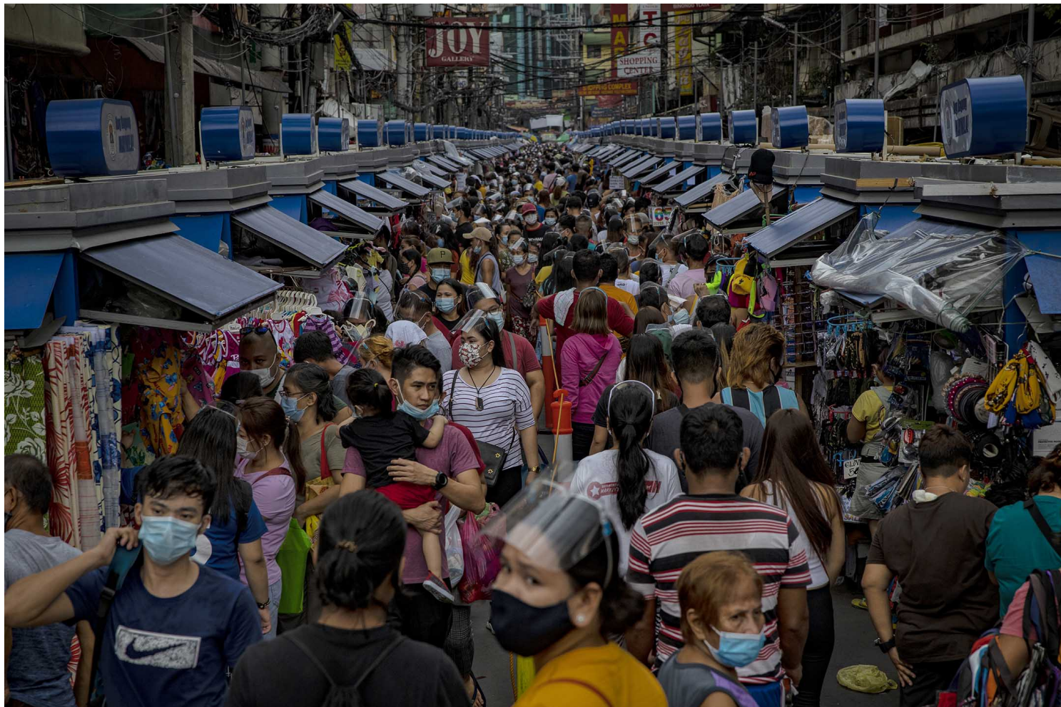
2020年12月13日，菲律宾马尼拉，市民戴著口罩走进市场。