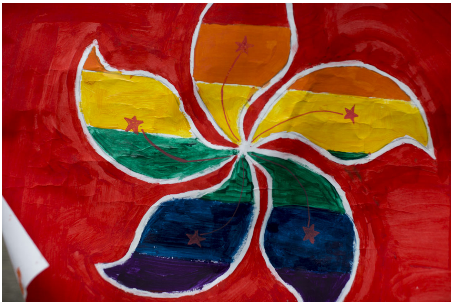
2018年11月17日，香港同志大游行。

也正因为旧有社会建制的力量是如此之巨，我们才更应该认识到这些也许昙花一现的情感的可贵，肯定女性和性小众群体在流动中切实的生命经验，避免过于简单武断地下结论。