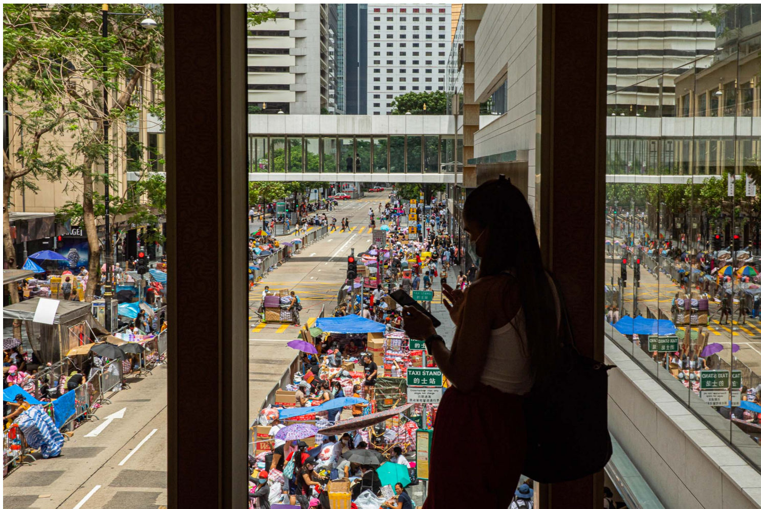
2021年5月30日，不少外佣在周日时在中环聚会。

在时空多线并进、归属感和爱恨反复消长的跨国流动中，“家园”不再是旅程的唯一终点。如果我们考虑到养家的重担、育儿的艰辛、中介的精明、雇主的阴晴不定，还有人在异乡的孤独，对未知的焦虑，对爱和被爱的渴望……那么或许我们会对这些移工女性所穿行的无数边界（从一个国家到另一个国家，一个家庭到另一个家庭，饱受贫穷却日日见证巨富，正值青春而常伴孤老弱童病者左右…）有多一点点的认识，而爱欲纠缠也许只是她们所穿行的无数边界中最易于理解的一部分。