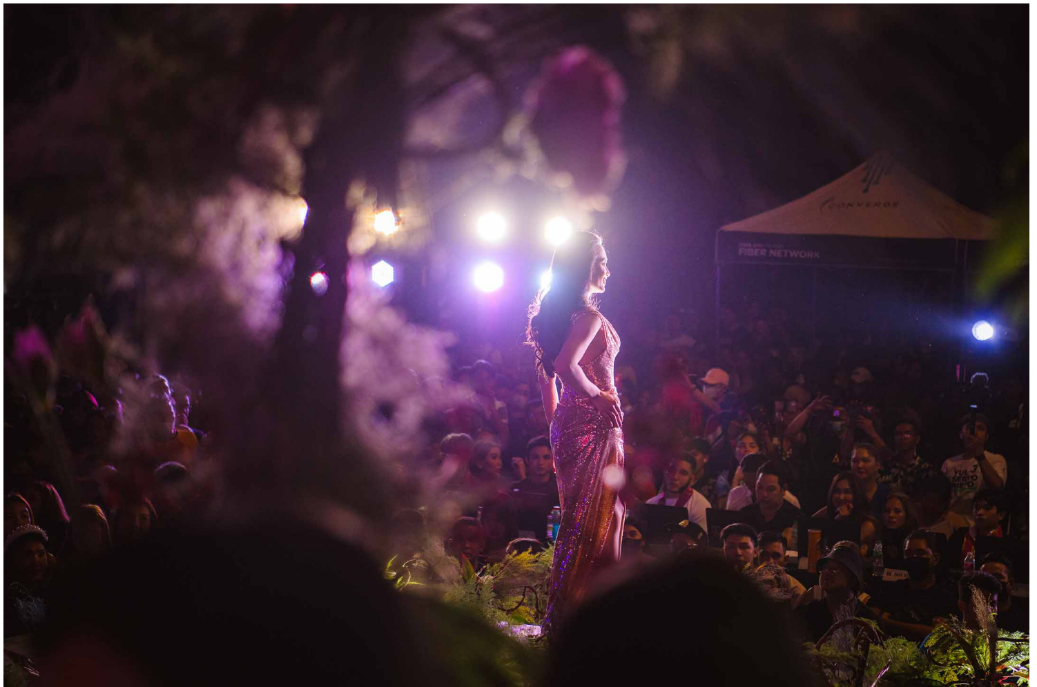
2023年1月13日，菲律宾马尼拉，跨性别者在舞台上表演。

不过我更加在意的，是Rosemary在叙述过程中所体现的对这种“漂亮”的强烈认同——“漂亮”其实是Rosemary内心的一种投射，反映出她对这种亲密关系的肯定；而对原因的“好奇”则令Rosemary渴望有朝一日也能获得一段类似的感情，拥有被伴侣呵护、成为“焦点人物”的特权。