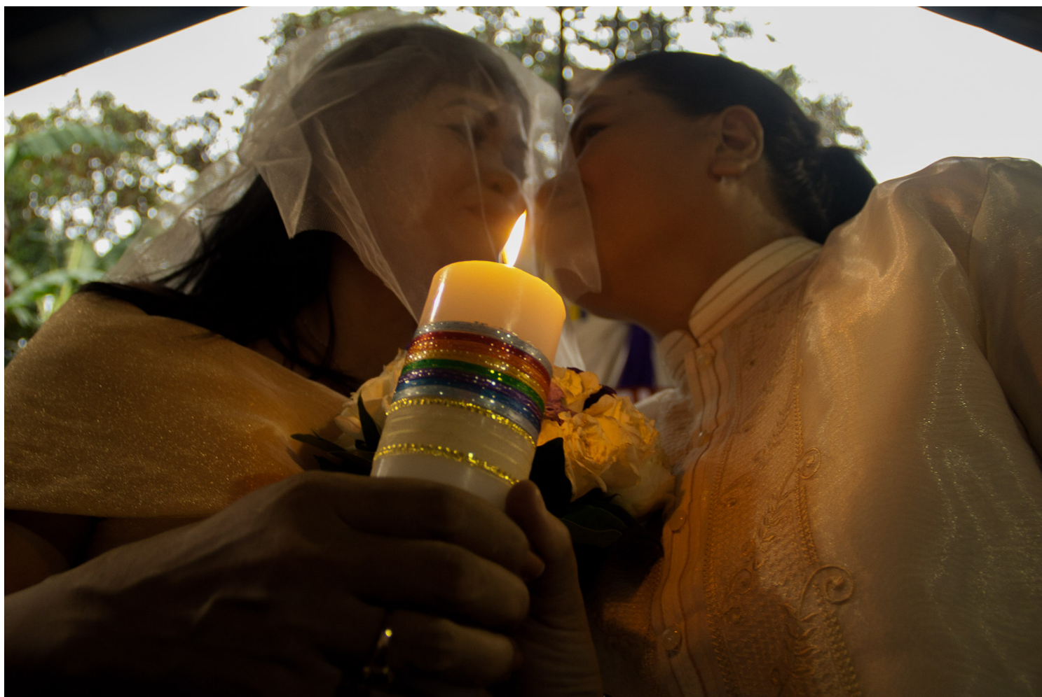
2016年6月26日，菲律宾马尼拉的同志婚礼。

她/ta们有的是单身或已婚的女性，有的是生育几个孩子的母亲，但都曾与一位或多位同性伴侣保持着或公开或隐秘的恋爱关系。