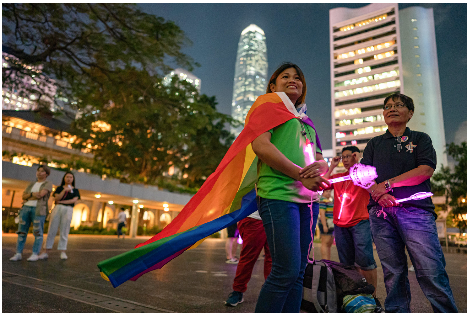
2019年5月17日，LGBT支持者手持荧光棒，参加香港举行的国际反恐同日集会。

就同志权益而言，身为前殖民地的香港受欧美同志平权运动的影响不小，连续多年举办骄傲游行，令公众对于性小众社群的认知大大增长……虽然比不过加拿大这样的更发达、移民政策也更友好的国家，上述种种至少令香港赶超很多移工薪资更低、个体更没有保障、公共参与更加受限的国家，成为“比上不足，比下有余”的所在。