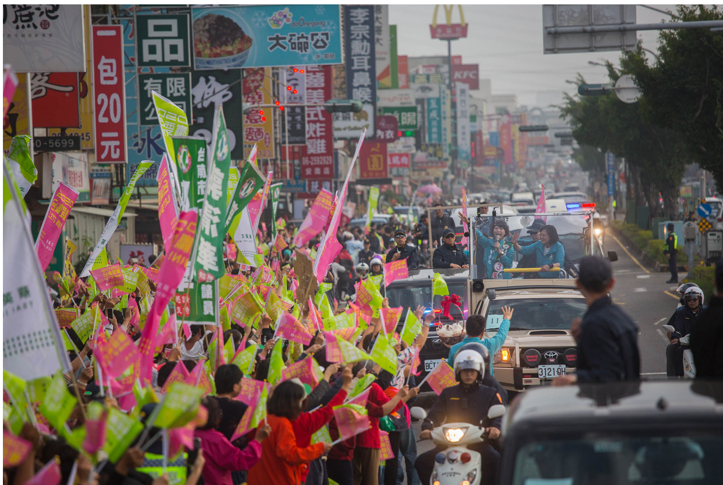
2020年1月6日，蔡英文於台南掃街拜票。

政治工作的旅程並非一帆風順，其中不乏困難和挑戰，我也曾陷入沮喪和失望的情緒，有時，即使全力以赴，也無法達到所追求的目標。我想，我最感受深刻的，是領悟到「如何平衡派系利益」與所謂的「必要之惡」，意識到政治世界並非單一的黑與白，而是充斥各式的灰色地帶。但我始終相信，只要堅守自己的原則，努力追求公共利益，我們終將在這個充滿挑戰的世界中，找到屬於自己的戰鬥位置。