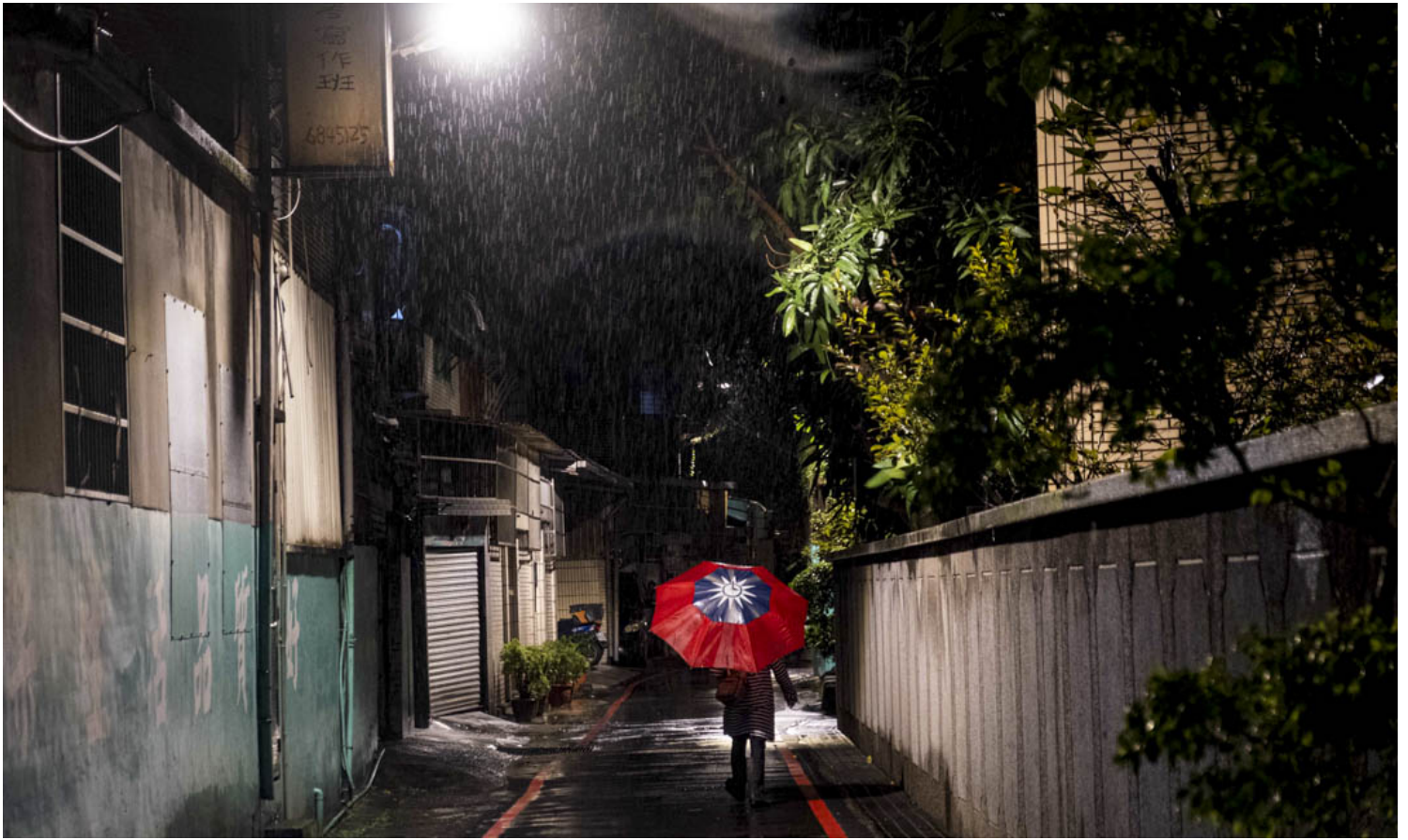
2022年10月19日，一名國民黨的支持者在參加造勢晚會後離開。

政治工作充斥著利益衝突、權謀角力和人性的陰暗面。在利益、權力和現實多方的限制下，主管們做出的決定通常是不符合道德標準和理想主義的，更多是「以大局為重」。