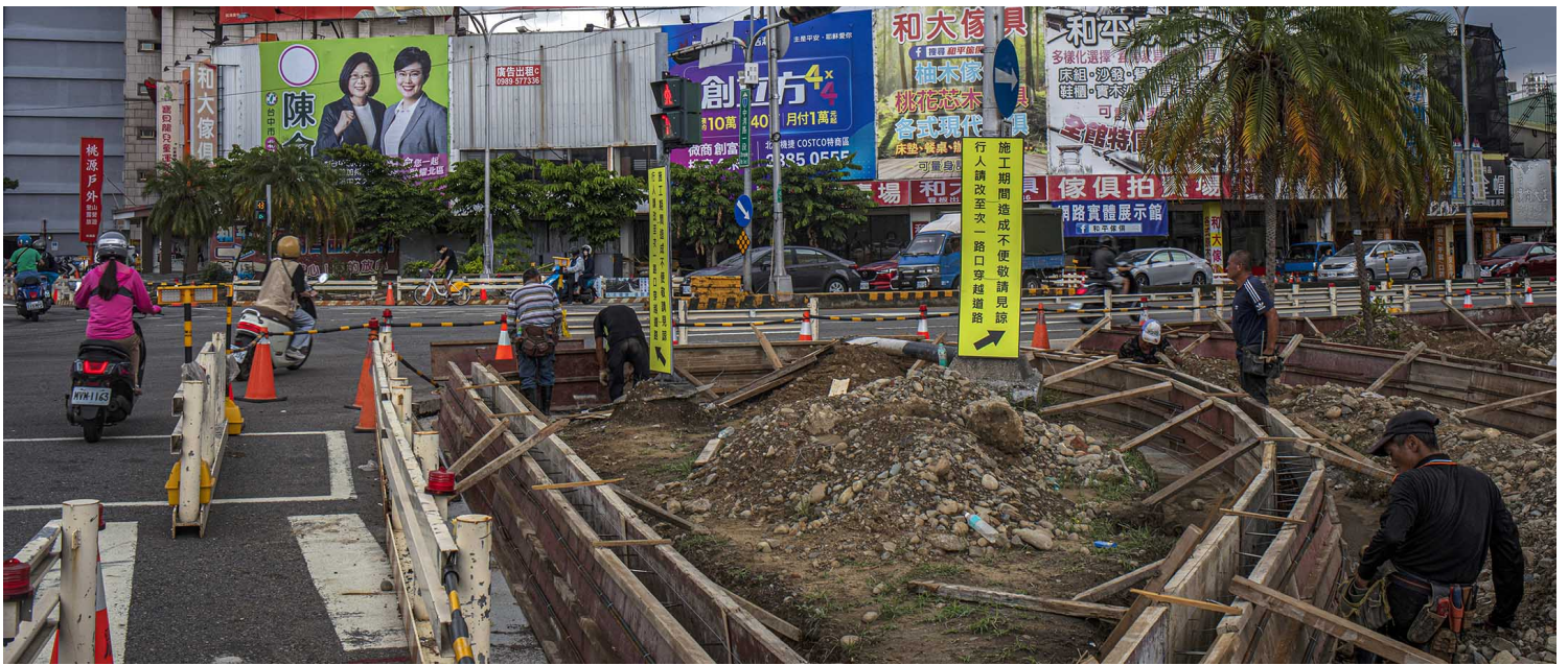
2022年8月18日，台中的競選廣告。