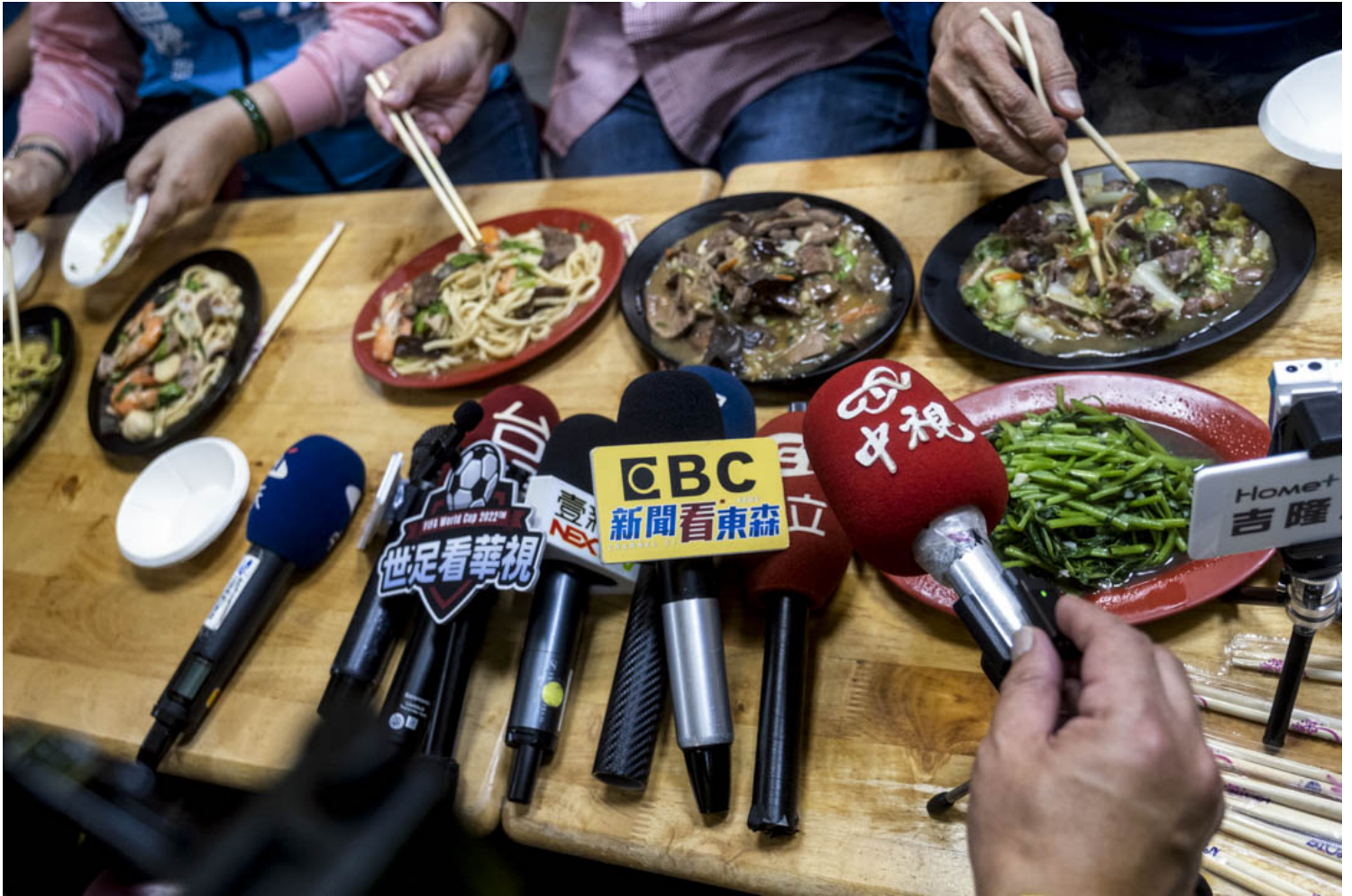
2022年11月24日，民進黨基隆市長候選人謝國樑在拜訪市場期間吃飯，傳媒放下咪高峰收音。

這段選舉經驗深深影響了我對議題的看法，同時培養自身對社會公益和公共事務的熱情，更深刻地體會到政治決策的複雜性和關鍵性——面對問題時，並非一味的指責，而是思考是否有更佳解方。