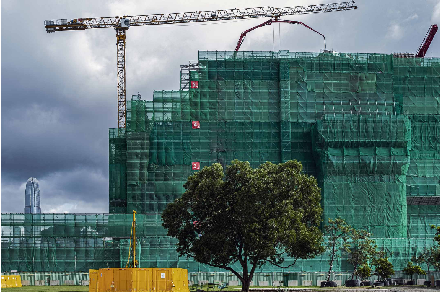
2020年6月13日，香港西九文化區。

好像是這樣的，在巨大殘酷的權力下，我們也有了理由對彼此殘酷，弱肉強食是相對的，總有比你更弱的不是嗎？哪怕以閒雲野鶴姿態做文化藝術工作也逃不過，新的方向、新的審查、新的機會、新的競爭，你要不要加入，要不要搵食？