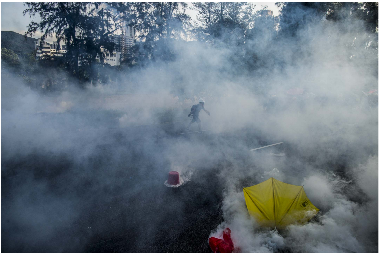
2019年8月5日，警察施放催淚彈驅散示威者。

又幾日，我在她的instagram和朋友圈還是看到了這些照片，哈維爾海報藏在最後一張。