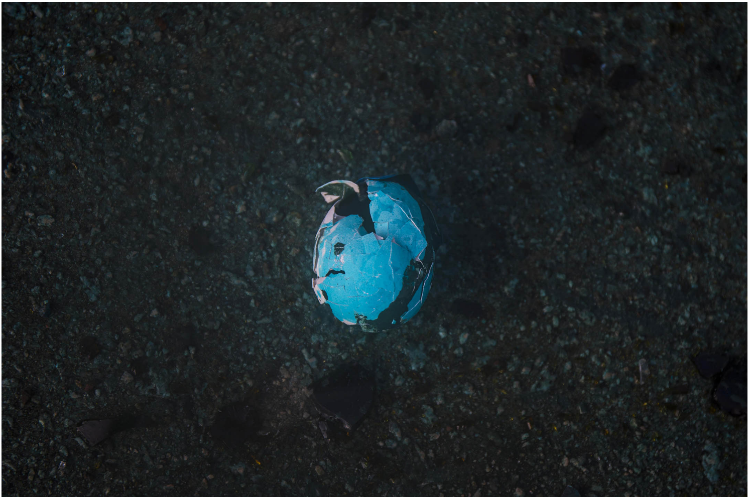
2019年11月17日香港，示威者佔領香港理工大學，堵塞了紅磡海底隧道，警方出動水炮車驅散路面的示威者，一隻破爛的雞蛋被水炮車的藍色液體染色。

可能因為畫風很醜，更可能是彼時時代對我們尚還手軟，總之我看的時候只覺好笑。到今日，才發覺這男人原是我們的真實寫照，在這狗一樣的歲月裡，多的是血流滿地、匍匐「正常」生活的人。