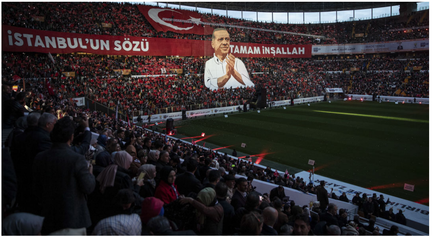
2022年11月27日，埃爾多安（Recep Tayyip Erdoğan）及其領導的執政黨「正義與發展黨」（AKP）在土耳其伊斯坦布爾舉行的體育場集會上展示了總統埃爾多安的巨幅海報。