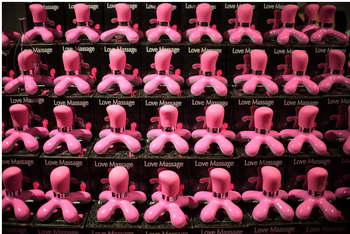
五顏六色的性玩具在成人博覽會上。

在這樣相對寬鬆開放的成長環境中，加上一些可以支配的錢，一個自己獨享、不跟姊妹一起住的房間，讓我得以有了探索自己的窗口。就像伍爾夫說，女人要有自己的房間，可能不只是書房，也要有自己的臥房。