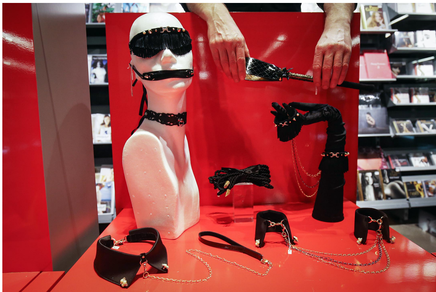
德國一間商店，一名員工將性玩具放置在陳列櫃。

Inno Plug其實是個很大的類別，即使不「走後門」，純興趣也可以玩，比如我自己的經驗裏，會覺得有趣的是幫伴侶戴一個尾巴，或者戴一個亮晶晶的東西，可以看作一個純粹的玩具。我很喜歡給別人帶，因為我想知道插入是什麼感覺，我也一直想戴dildo插男性，英文裏叫pegging，曾經問過，但都被拒絕了。