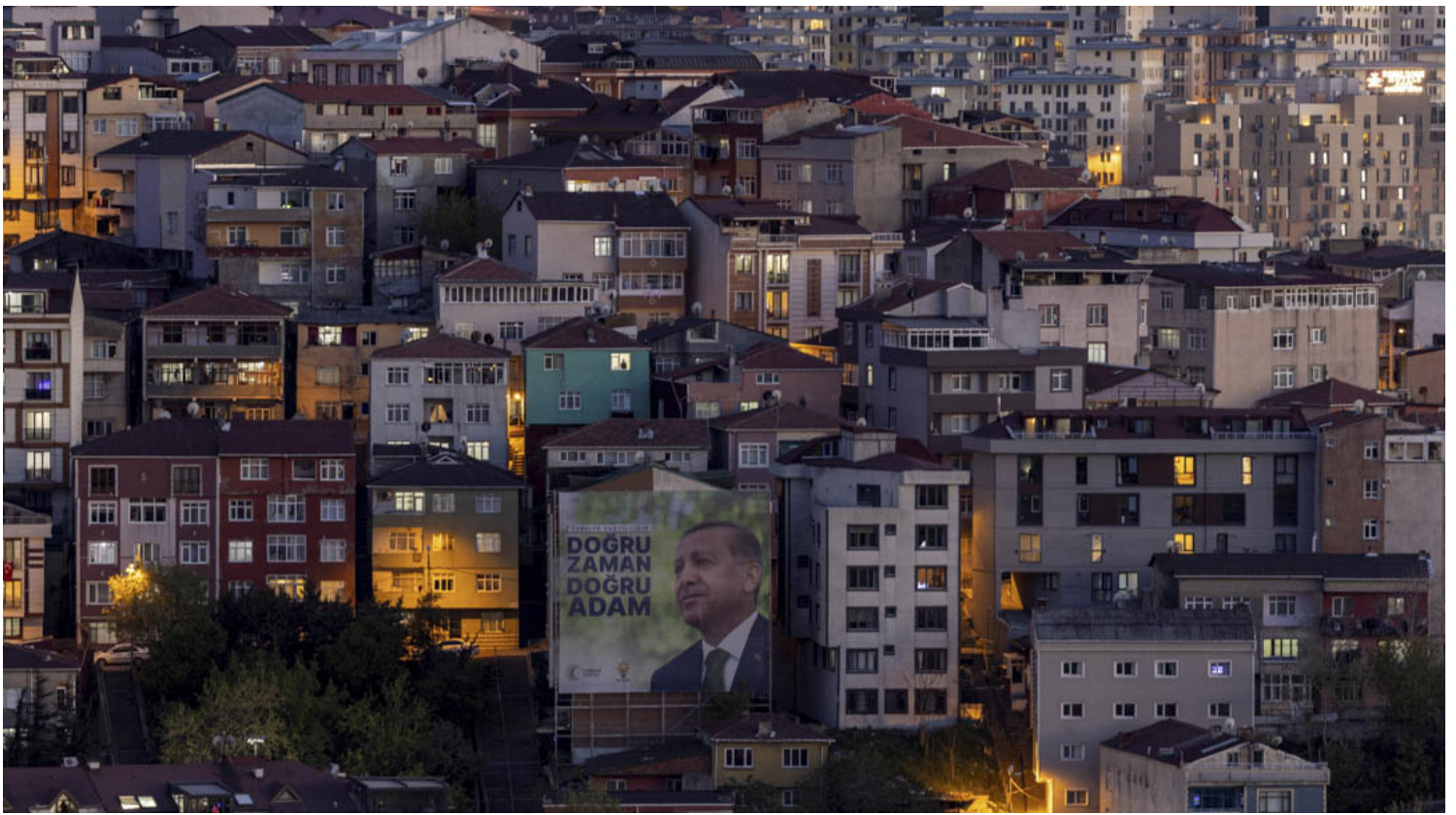
2023年4月25日，土耳其伊斯坦布爾，現任總統厄爾多安的選舉廣告在一座建築物上。

根據非政府組織人權觀察（Human Rights Watch），幾個月來，被逮捕和驅逐到敘利亞的人數一直在增加。該組織在2022年10月的報告中警告說：「以這種方式被驅逐的敘利亞人說，他們在家中、工作場所或街上被土耳其官員逮捕，然後在惡劣的條件下被拘留。其中大多數人被通過公路帶到敘利亞北部的過境點，在槍口下被迫過境。」報告出來沒多久，土耳其當局在給人權觀察的一封信中作出回應：「關於敘利亞人被強行和非法驅逐到敘利亞的指控並不反映事實。」